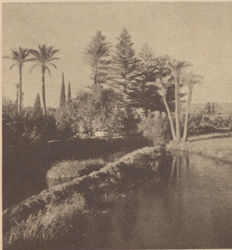
Abbas effendi kertje a Naaman torkolatánál.

Cháluc, cháluc vagyok én, Cháluc, balga, boldog, Nincsen ruhám, nincs cipőm, „Hering“-et se' hordok.