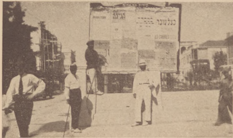
Tel-Aviv-ban a hirdető oszlop előtt.

— Megölték az apámat! — ismételte a gyerek. — El fogok mondani magának mindent. Ahogy történt. Régen volt, még egész kicsike voltam, de úgy emlékszem, mintha tegnap történt volna. Bejöttek a lakásunkba . . . Ordítoztak. Feltörték a szekrényeket, mindent összedobáltak . . . aztán az apámat kiharcolták az uccára. . . Többet nem láttam, csak az apám hangját hallottam be a szobába! Sikoltott! A nevünket kiabálta! Istent hívta és utoljára már csak annyit hallottam: s'má jisroel! s'má jisroel . . . Éjszakánként még most is arra ébredek fel, hogy