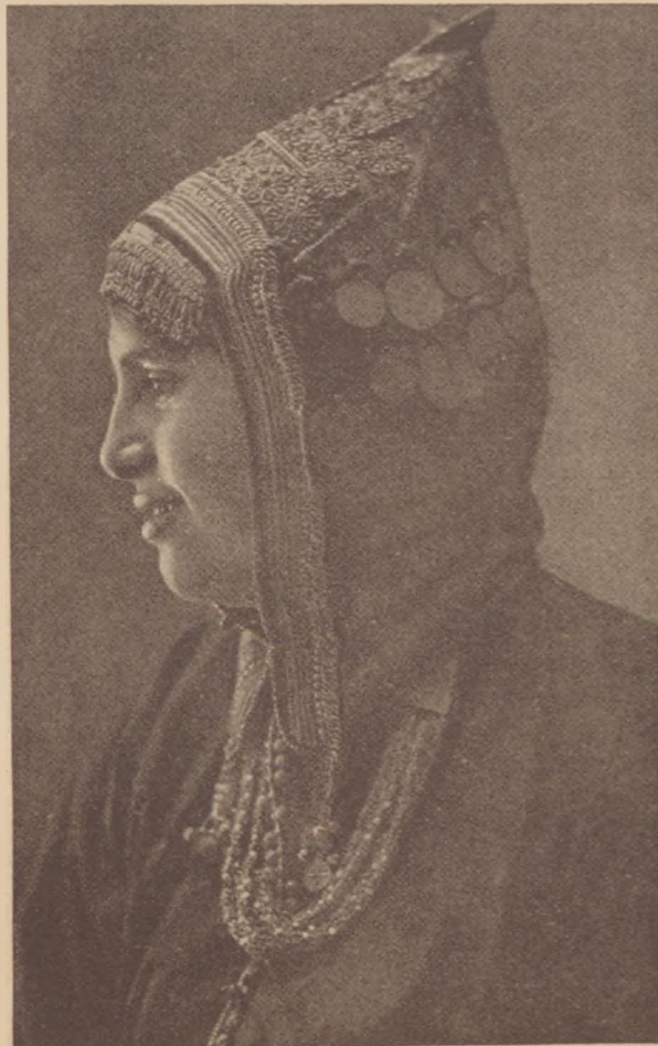
Jemenita leány Jeruzsálemben