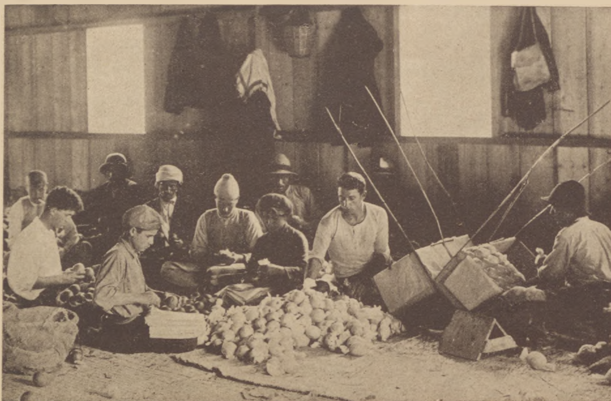
Narancsexport Zichron Jakoból.

— Nem embernek való élet ez! — ismételte az asszony. — Milyen szép volna az életünk, ha abból a pénzből egyik faluban kis házat vásárolnánk, aztán boltot nyitnánk és ott árulnád ezt a sok mindenfélét . . . Szobánk is volna, szép tiszta szobánk és az ablakában muskátli virulna és százszorszép illatozna . . . Én a konyhán volnék és csak neked sütnék meg főznék . . . Szép volna így . . . És boldogok lennénk . . .