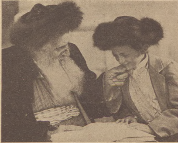
Jeruzsálemi óvárosi típusok

el az apját, akkor az apja nem is hal meg. Csak az hal meg, akit elfelejtenek.