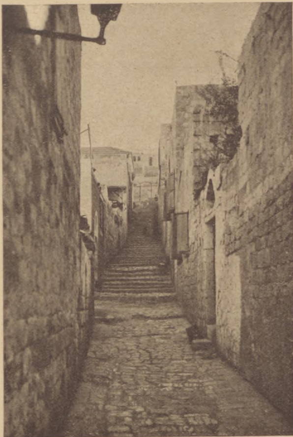
Régi uca Haifában

II. Rudolf császár idejében érkezett Prágába rabbi Becalel Lów, a nagynevű tudós, akit a prágai zsidók főrabbinak választottak meg. A zsidóvárosban, közel a Moldva partjához abban a házban lakott, amelyen még ma is az ő jelvénye, szőlőfürt és oroszlán, található. Rabbi Becalel összeköttetésben állott az összes tudósokkal, akik akkoriban Prágában az udvarnál tartózkodtak, Tycho de Brahe, az udvari csillagász pedig gyakran jött el tantermébe, hogy vele tudományos dolgok felől értekezzenek. Egyszer Rudolf császár rendeletet adott ki, mely az összes zsidókat kiltotta Prágából, aminek következtében a zsidóvárosban nagy jajveszékélés támadt. Erre rabbi Becalel Lów elszánta magát, hogy kérni fogja a császárt, hogy ezt a rende-