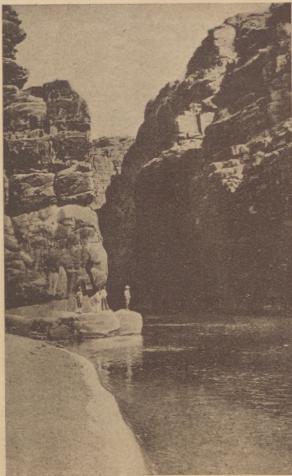
Az Arnonpatak beömlése a Holttengerbe.

— Most Brémából jövök, ahol beavatottaktól hallottam, hogy él az itteni gettóban egy