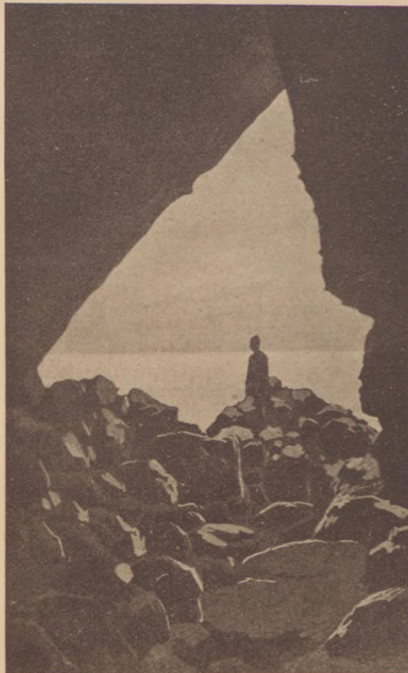
Szodomai sóbarlang a Holttenger partján

Fisan it halálra ítélték, azzal a megokolással, hogy összejátszott a zsidókkal.