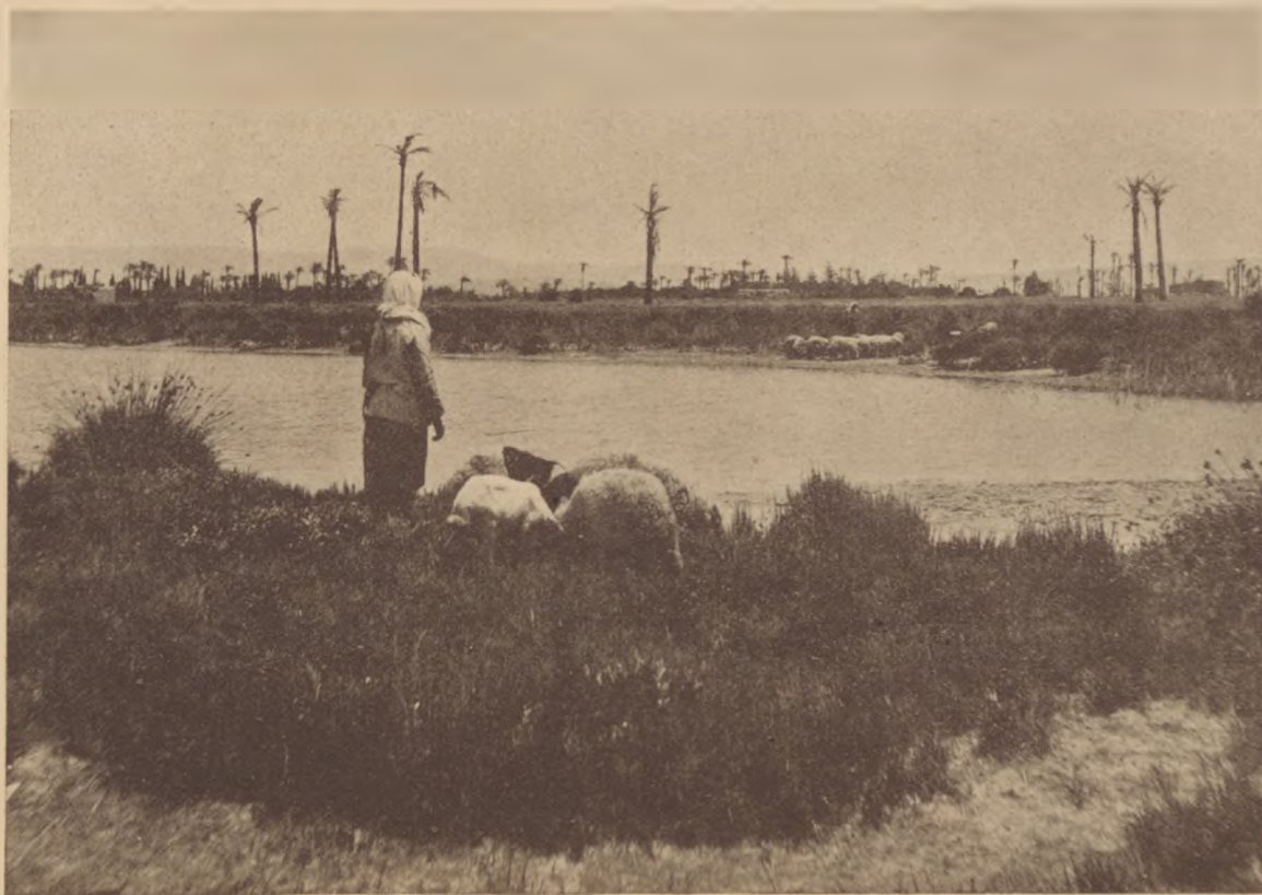
A Naamann patak.

Halkan imádkoznak Jeruzsálem templomaiban. A szefárdokéban csakúgy, mint az askenázokéban, a chászidok épúgy, mint a chabakkabbalisták. Azt az ideges, magátemésztő, vulkánikus kifakadású, hangosan égbetörő imádko-