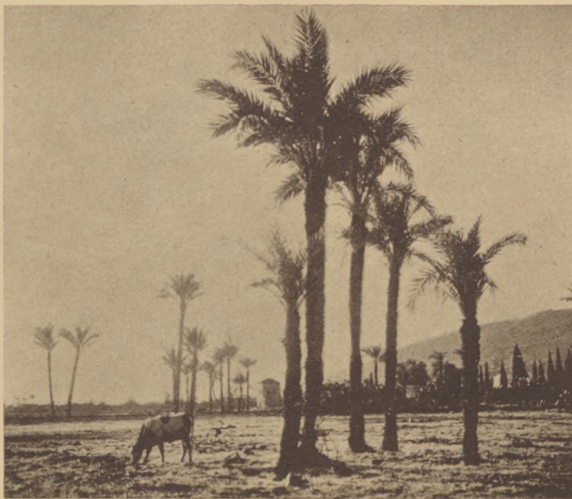
Pálmaliget Haifa mellett. A háttérben a Karmel hegye.