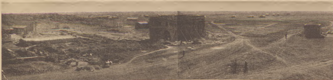
Afuleh, az Émekben keletkező új város.

Az asszony szomorú, lágy hangon felelt: — Ne kérdezd ki vagyok . . . Idegen vagyok, földönfutó vagyok és félek, hogy rám szakad itt az éjszaka . . .