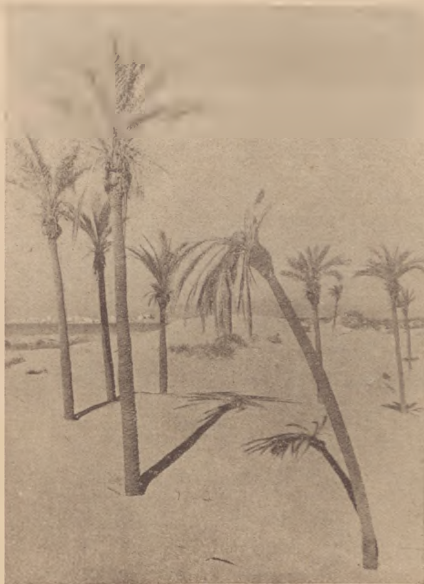
Pálmák Haifa mellett