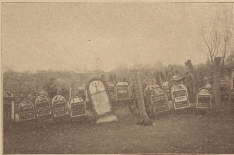
Ukrajnai zsidó temető

Mintha megszólították volna. Hátrafordul, kúsza, ideges szemekkel néz szét. Az ucca elhagyatott, csupán egy kicsi, vézna kaftános figurácska szedegeti ormóttan csizmáját a sárban.