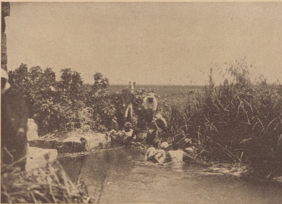
Chálucok mocsárlecsopolási munkája Hatfa mellett

*) Szócs levelének ez a passzusa arra enged következtetni, hogy a bécsi haditanács is tudott Mojzes elrablásáról.