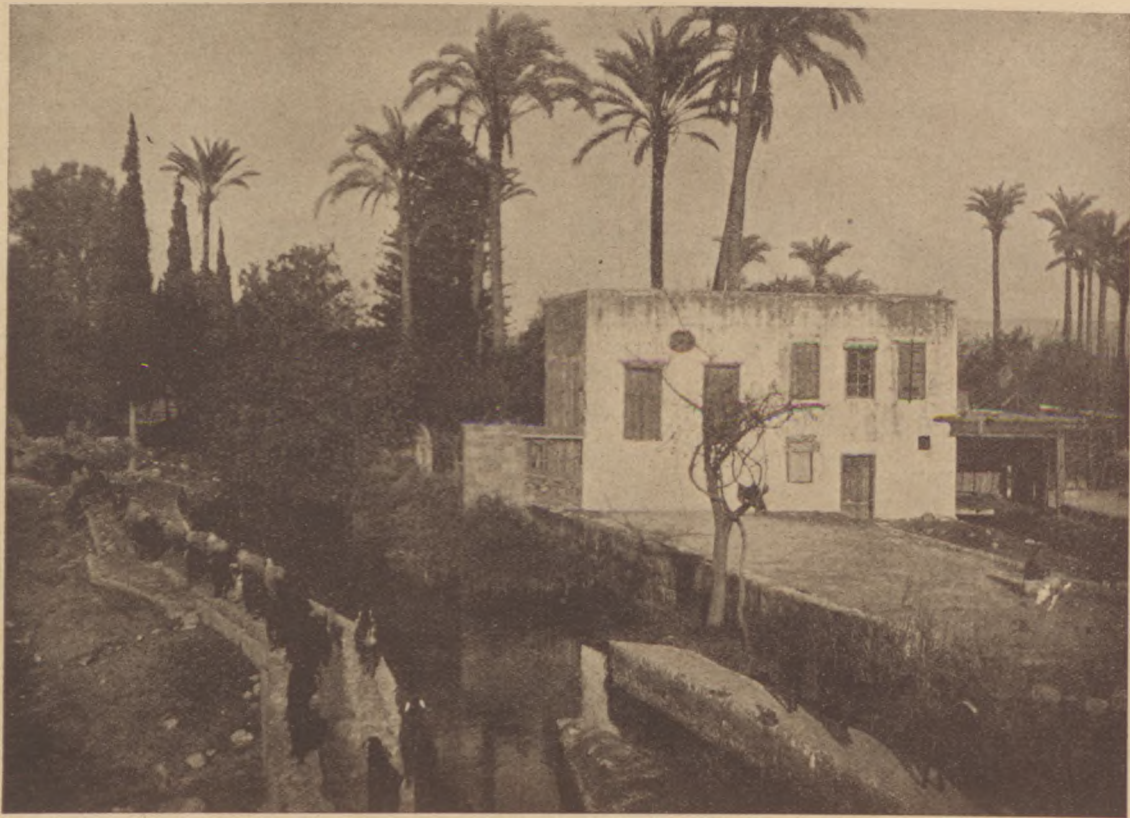
RÉGI MALMOK HAIFA—AKKO KÖZÖTT