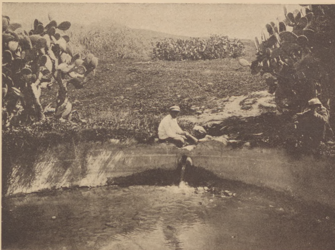
Az Ajn Szamuna („Halál-forrás”), mely a chálucok mocsárlecsapoló munkája után az egész vidék Áldásforrása lett.

nél talán még kissé remeg a keze az izgalomtól, de aztán nekibátorodik és büszkén kiáltja felénk: