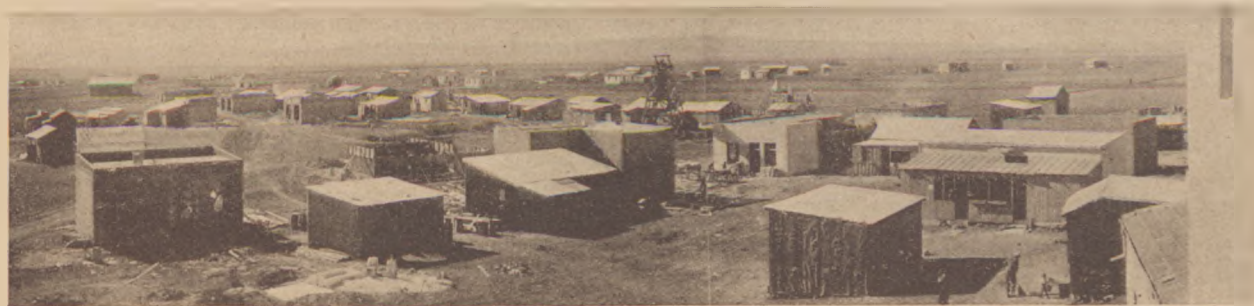
Afuleh, néhány hónappal később.

Az asszony szemei fáradtan lecsukódtak. Fejét odatámasztotta a szekér oldalához és finom, keskeny orrából könnyű pára csapott elő az estéli ködbe. Jaszele pokrótot terített a vég kelmék fölé.