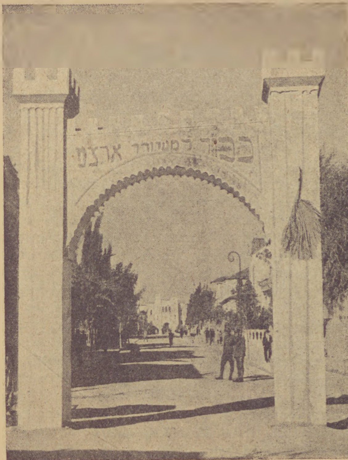
Diadalkapu a palesztinai önkormányzó bevonulására Tel-Avivban.

ban való közlésre, melyet előszavában ígér, mert ennek becsét sem az ifjúság, sem a nagyközön- ség nem érti, éppen ezért nem is igen élvezheti. E különösebb részre lesz módunkban visszatérni. A zsidóság hálájáról és elismeréséről azonban érdemes szerzőnk biztos lehet.