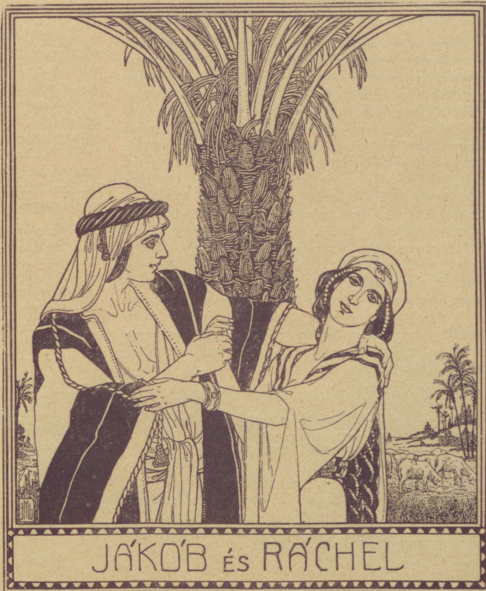
E. M. Lilien: Jákob és Ráchel. (Mutatványkép a magyar Lilien-bibliából.)

Végül megemlíthetem, anélkül, hogy félre-