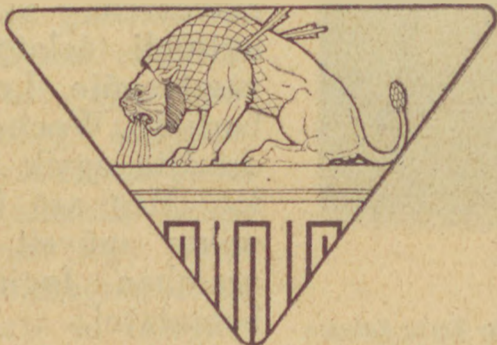
E. M. Lilien rajza

Ha akart volna sem jöhetett volna, mert bevitték a Lipótmezőre. Az ő kis unokája ugyanis már hat évvel azelőtt meghala tüdővészben. De ő minden évben újra átélte a hervadást, amíg tekervényes kis lelke elbírt. Az volt azon esztendő, amelyben már nem bírta többé.