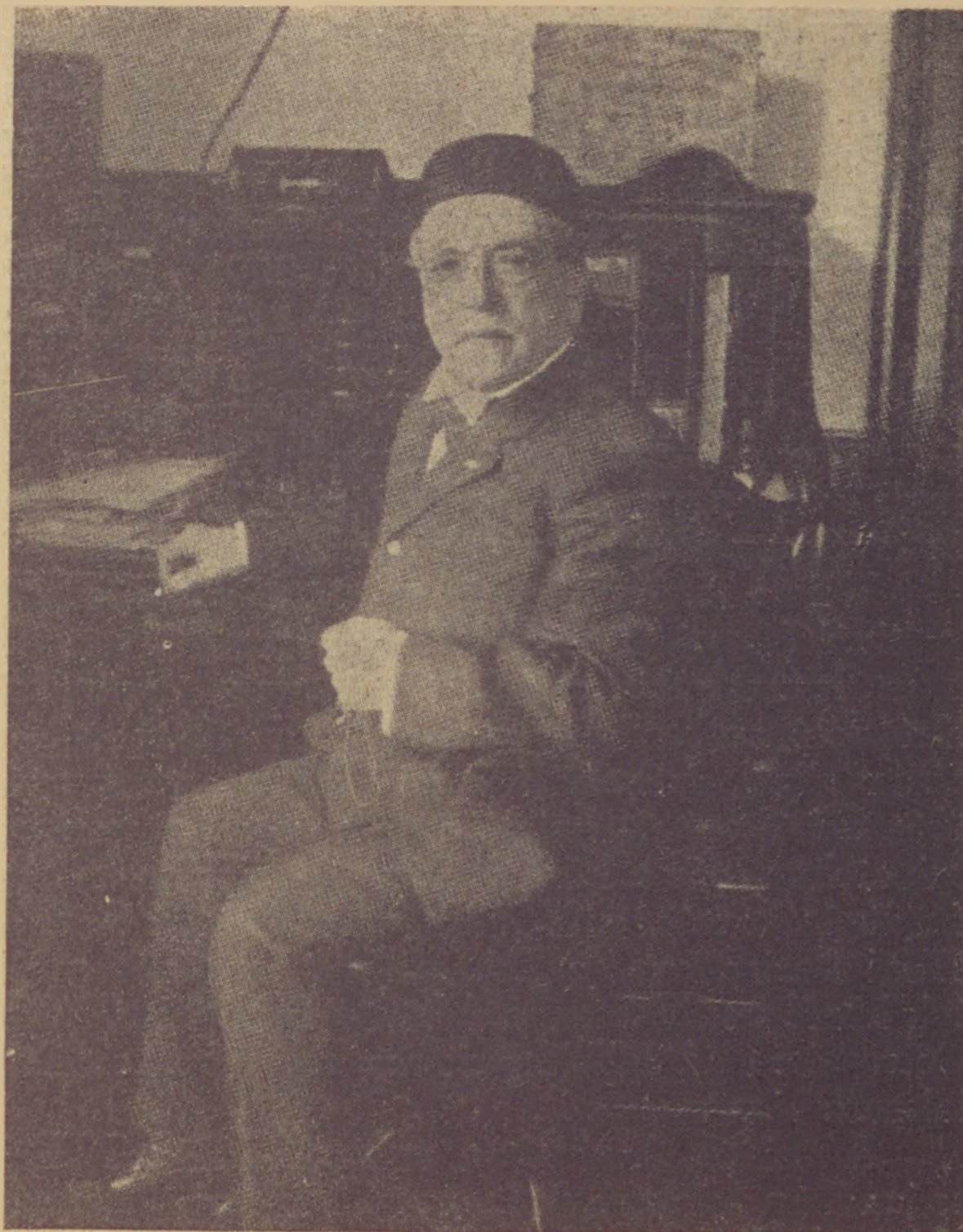
Samuel Gompers, der amerikanische Arbeiterführer. Samuel Gompers, un des chefs des ouvriers américains.

Míg Gompers munkásszövetsége az idők folyamán szinte kispolgárrá fejlődött autochton munkásokat foglalja magában, az újabb bevándorlások folytán állandóan növekedő munkás-