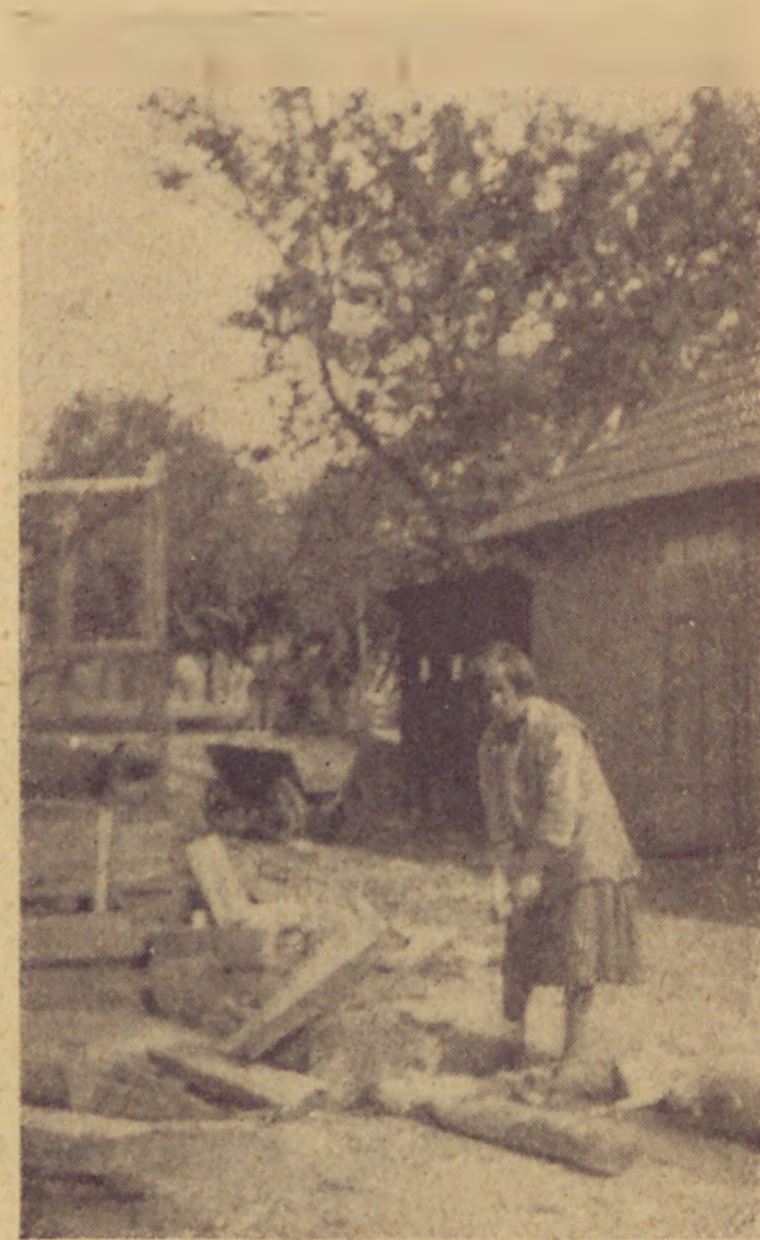
Favágás. Holzhacken. Ferme de jeunes filles juives a Stanislau.