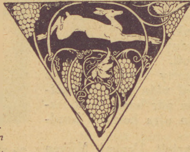
E. M. Lilien rajza.