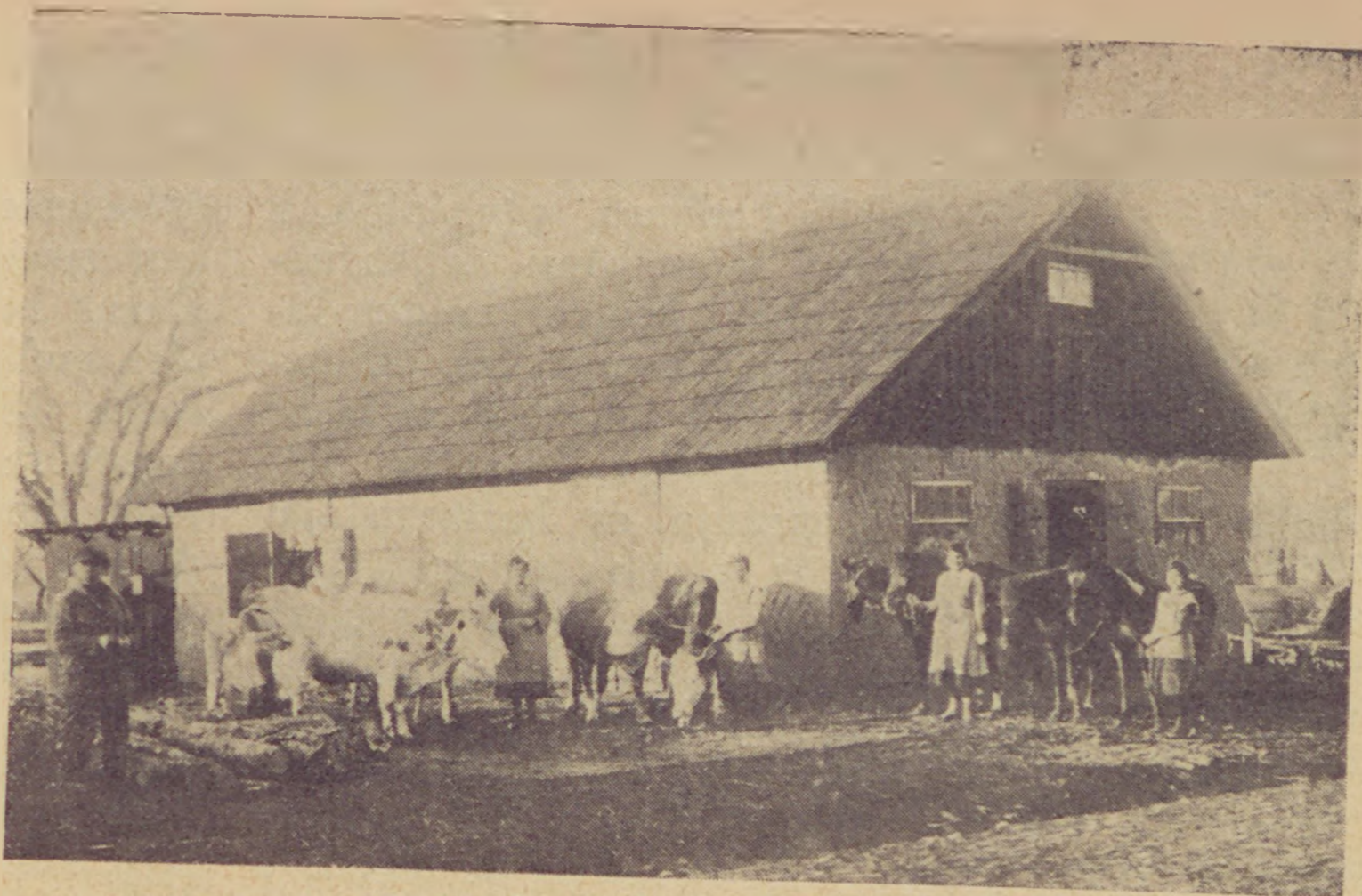
A stanislai zsidó leányfarm.

A leányok tudatában vannak saját maguk és munkájuk értékének, önérzetesen, mondhatnám büszkén készülnek hivatásukra: hogy Palesztínának megteremtsék azt, aminek ott ma még a legnagyobb hiányát látják: a dolgos, képzett zsidó narasztasszonyt.