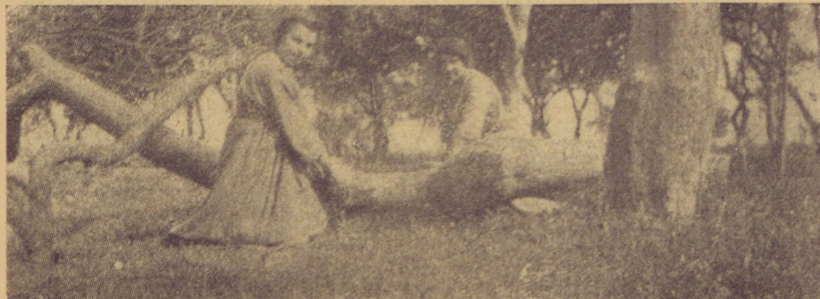
Fadóntés és favágás az erdőben. Jüdische Mädchenfarm in Stanislau

Rittermannal és nejével az élén is csak az adminisztratív ügyeket, beleértve a pénzügyi rendezését, intézi. A farm egyébként autonóm, és mint egy kisköz-