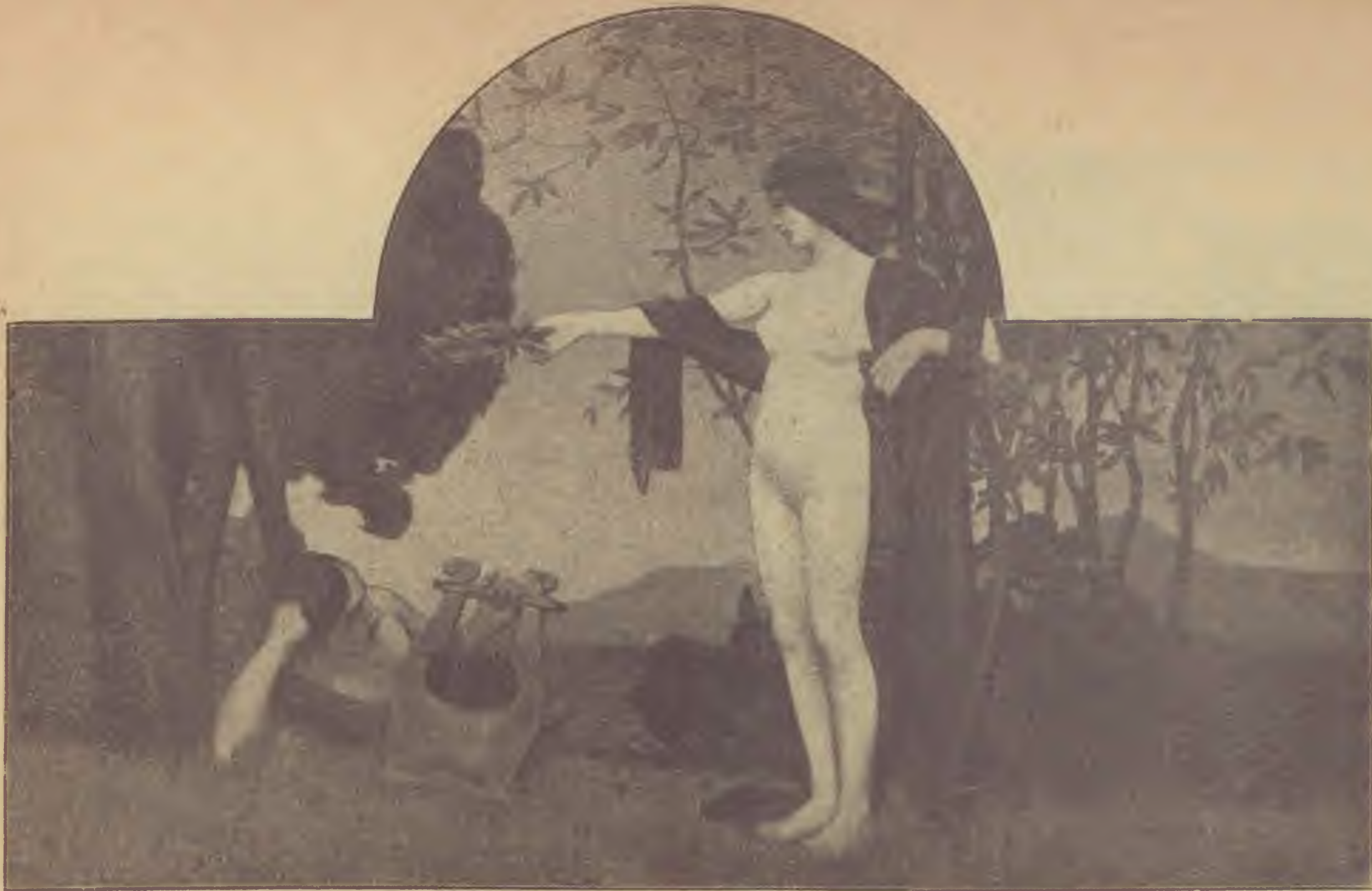
Poesie und Ruhm