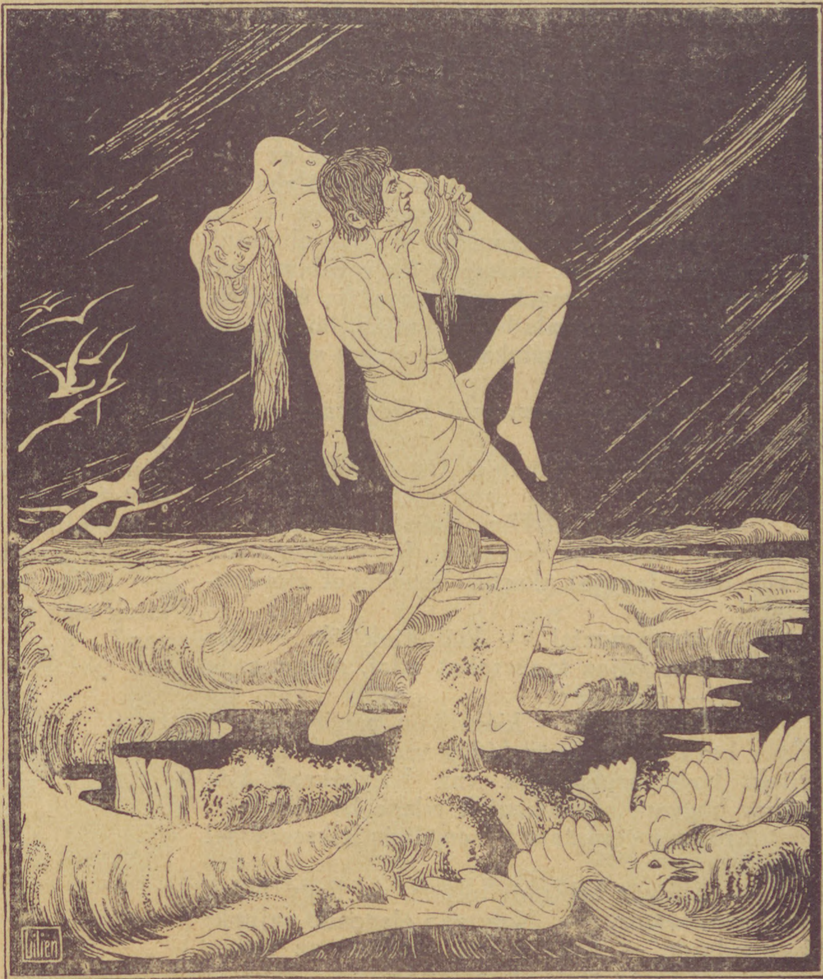
E. M. Lilien: A vízözön. (Mutatványkép a magyar Lilien-bibliából.)

— Igen tisztelt Uraim! A kályha, amelyről most tárgyalunk, tudjátok mi az? — A kályha az egy olyan dolog, melyet különböző anyagból készítenek: Van agyagkályha, van téglából készült kályha, sőt van kőkályha is. Akinek ilyen anyaga van, az bizonyára abból készíti a kályháját. De mit csináljanak ilyen magunkfajta emberek, kiknek nincs ilyen anyagunk? Nekünk tehát abból kell csinálnunk, amink van. És miután va-