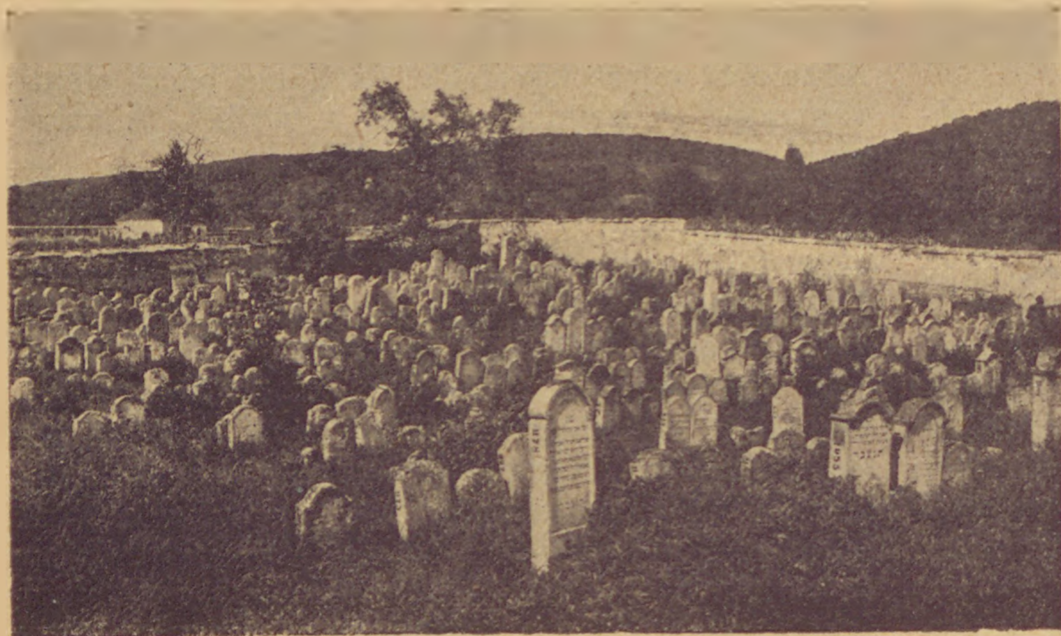
A kismartoni régi temető.

Libát nem vett maga többé, hanem az egyik nőtestvérével hozatott, aki maga is balbószte volt. A gyerekei