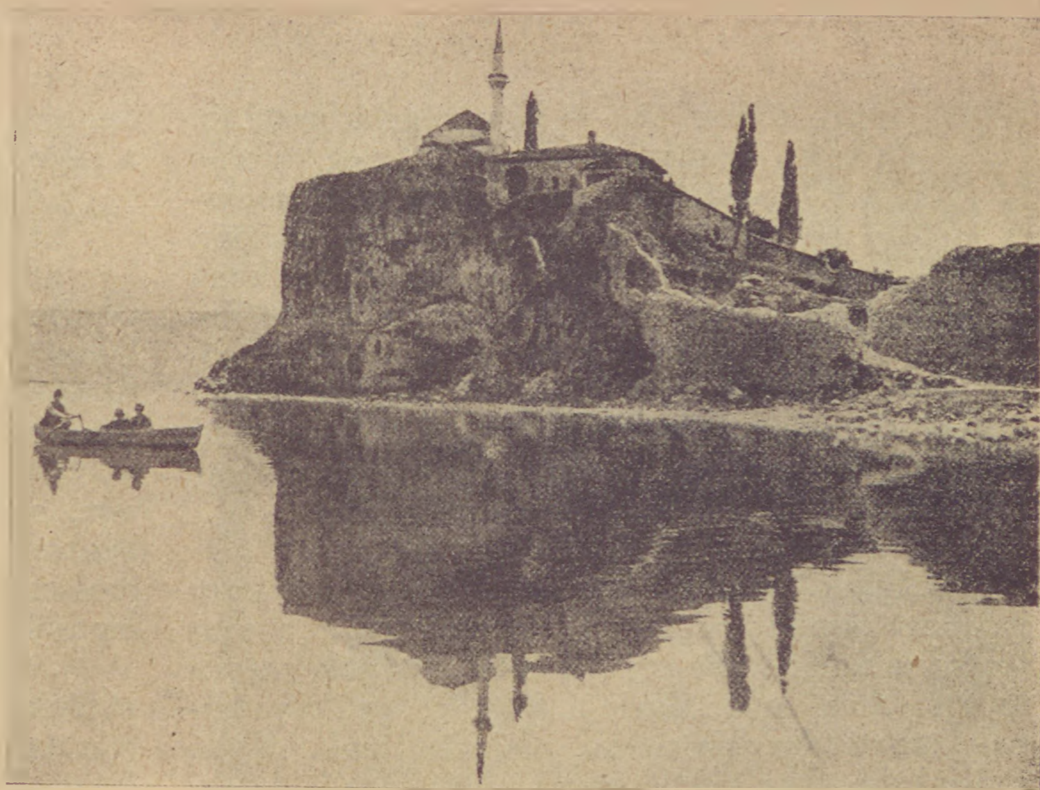
A janinai vár a zsinagóga és mecsettel. Die Burg von Janina mit der Synagoge und Moschee.

Ennek tudatában a görög kultuszminisztérium felszólította a görög történészeket és archeologusokat, hogy sürgősen tegyenek jelentést a zsidó felíratos emlékekről.