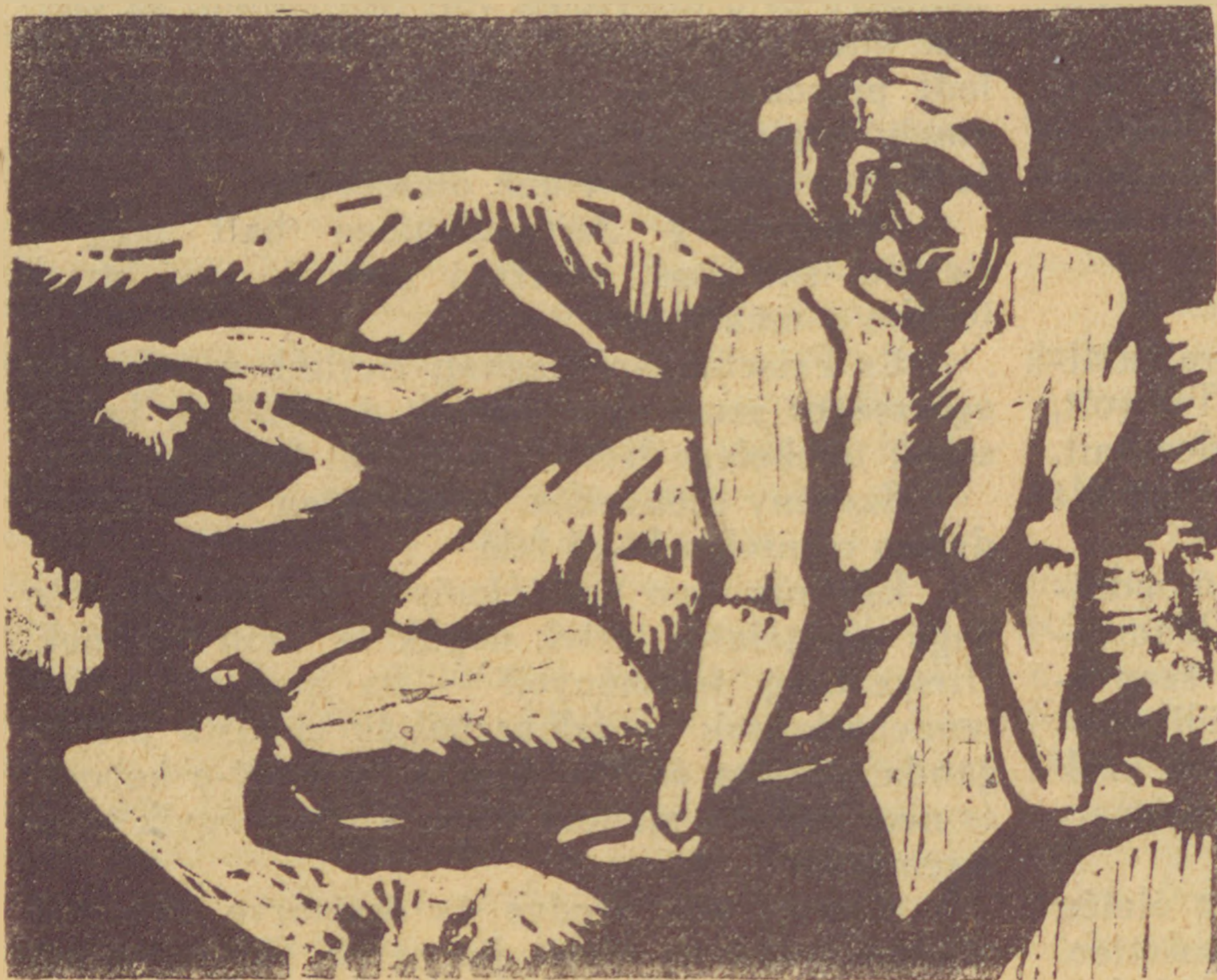
Vidor Pál: Hagar és Ismael. (Fametszet.)

— Bizonyára elhiszem, — mondta a tudálékos bölcs nyugalmal, — hogy maga ott volna mellette, én azonban itt vagyok! És miért vagyok itt és miért nem önála? Merazérthogy az orvos nyilatkozása néha így vagyon, néha amúgy vagyon és a bölcs ember mindennek tudja a maga igazi mér-