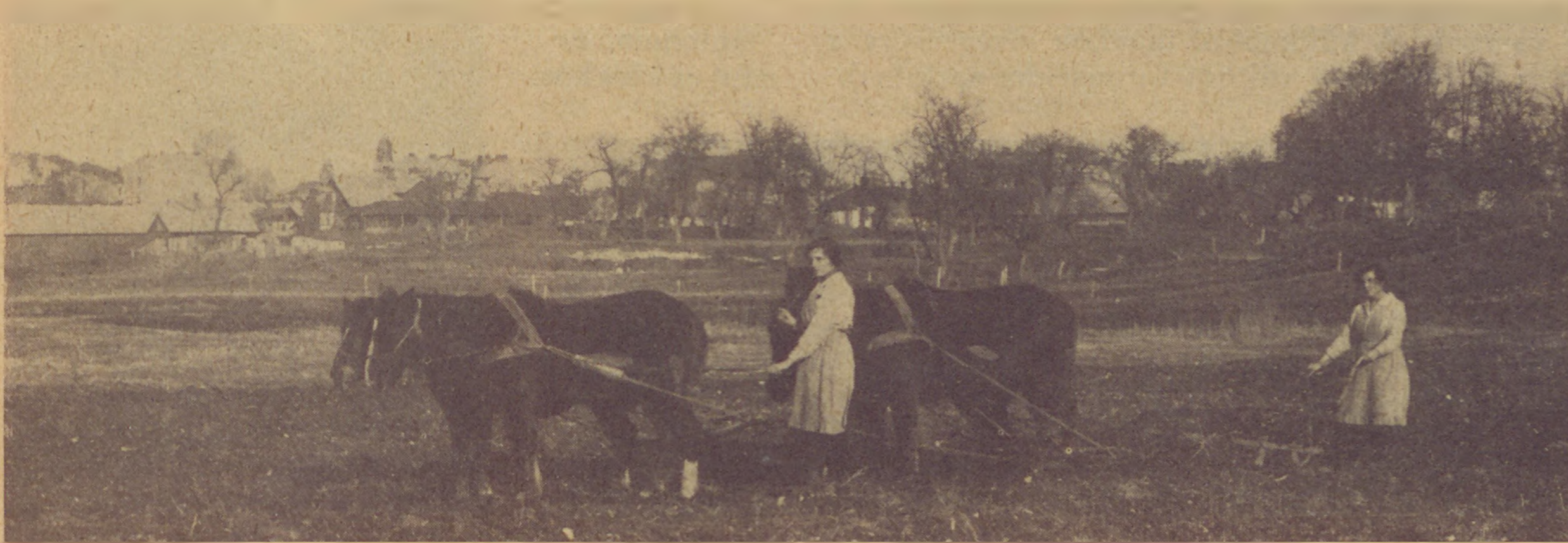
Jüdische Mädchenfarm in Stanislau.