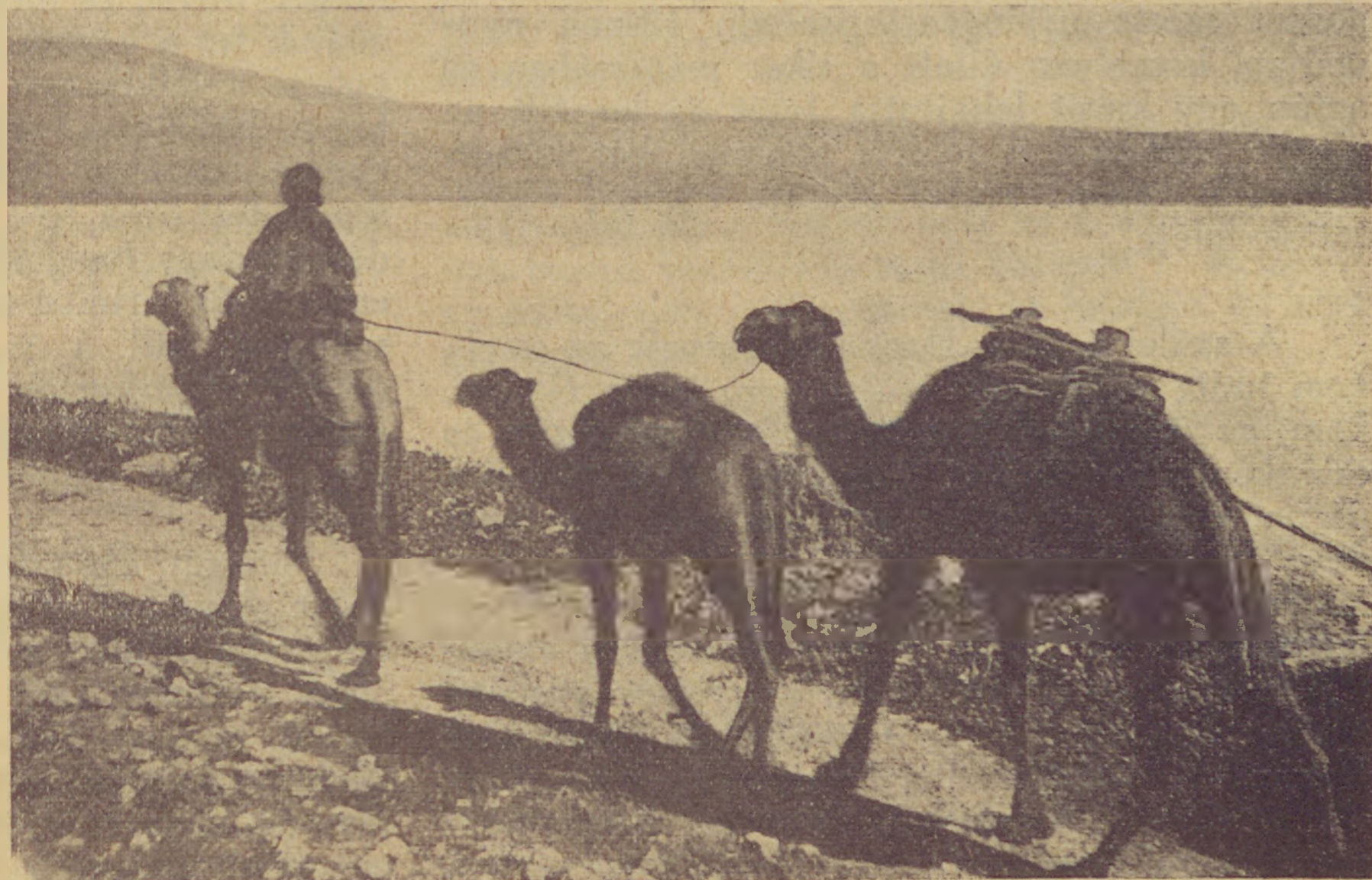
Karawane am Totten Meere.

Hanna tanult. Az évek gyorsan, gyorsan siklottak az élet vizén, és Hanna tanult és immár a Mester legkedvesebb tanítványa lett. Karcú teste még jobban megnyúlt a tanulás lázában, de a szemei sugárzó, lelkes fényben égtek. Szülei nehezen küzködtek, a rettenetes drágaság nyomasztó szörnye ráfeküdt az életükre, de ők nem gondoltak magukkal, csak Hannával, a cso-