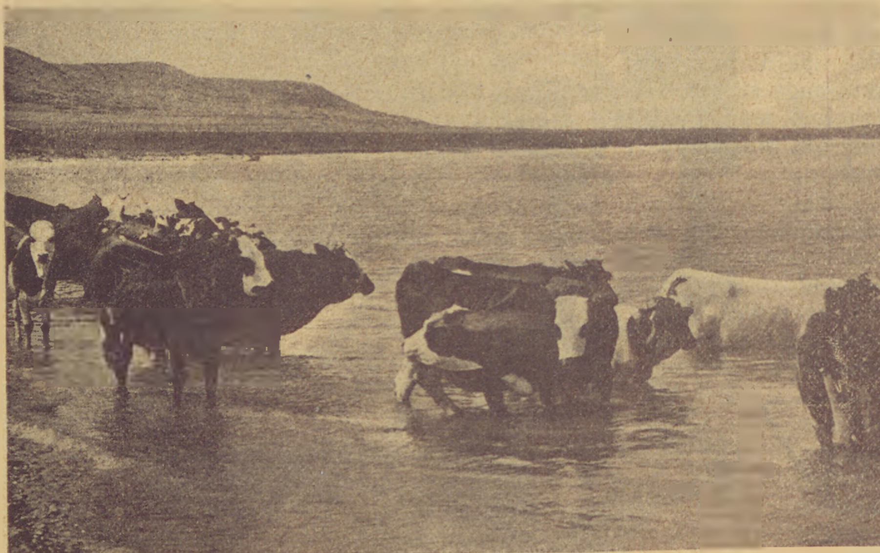
Meeresküste im heiligen Lande.

Vértüzes kebledre szent csöndben hullok, boldog szívem, fejem fénymámorban remeg: Üdv néked anyám, Napkirálynő. Valóság a lázas, szent jóslat — elég volt, már inthetnek az üres halálfejek.