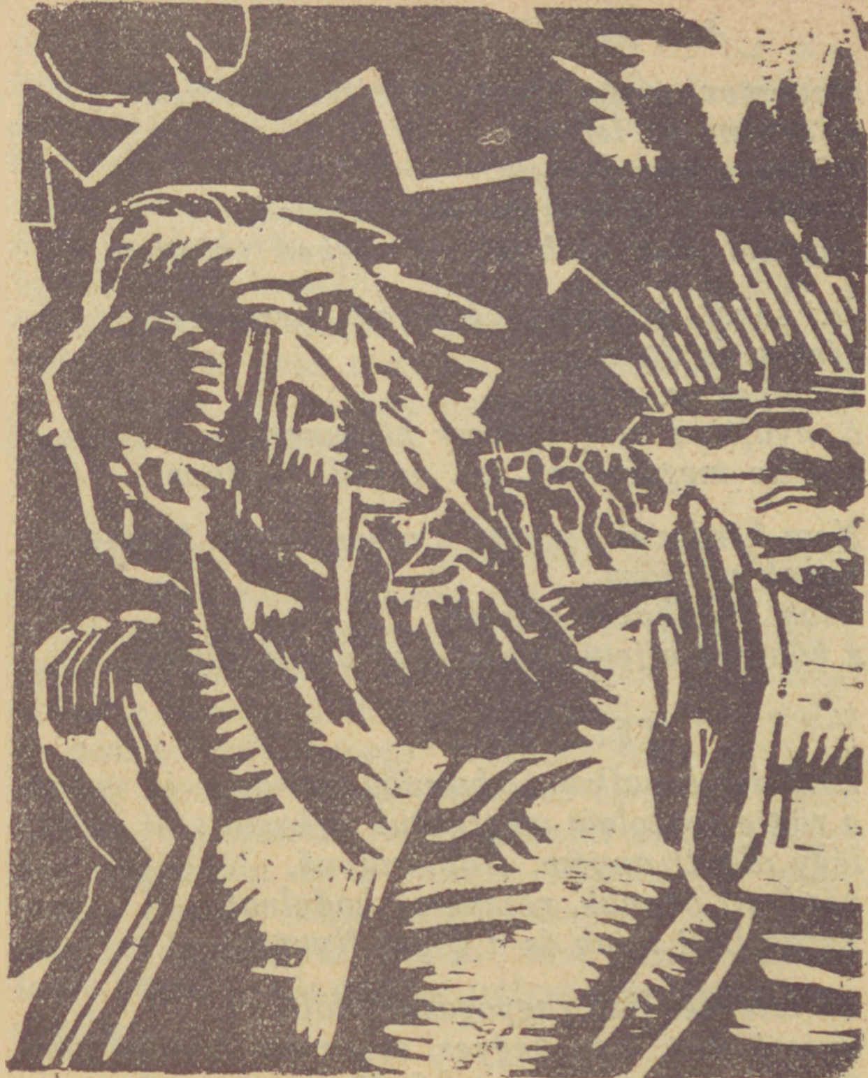
Vidor Pál: Jeremiás. (Fametszet.)