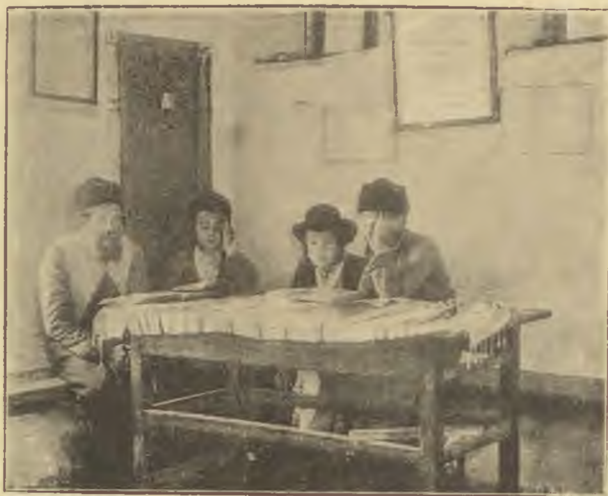
Talmudschule in Meron