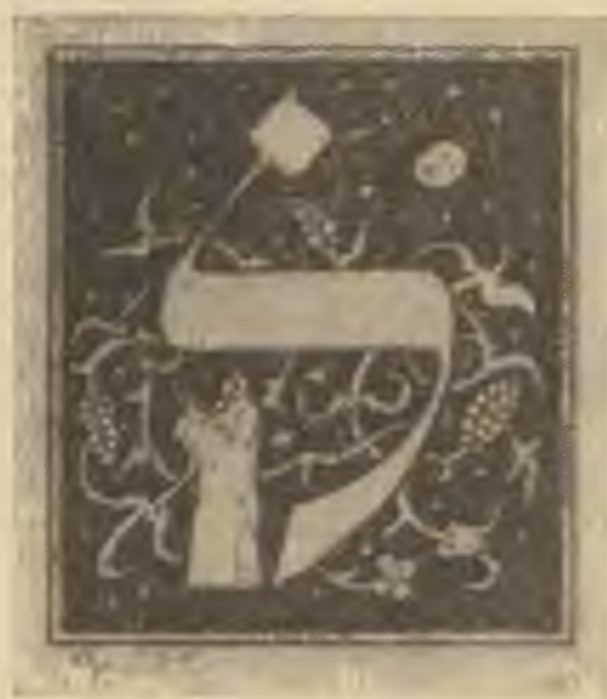
Josef Budko (Berlin) : Iniciálék a Hagadához Josef Budko (Berlin) : Zur Hagada

1 Adler József életéről és műveiről l. a „Magyarországi héber költők” című cikket. Ez a vers „Simus leson ivri” című szimbolikus művéből való, melyben a héber grammatikai szabályokhoz poétikus érzéseket és filozófiai gondolatokat kapcsol. Ez az önmagában oly szép vers pl. a neginothoz, a héber textus fölött levő hagyományos jelekhez kapcsolódik, amelyek a szavak összefüggését és a szöveg tradicionális dallamát jelzik. (P. J.)