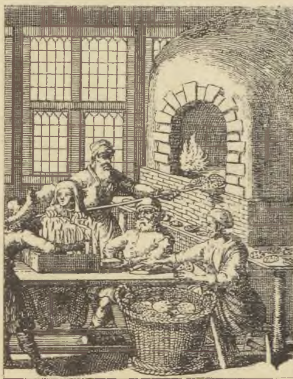
Vor Pesach Johanus Leusden Philologus Hebreo mixtus c. művéből. Utrecht 1657.