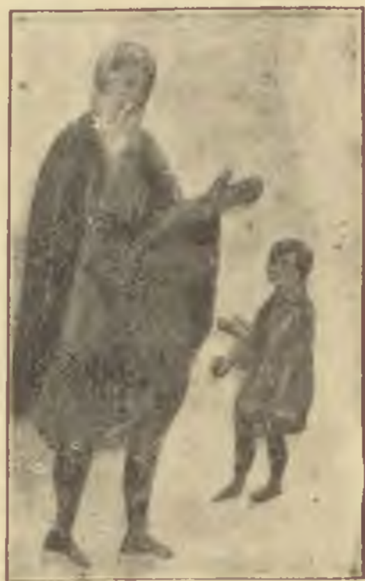
„Aki még nem tud kérdezni.“ (Egy 16. századbéli párisi Hagadából)