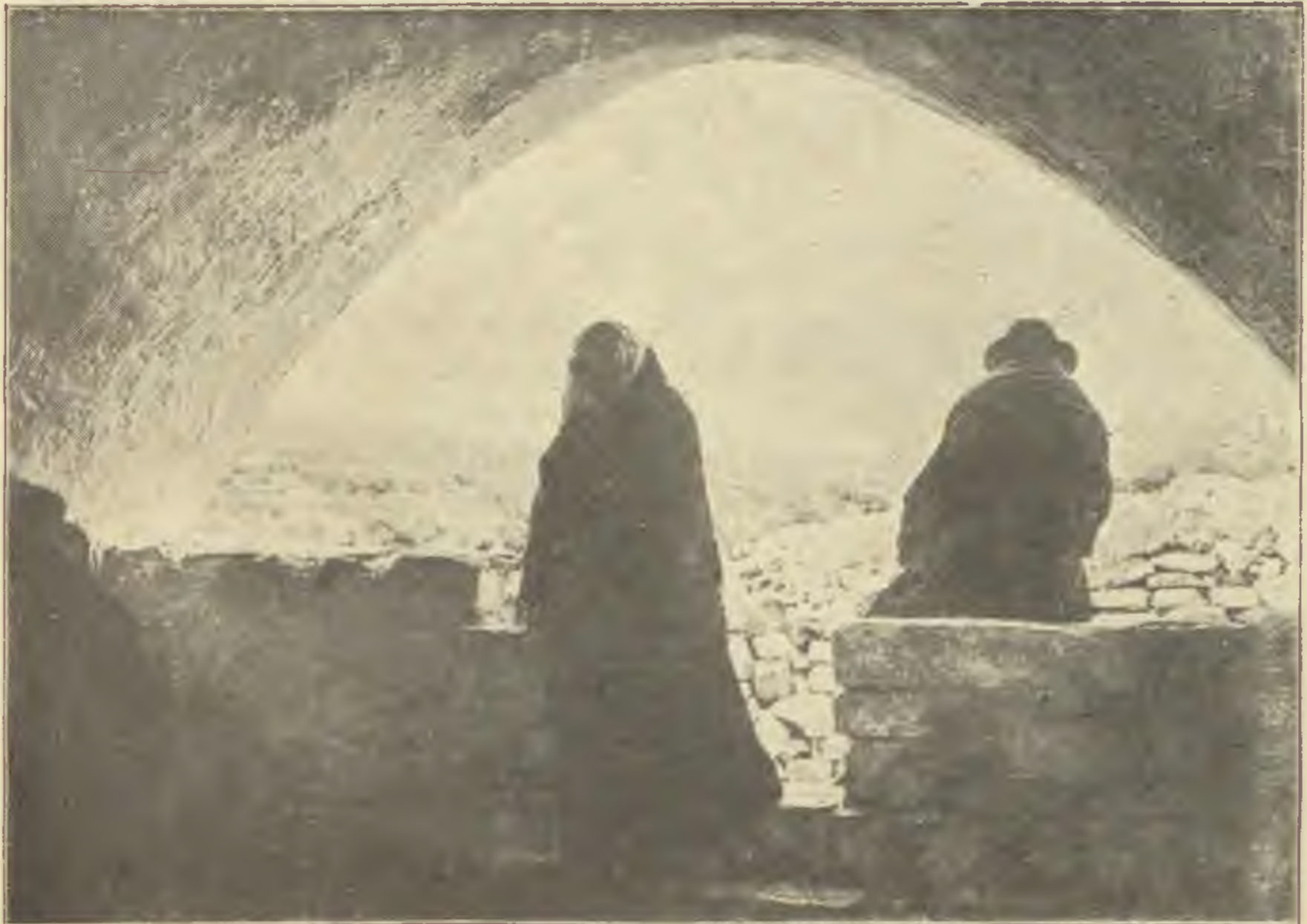
Der Eingang zu Rachels Grab

Versem, keresd fel titkosan, Gubbaszt egy fotel lágy ölen, Ott megtalálod biztosan, Az ajka szélén bús fölény. Mint macska, lustán ásítóz, A szeme foszforlángja kék, Semmit, semmit sem áhítóz, S nem szereti, ha lámpa ég... Hímes bókokra nem felel, Mint vattásfülű, agg, siket, Körötte mindent vágy lep el, Magában van, mint egy sziget. Füleld a szíve ajtaját Versem... csaljad ki víg szavát, S mint zöld moha sziklák falát, Fond körül ringó derekát, Selymes szavakkal szállj felé,