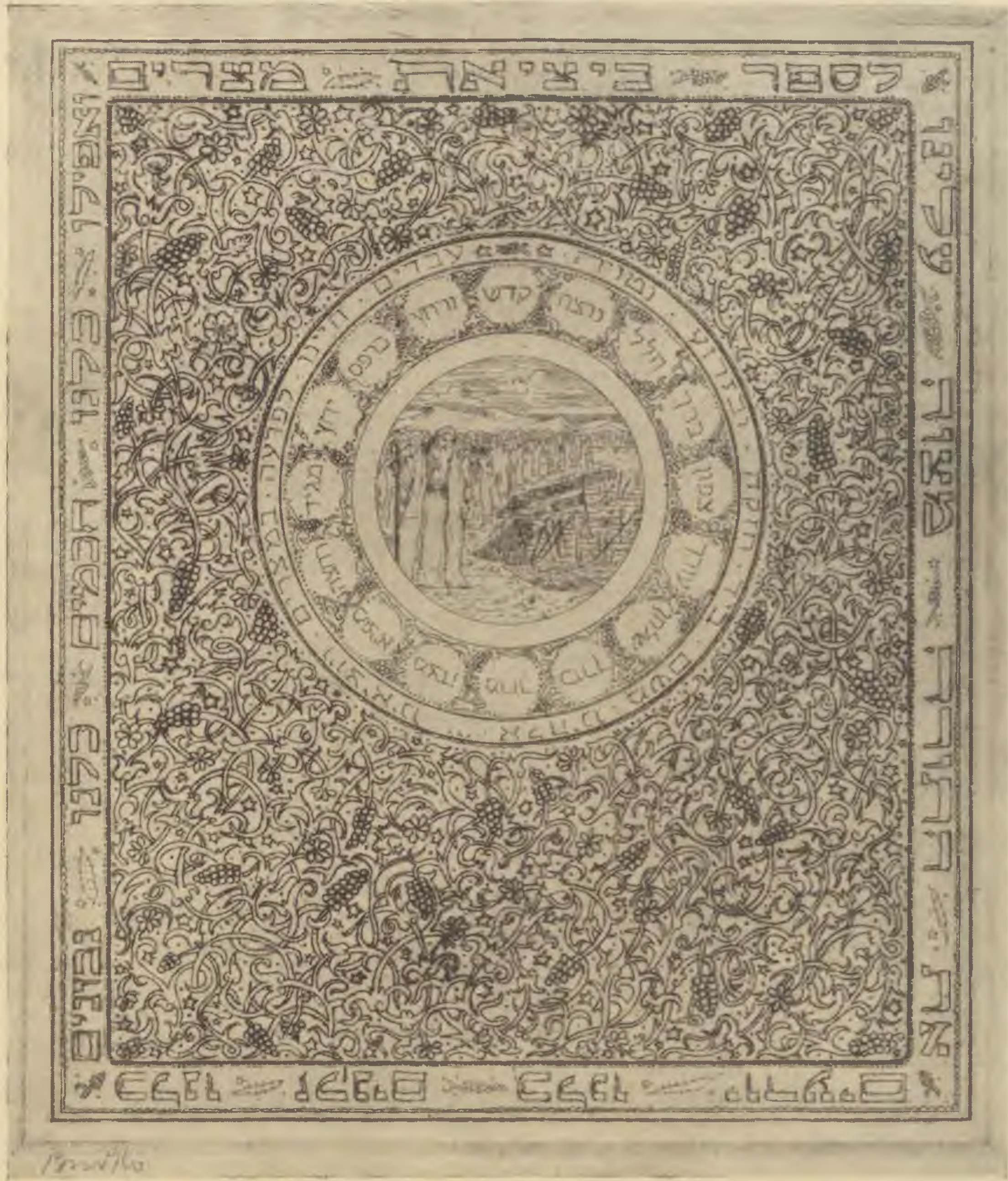
Josef Budko (Berlin) : Címlap egy új Hagadához. (Rézkarc) Josef Budko (Berlin) : Titelblatt zu einer neuen Hagada

jában Akiba állt, mutatják. Erről forró hazafiui lélekkel elbeszélgethettek egész éjszaka és anyyira belemelegedtek, hogy észre se vették, hogy kihajnalodott. A zsargon a legnagyobb tudós, még mai napig „egyiptomi kivonulás“-sal jelöli a bajok elbeszélését. Biztosra vehetjük ezek után, hogy a szabadság ünnepének estéjén a zsidók az ókorban a kor- és helyviszonyokhoz képest saját külön egyiptomi kivonulásukról beszélgettek, amit a Hagáda, mint közérdeket, joggal nyilvánít „dicséretes“-nek.