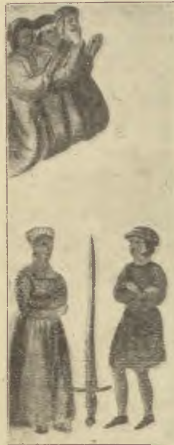
Egy 16. századbeli párisi Hagada illusztrációjából. „És látá a mi sa-nyarúságunkat, ez a férfi és nő elválásztása”