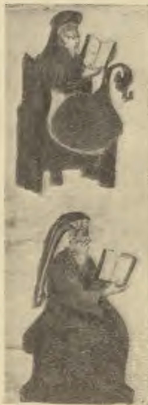
Egy 16. századbeli párisi Hagadából. Bené-Berák bölcsői Die Weisen von Bené-Berák. (Hagada-Handschrift, 16. Jh.)