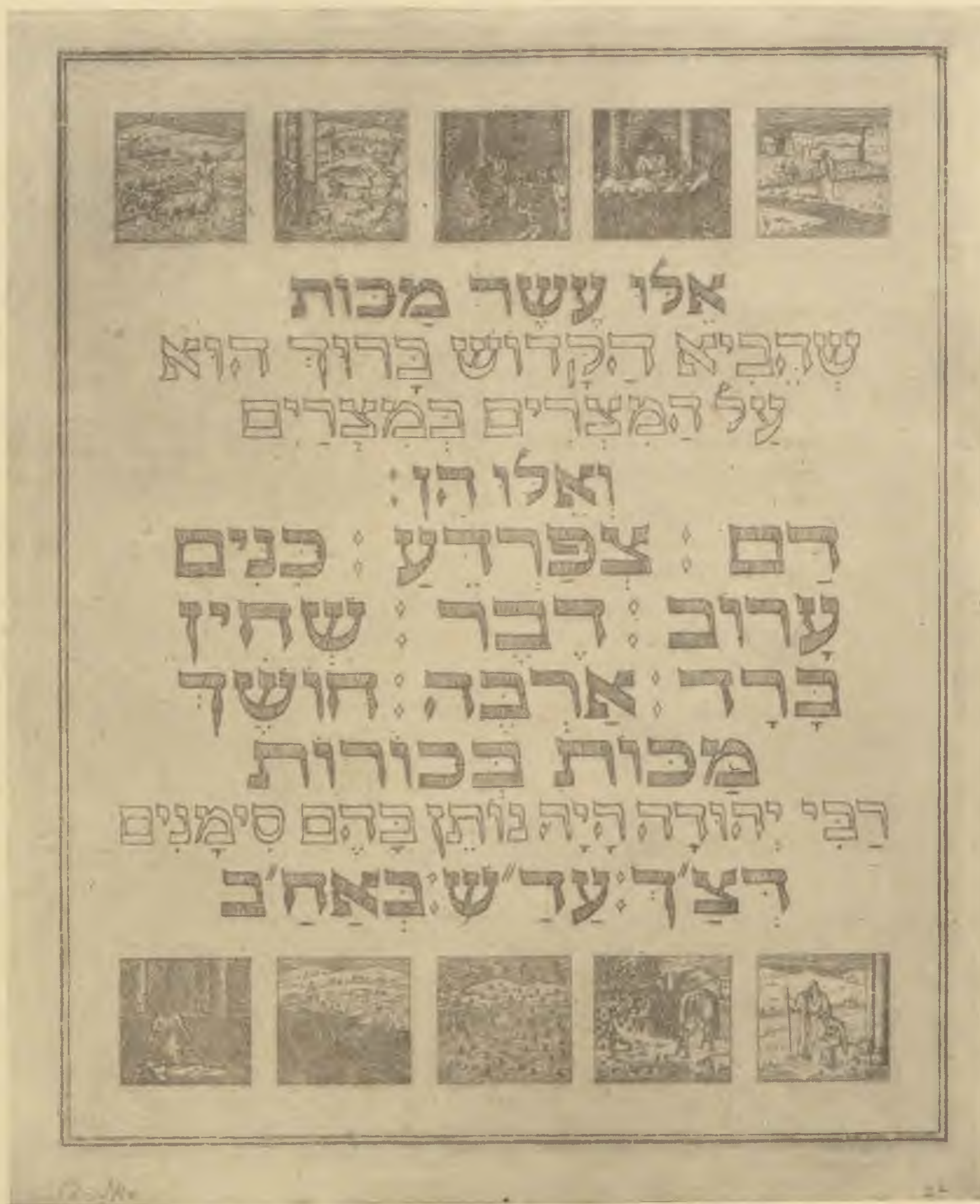
Josef Budko (Berlin): Egy lap az új Hagádából. Az egyiptomi tíz csapás ábrázolásával. Vér, békák, rovarok, vadállatok, pestis, kiütés, jégeső, sáska, sötétség, az elsőszülöttek halála. (Rézkarca) Josef Budko (Berlin): Die zehn Plagen

„Ebből következik, hogy az egyiptomiak Egyiptomban ötven csapást szenvedtek, a tengernél pedig kétszázötvenet.” Máshol azt mondják az