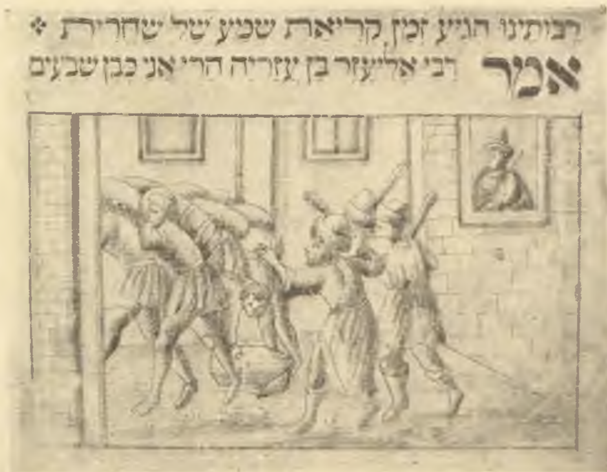
Az egyiptomi rabszolgaság