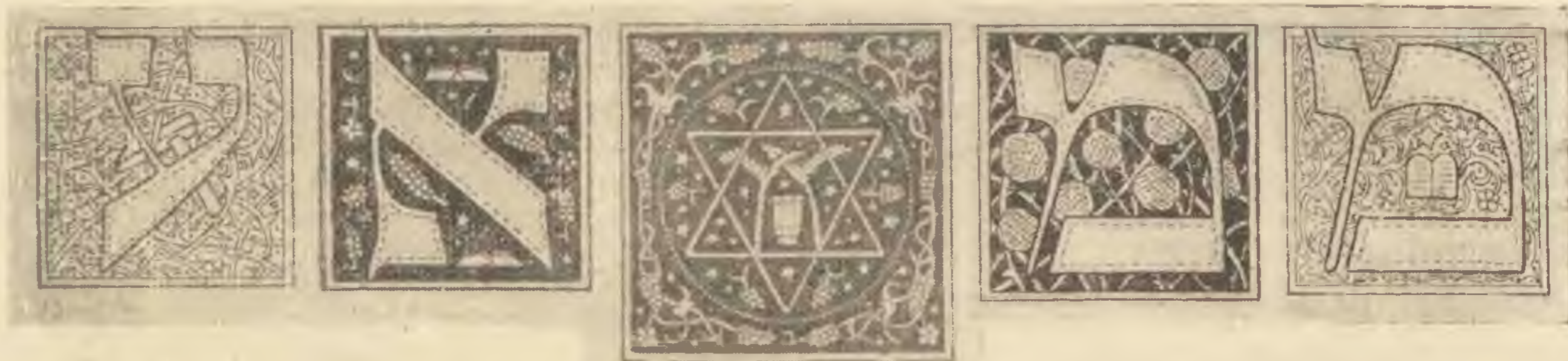
Josef Budko (Berlin) : Initialen zur Hagada