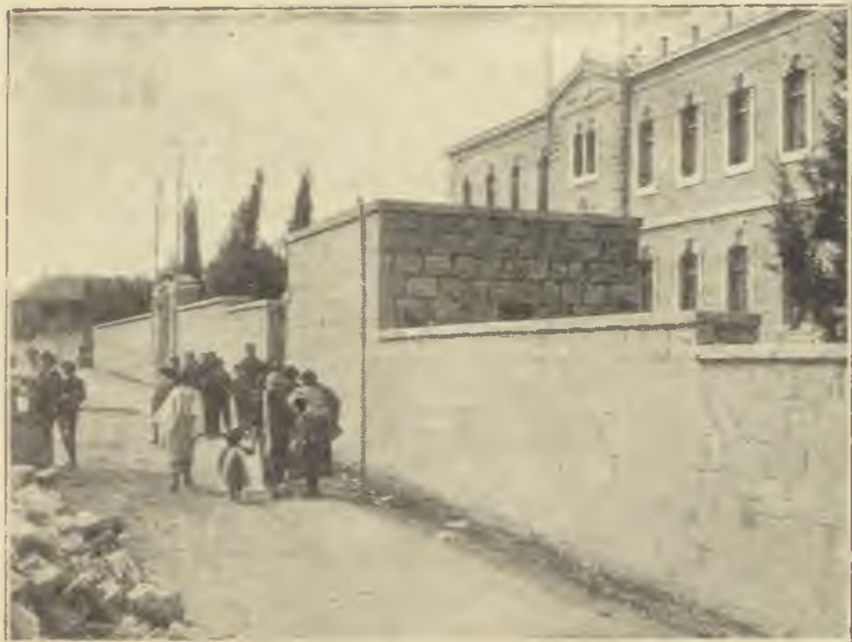
Die Lämel-Schule in Jerusalem

Az esős időszak egyik gyönyörű szép szombat délelőttjén kedvem támadt, hogy meglátogassam az olajfák hegye tövében, Sziloán arab faluval szemben levő szánalomra méltó yemenita negyed szegényes imaházát. Tíz óra felé lehetett, mikor odaérkeztem. Imának már nyoma sem volt, mert a yemeniták mint minden nap, úgy szombaton is már az első hajnali órában végzik az imát. A körülbelül 3000 lelket számláló hitközség férfi-tagjai már az elképzelhetően szűk szombati étkezést bevégezvén, ismét az imaházban voltak összegyűlve, hogy együttesen tanuljanak. Az elég tágas, teljesen dísztelen, jóformán üres szobában ültek kör alakban a padlóra kiterített olcsó pokrócokon, lábaikat ke-