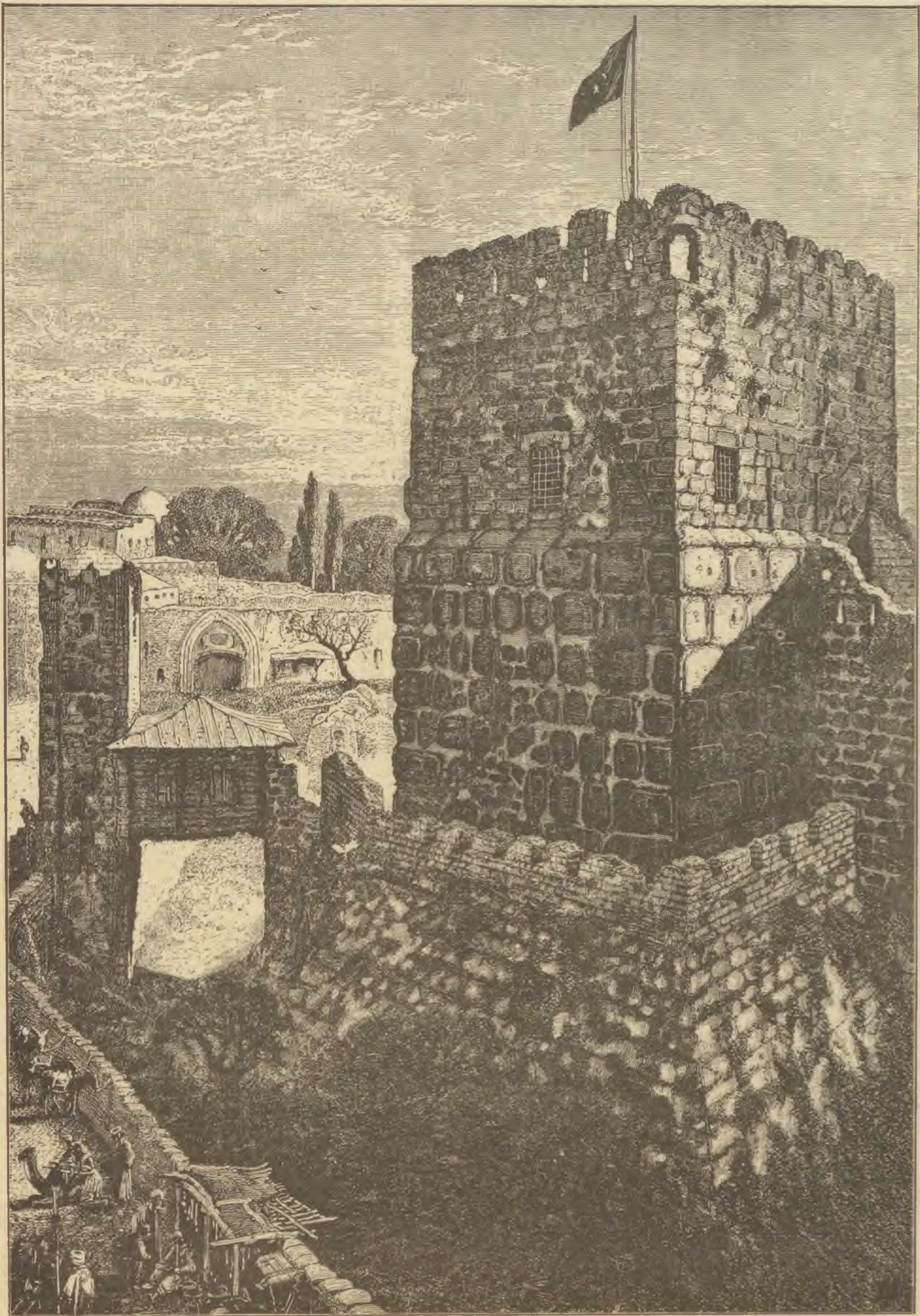
I. D. WOODROW : DER DAVIDSTURM IN JERUSALEM