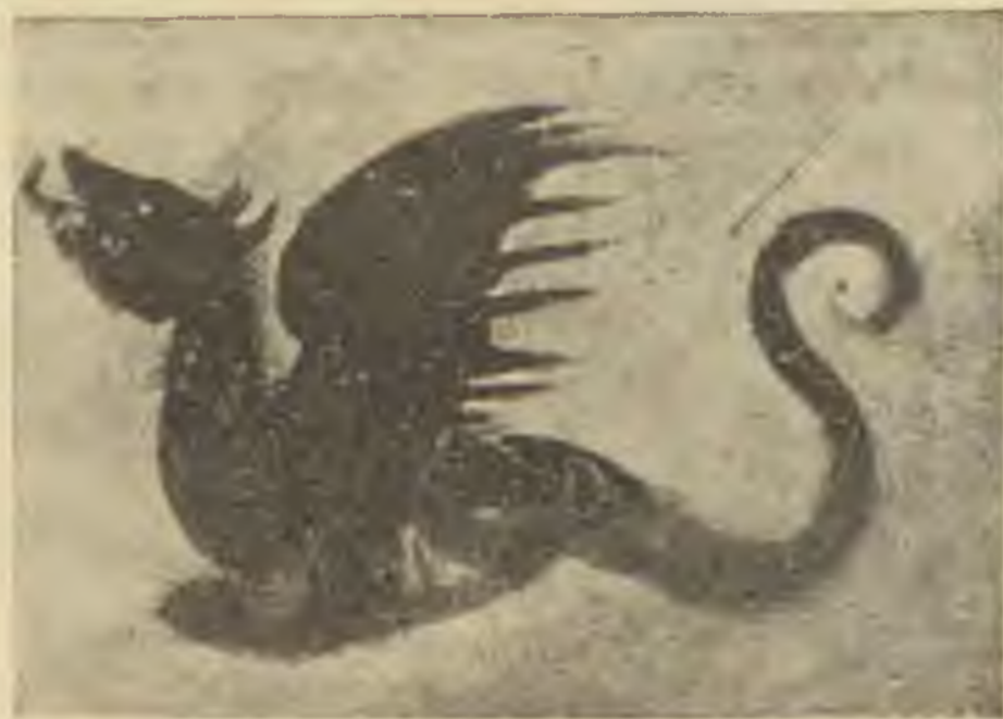
Egy 16. századbeli párisi Hagáda illusztrációból Aus einer Pariser Hagada-Handschrift, 16. Jahrhundert

Versem, keresd fel titkosan, Hintáld felém a vágy ölen, Oh! megtalálod biztosan, Gubbaszt egy fotel lágy ölen.