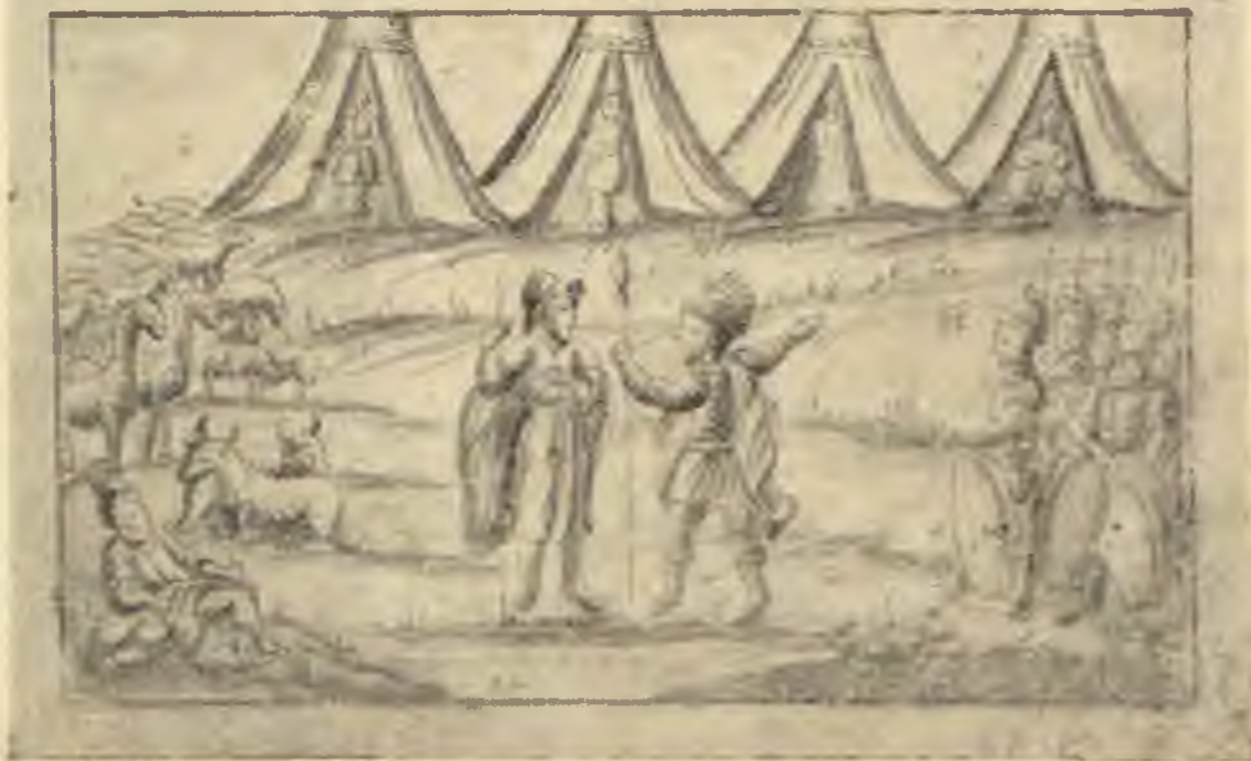
Egy régi pozsonyi Hagádából. Jákob és Lábán találkozása Aus einer alten Pozsonyer Hagada (Deutsch Jenő tulajdona)

ולמד מה בקש לבן הארמן לעשות ליעקב אבינו שפרעה לא גזר אלה על הזכרים