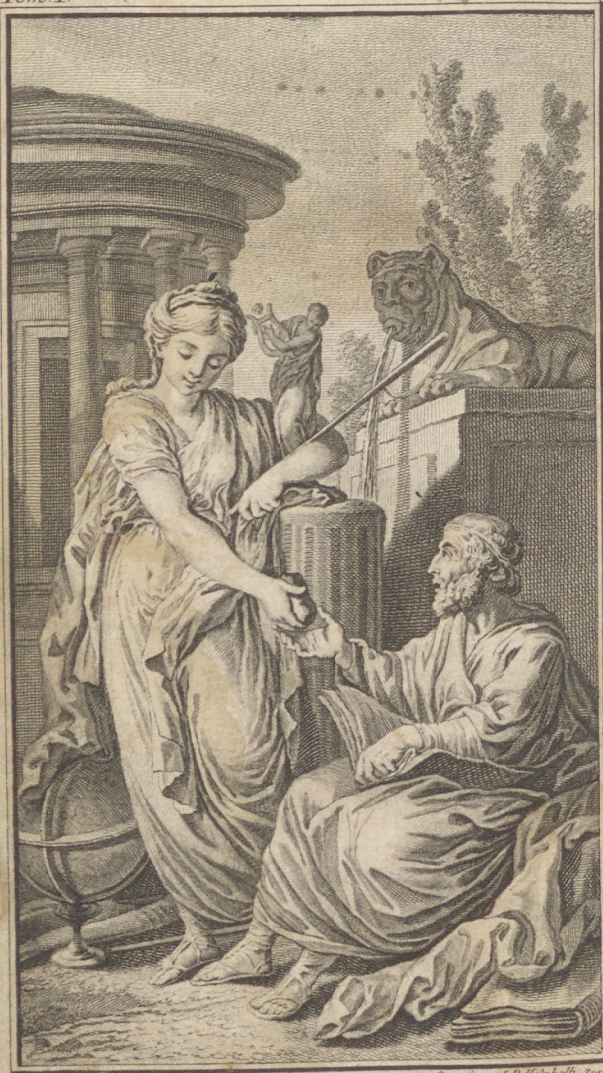
Gravé par J.R. Hirschalt, 1799

Országos Rabbiképző - Zsidó Egyetem Könyvtára