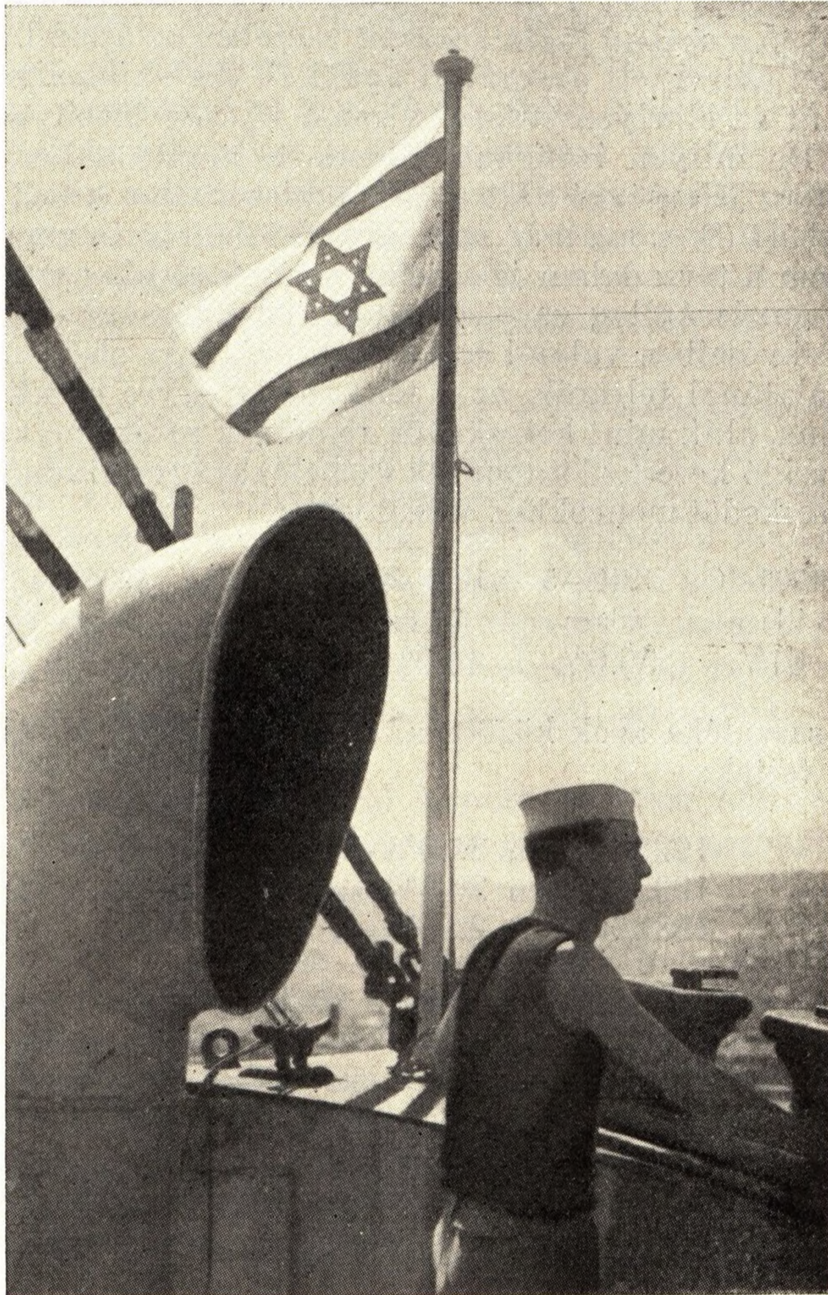
Zsidó hajó a tengeren

Vajjon milyen hatással van a magyar zsidóság egyre nyomasztóbb anyagi helyzete a zsidó ifjúság pályaválasztására? Normális időkben a fiatalság legtöbbször átveszi a szülők gazdasági pozícióit, a fiú átveszi az apa üzletét, orvosi rendelőjét,