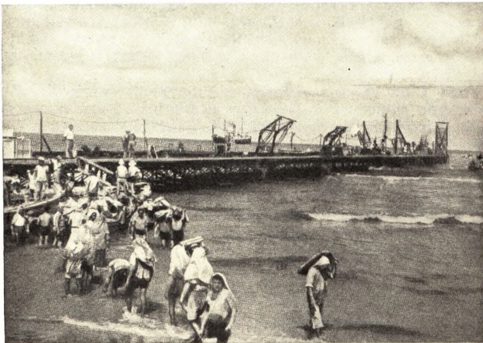
Zsidó munkások a tel-avivi kikötőben

Zsidó-arab kérdés arab megvilágításban. Emir Fejssál 1919-ben, Prof. Frankfurter -hez intézett levelében még világosan annak a meggyőződésének ad kifejezést, hogy az arabok együtt akarnak működni a zsidókkal az újjáalakított és újjászületett Keletért és hogy a két népi mozgalomnak szüksége van egymásra. „Hiszem, hogy sikerünk érdekében kölcsönösen szükségünk van egymásra.“ Az ilyen szavak súlyukat ép azáltal nyerték, hogy az arab nemzeti mozgalomnak olyan vezéralakja hangoztatta azokat, mint Emir Fejssál . De az arabság politikai és gazdasági problémái más utat szabtak a történelem következő fordulatainak. Európa különböző centrumaiban felnevelődött arab intelligencia magába szívta Európa nacionalista eszméit és úgy gondolta, hogy ennek segítségével szabaddabb fejlődés lehetőségét teremtheti meg és ugyanakkor saját