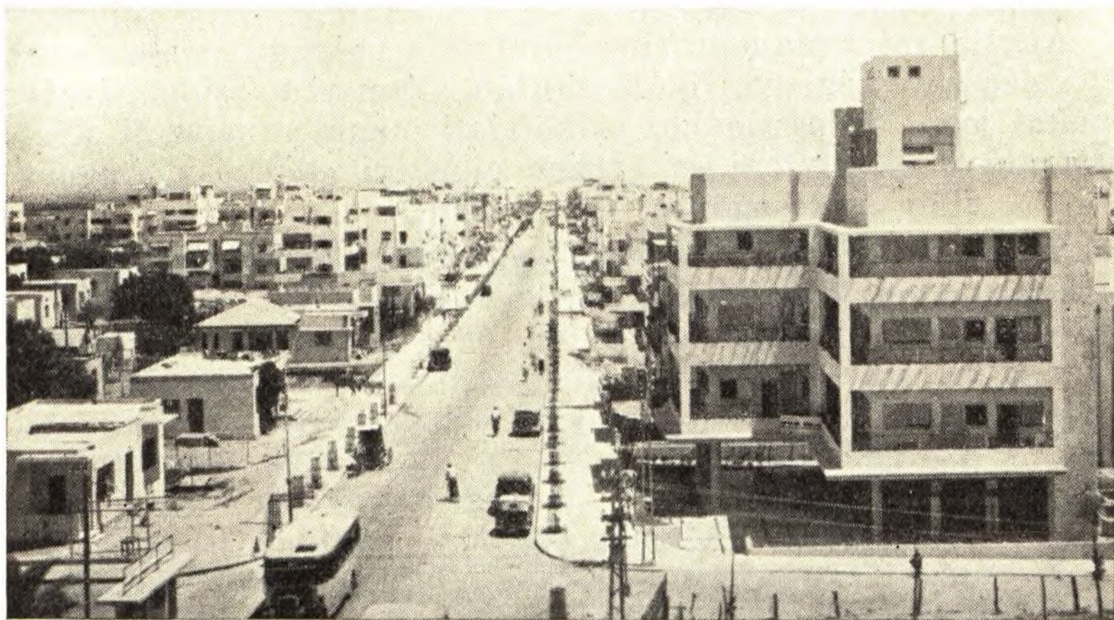
Tel-Aviv, Ben Jehuda utja

Romániában. Maguk a hitközségek vették kezükbe a Bizaron akció lebonyolítását. Minden város kontingenst vállalt magára.