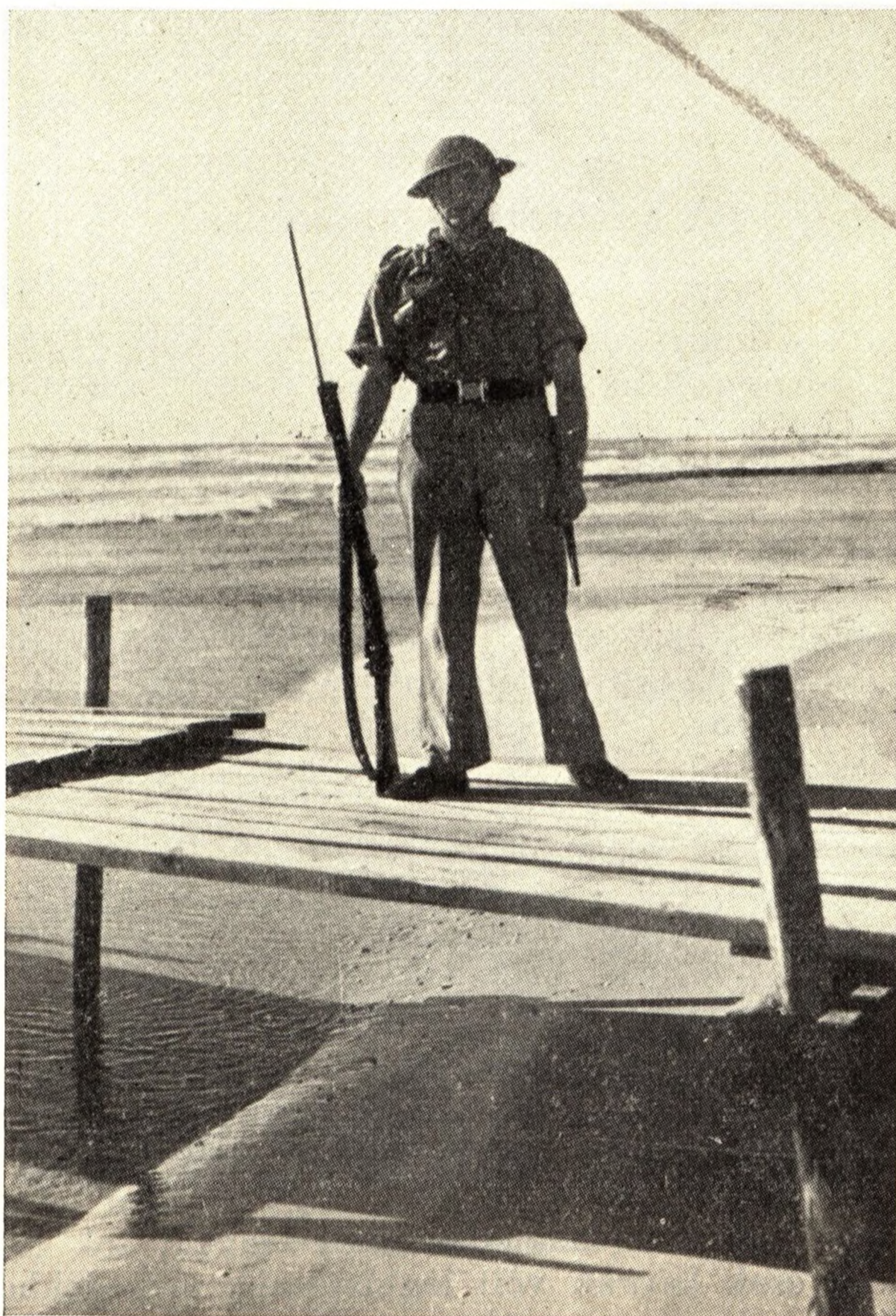
Zsidó katona őrzi az épülő tel-avivi kikötőt

lehetősége (bár e tekintetben a hangulat már is igen bizakodó) rónak még súlyos napokat a zsidóságra. Bár az optimizmus indokolt, ha a zavargások alatt elért eredményeket tekintjük, így a tel-avivi kikötő építését, amelyre a jisuv néhány nap alatt 150.000 fontot hozott össze, a Haifa és Tel-Aviv között az arab falvak megkerülésével épített országútat, a zsidók egyre fokozódó térhódítását a mezőgazdaságban és az iparban, végül, de nem utolsó sorban, a 4000 főből álló zsidó segédrendőrség megszervezését — mégis óvatos előrelátással kell mérlegelnünk a jövő eshetőségeit.