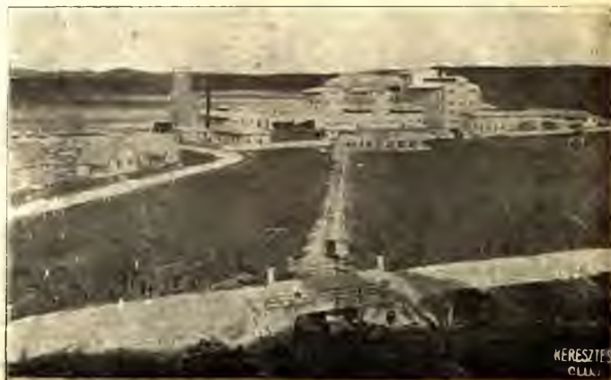
A HAIFAI NESHER CEMENTGYÁR