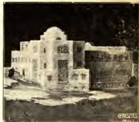
A JERUZSÁLEMI ZSIDÓ NEMZETI ÉS EGYETEMI KÖNYVTÁR