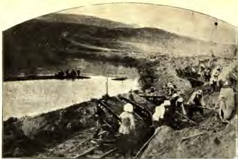
RUTHENBERG MUNKÁLATOK A JORDÁN FORRASÁNÁL.