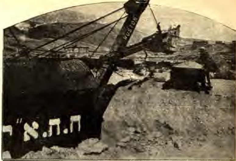
KOTRÓGÉP A JORDÁNON