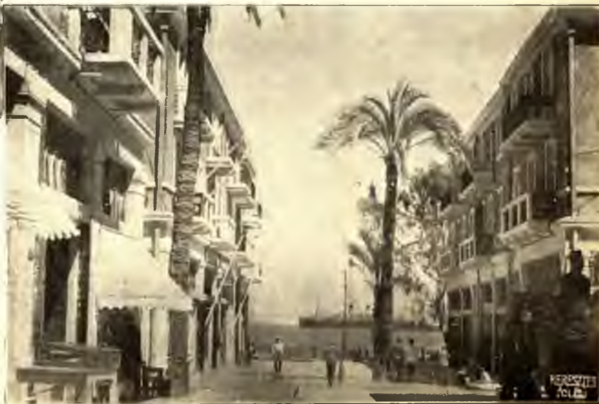
HAIFA ÚJ KERESKEDELMI KÖZPONTJA