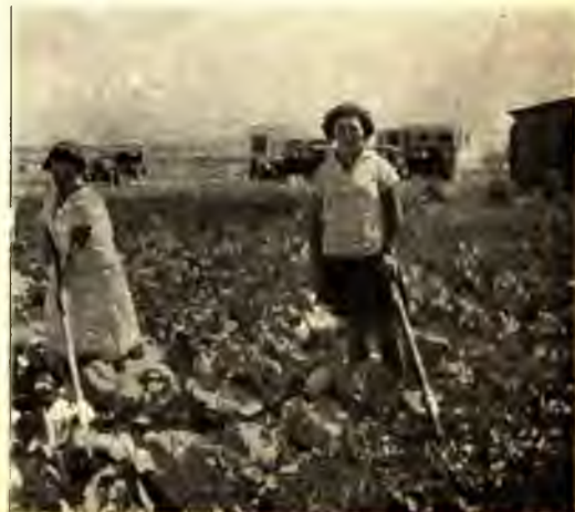
MUNKÁSOK A DJEBATTAI KISÉRLETI TELEPEN