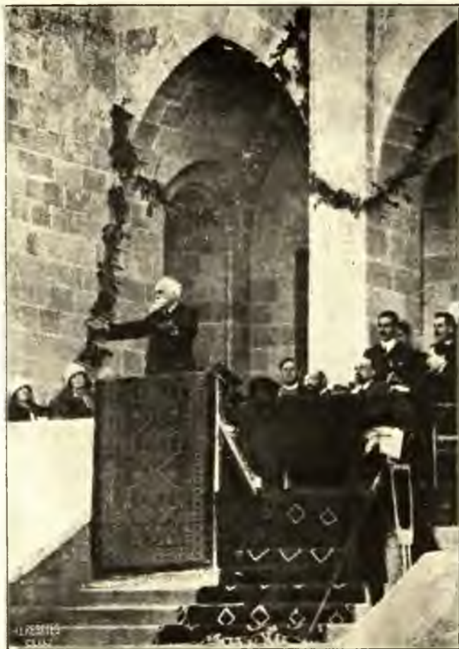
LORD BALFOUR BESZÉL A JERUZSÁLEMI HÉBER EGYETEMEN