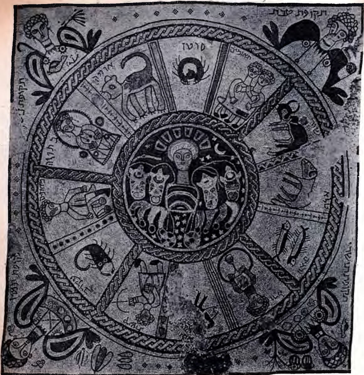
MOSAIKFUSSBODEN aus dem zweiten Jahrhundert in einer alten Synagoge in Beth Alpha.