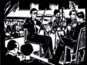
KULTURARBEIT - KUNST