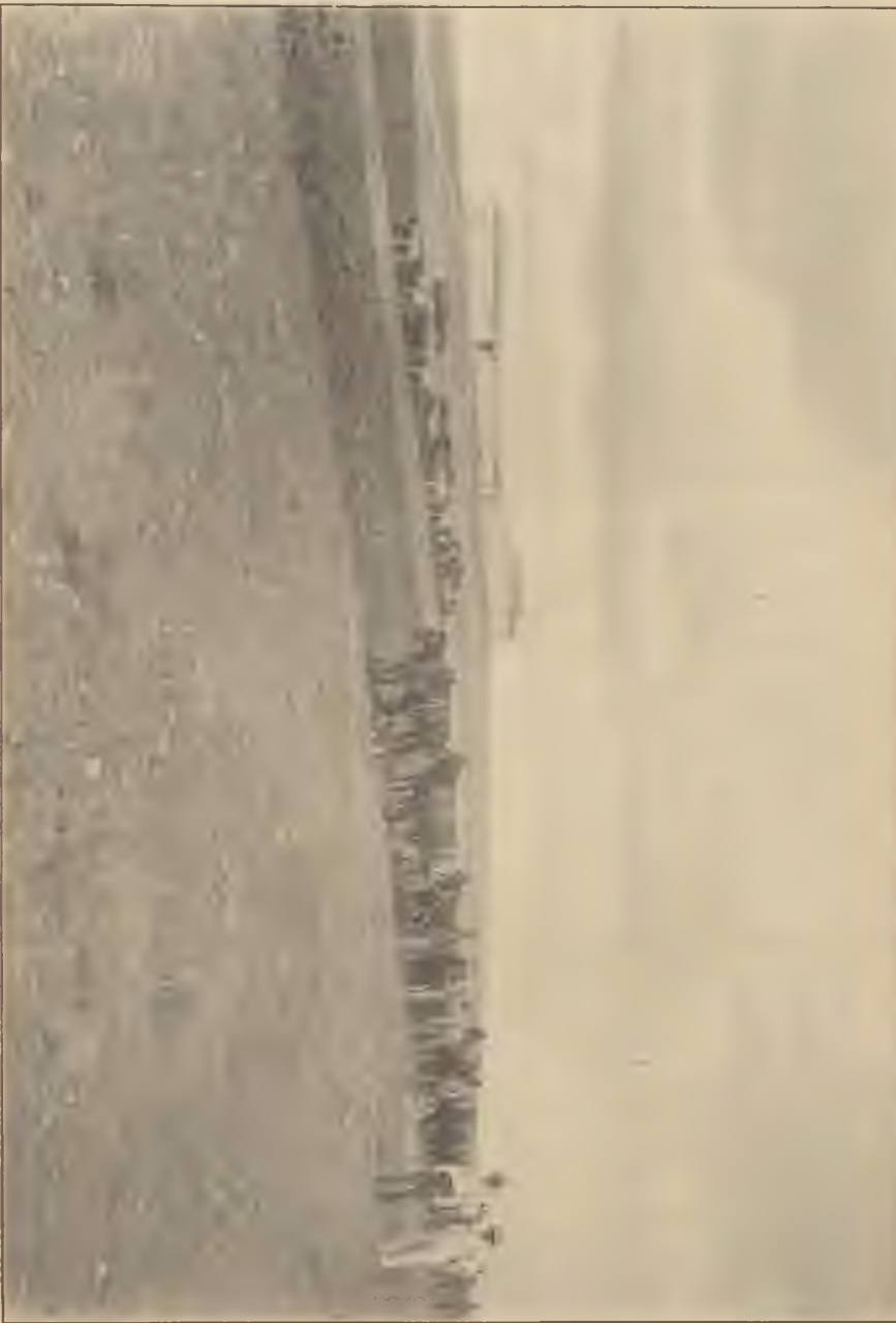
Előmunkálatok a Zsidó Nemzeti Alap egyik birtokán, Beth-Arifban (Palesztina), az olajfák ültetésére.