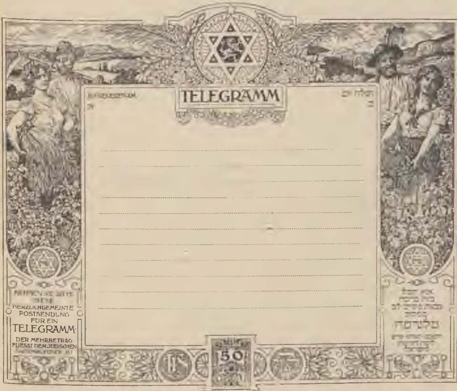
Sürgöny megváltásra szolgáló táviratblanketta.

Zsidó nemzeti muzeum. Schatz tanár indítványára megvetették két év előtt a zsidó nemzeti muzeum alapját Jeruzsalembe. A muzeumnak már három osztálya van: művészeti, régiségtani és természetrajzi. A muzeum Zs. N. A. épületében van elhelyezve.