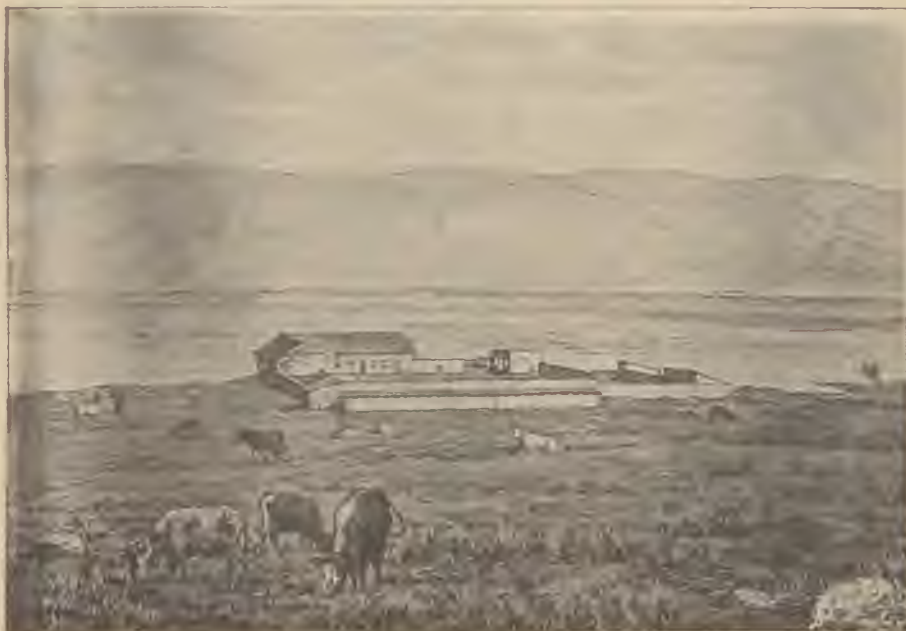
Tanya a Kinnereth-en, a Tiberiasz-tó völgyében, Zsidó Nemzeti Alap birtokon.

a munkaképes, erős, fiatal bevándorlók száma, akiket az a vágy hoz vissza apáik földjére, hogy kivegyék részüket országuk és népük újjáébredésének munkájából. Munkájuk nyomán minden vonalon virágzó gazdaság és zsidó kultúra fejlődik. A népnyelv a héber s a tanítás szintén héberül folyik a legtöbb iskolában. Az ország kereskedelme rohamosan emelkedik. 1905-ben 40%-al nőtt. Palesztina ezen általános föllendülésének főelőmozdítója a Zsidó-Palesztinabank (Anglo Palestine Company), a londoni Zsidó Gyarmatosító bank (Jewish Colonial Trust) leányintézete, amelynek