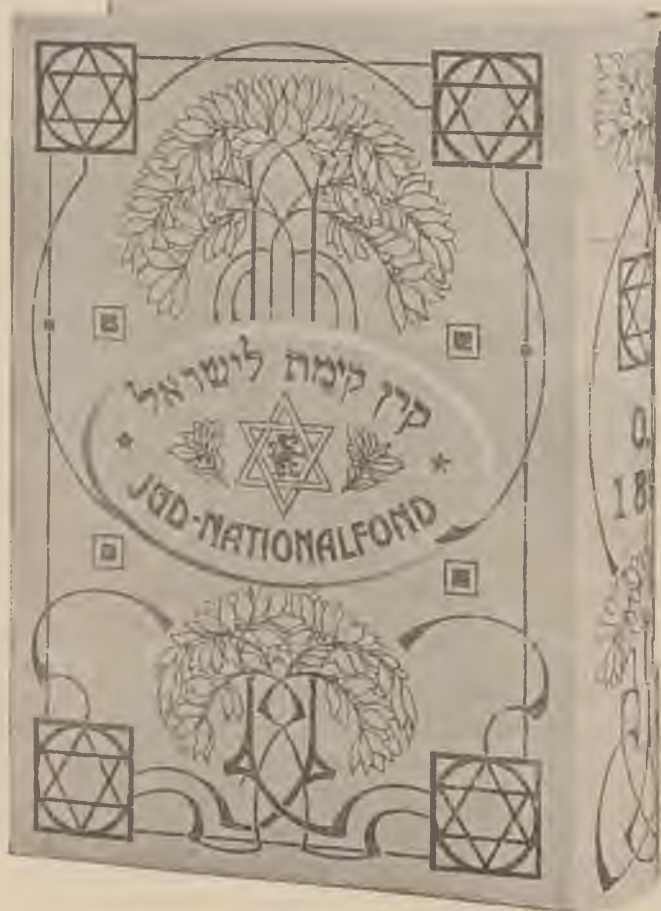
A persely-feliratok szövege héber és magyar.

got rendez be, amelyekben zsidó földmiveseket nevel önálló gazdálkodókká. A P. L. D. C. alaptőkéje 50.000 font sterling. A Zs. s N. A. 120.000 K értékű részvényt vett át. 1908. tavaszán a P. L. D. C. 99 évre bérbe vette a Zs. N. A.-tól ennek a Tiberiász tó völgyében fekvő egyik birtokát, Kinnereth-et, amely 5500 dunam