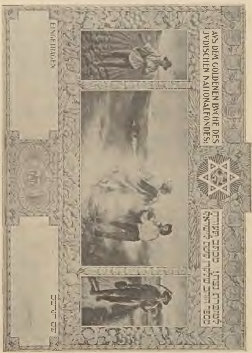
Az aranykönyvi bevezetés diplomája kicsinyítve.