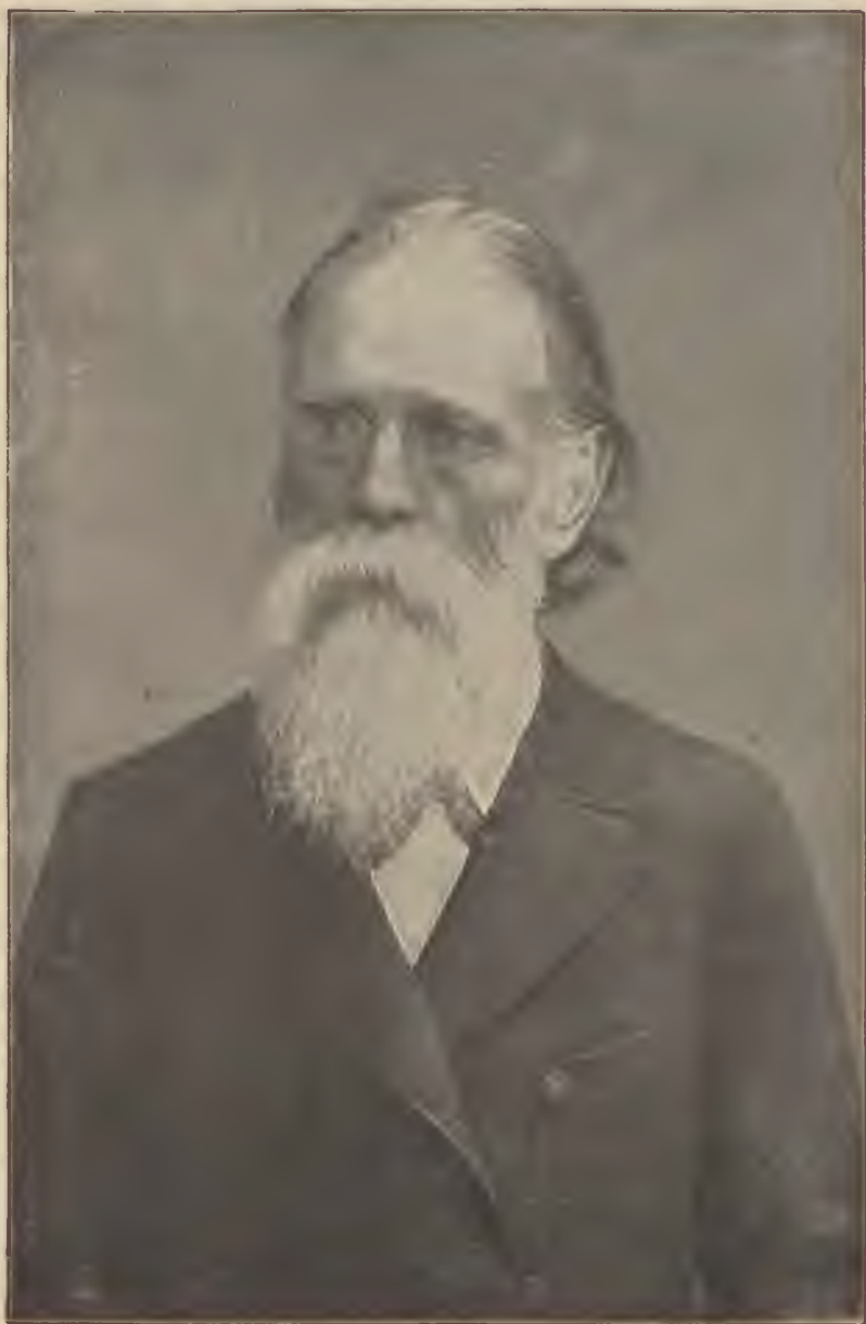
Néhai Dr. SCHAPIRA HERMANN, heidelb. egyet. tanár akitől a „Zsidó Nemzeti Alap“ létesítésének eszméje származik.