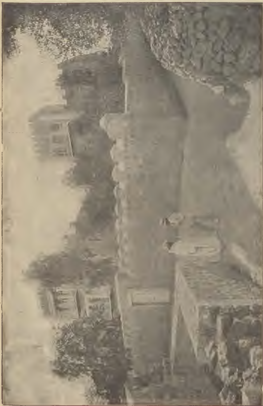
A Zsidó Nemzeti Alap Bezalel-házai Jeruzsálemben.