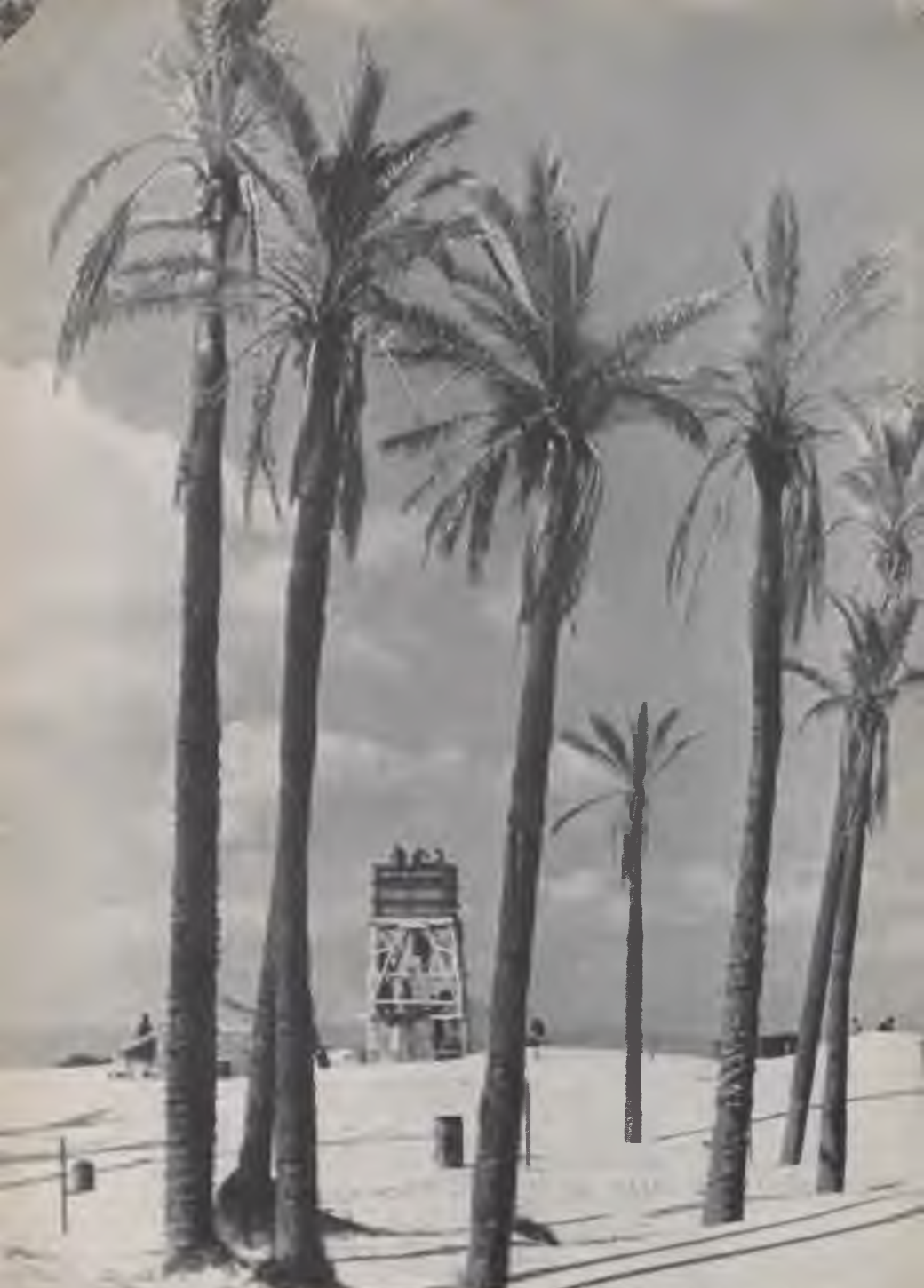
Országos Rabniképző - Zsidó Egyetem Könyvtára