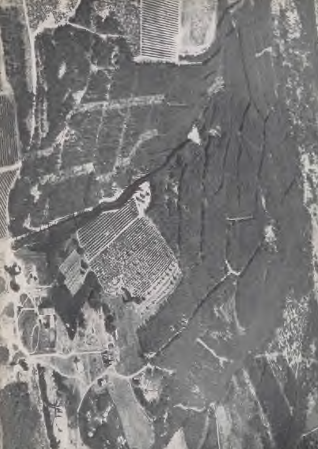
Uzazago, Kanton de Gales, sito de un gran edificio.