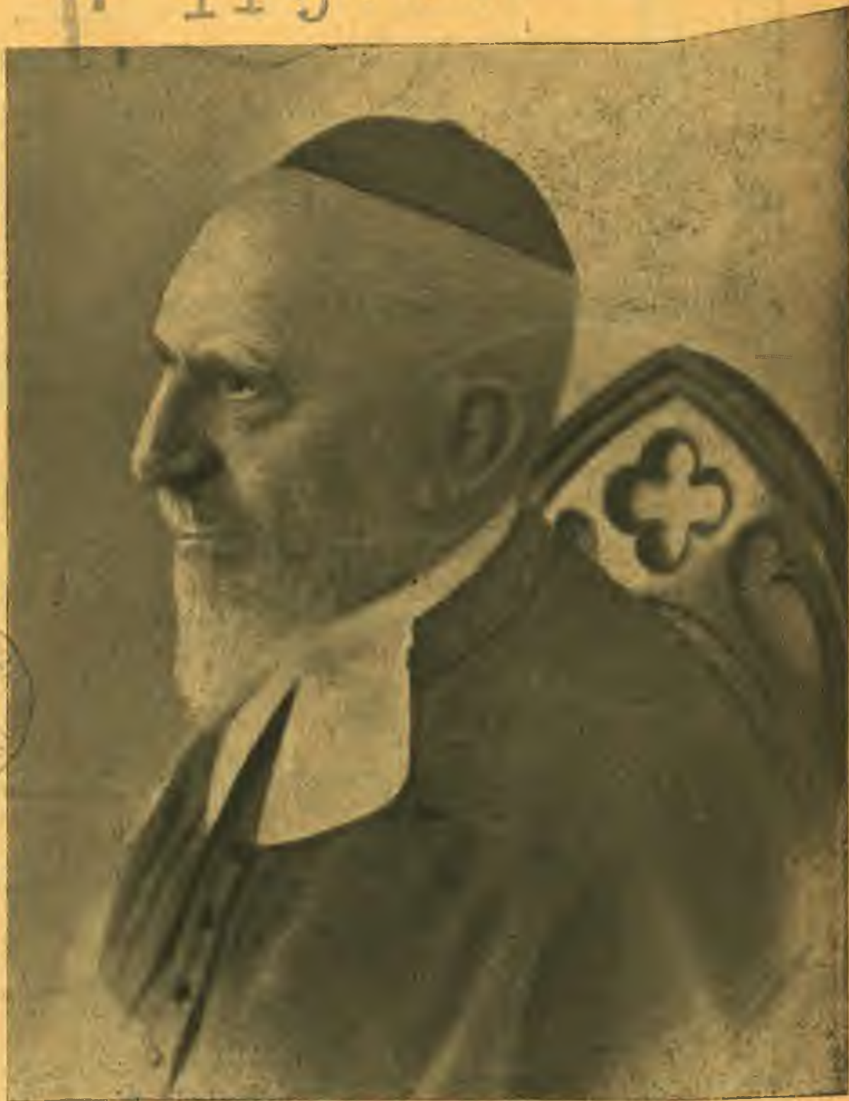
Rabbi LÖW IMMÁNUEL a magyar kongresszusi és status-quo izsidóság felsőházi képviselője