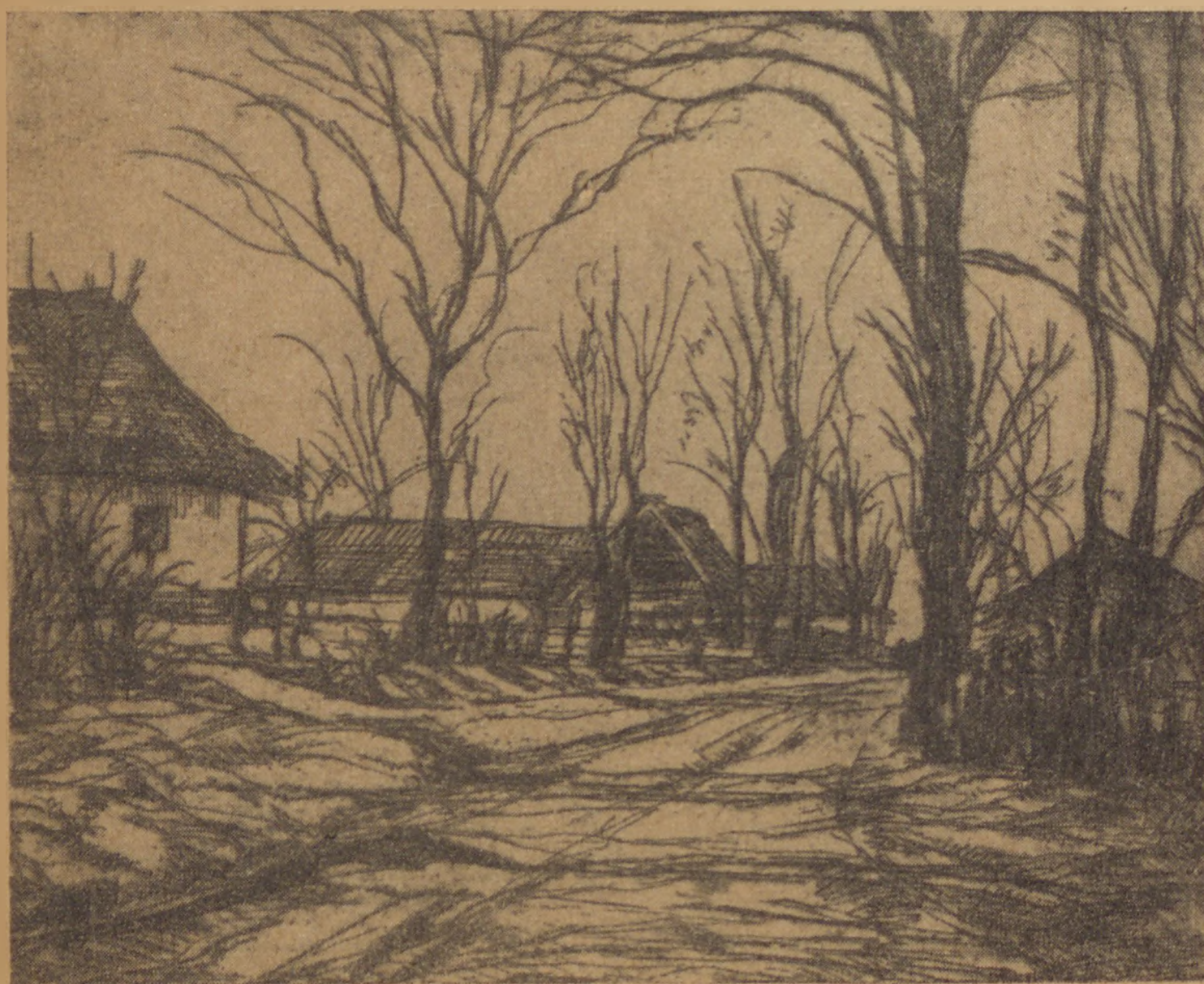
Alpár Sándor: Falu végén . . .