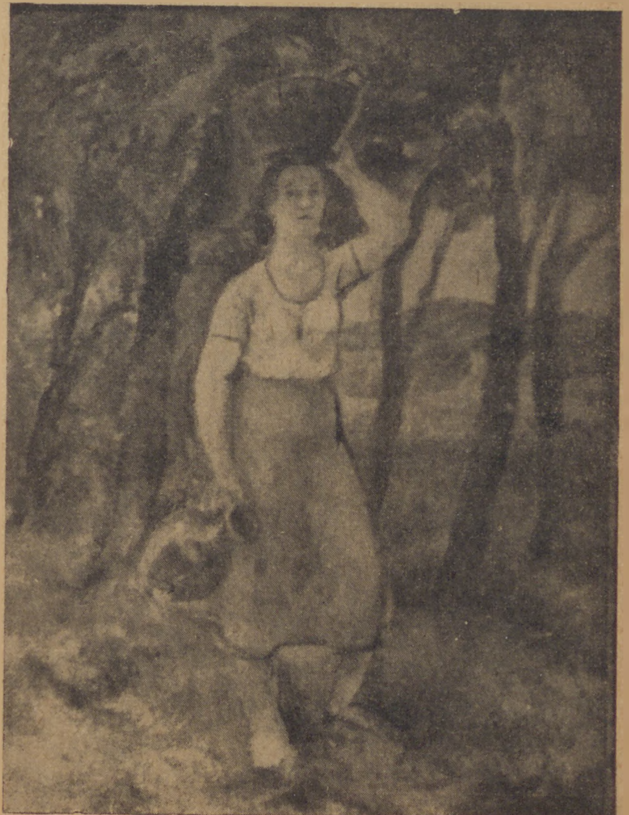
Alpár Sándor: Leány korsóval

Botorkálva haladt előre. Az áprilisi szeszélyes időjárás e pillanatban fekete felhőket nyitott meg az égen és mint kirepedt tömlőből, vastag zuhatagban hullott alá a szűrős, hideg koratavaszi eső. Sárban, bokáig érő tocsogókban