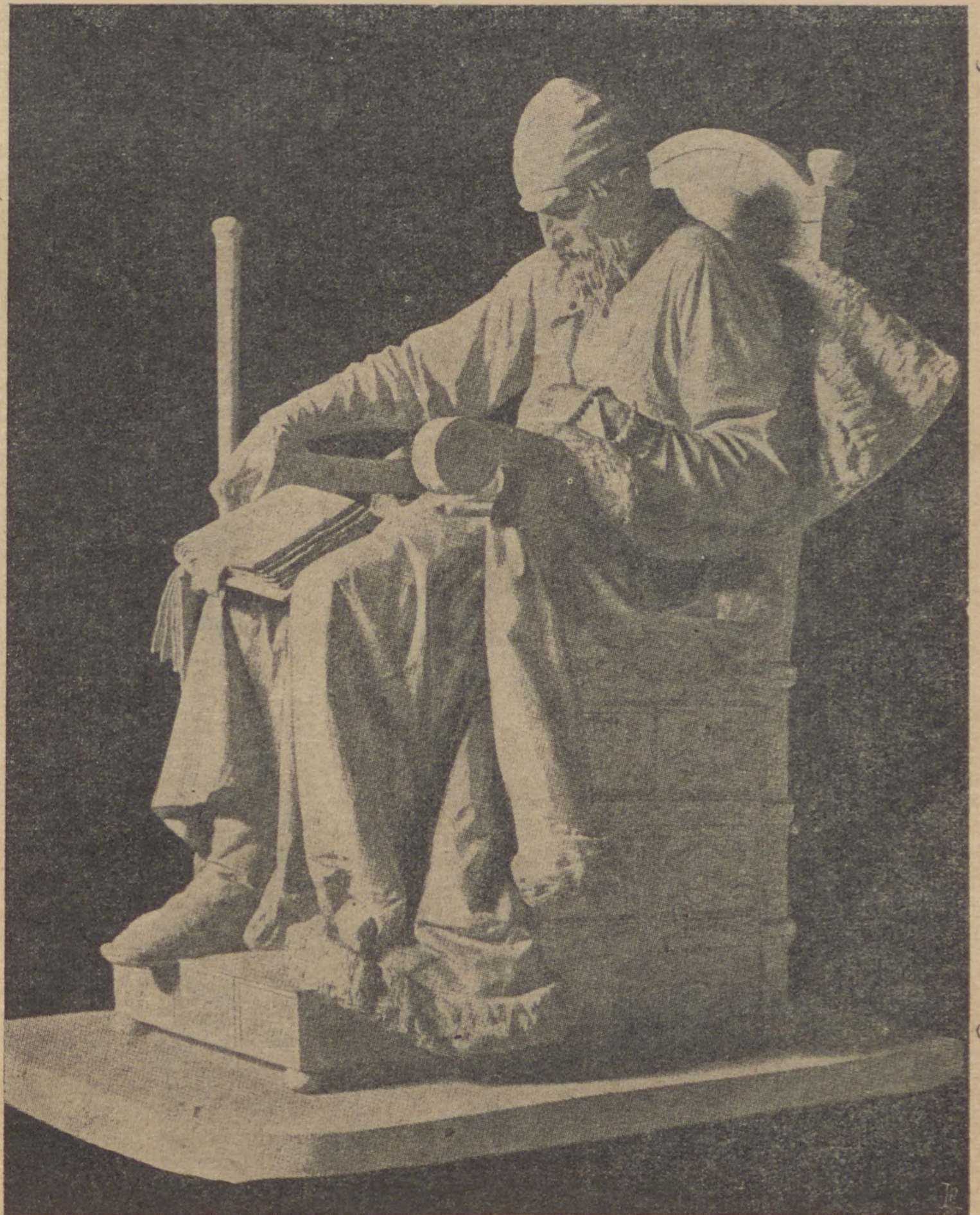
M. Antokolsky: Rettenetes Iván cár

Mialatt várta a kiutazásra a kedvező alkalmat, meg kellett érnie a legrosszabbat, ami embert érhet. Az el-