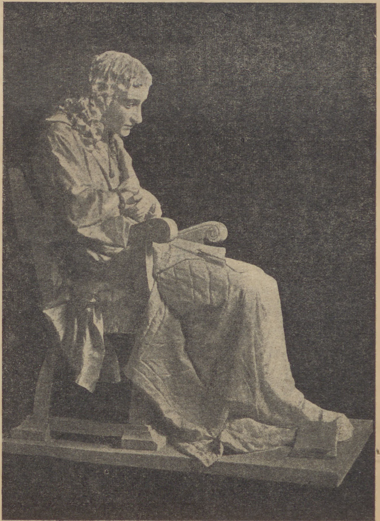
M. Antokolsky: Spinoza