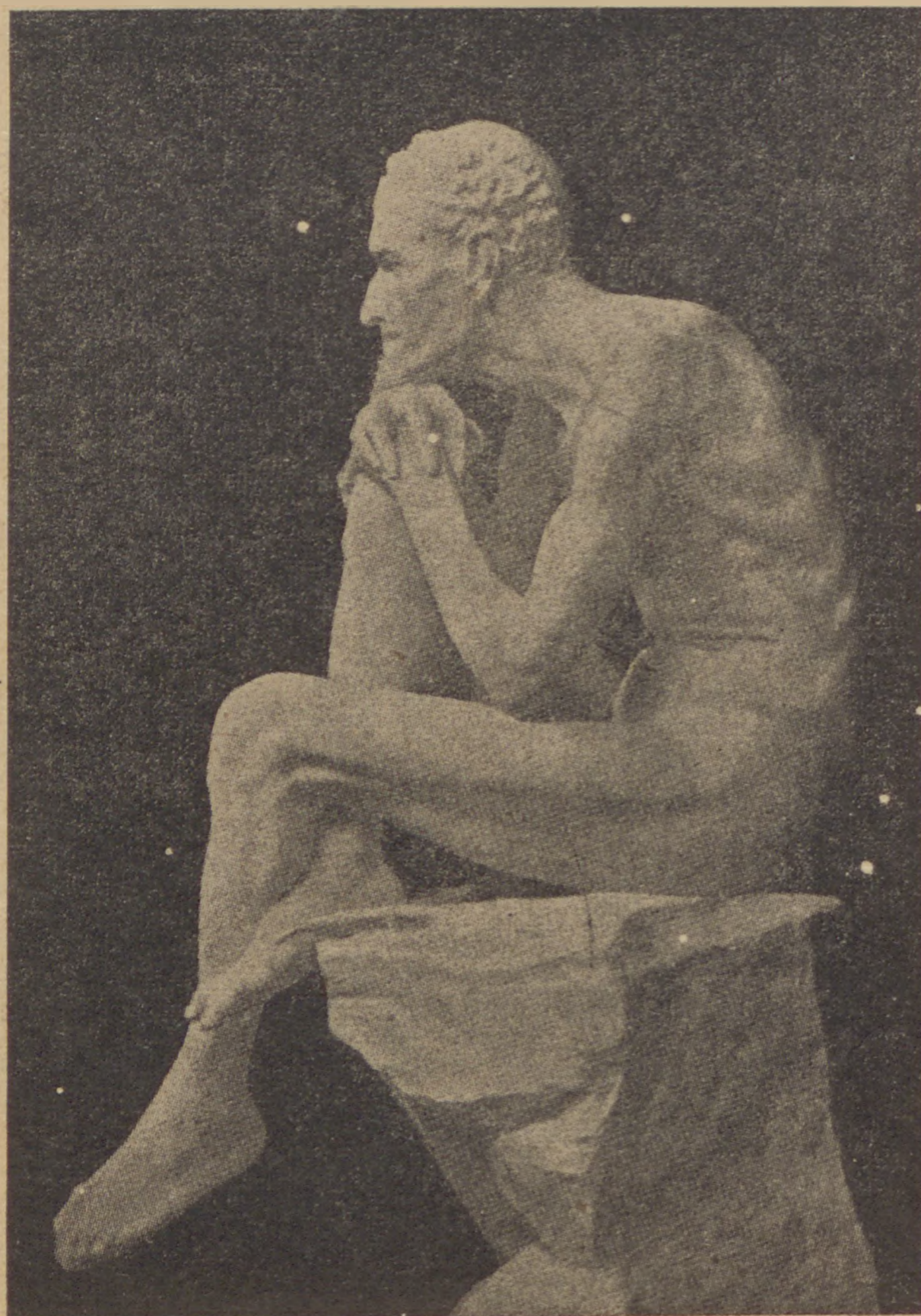
M. Antokolsky: Mefisztofelesz

Az éjszakában remény ébred s a vad csend megremeg. A törvény ősi és örök: Győz a fény a sötét fölött; a Hajnal közeleg.