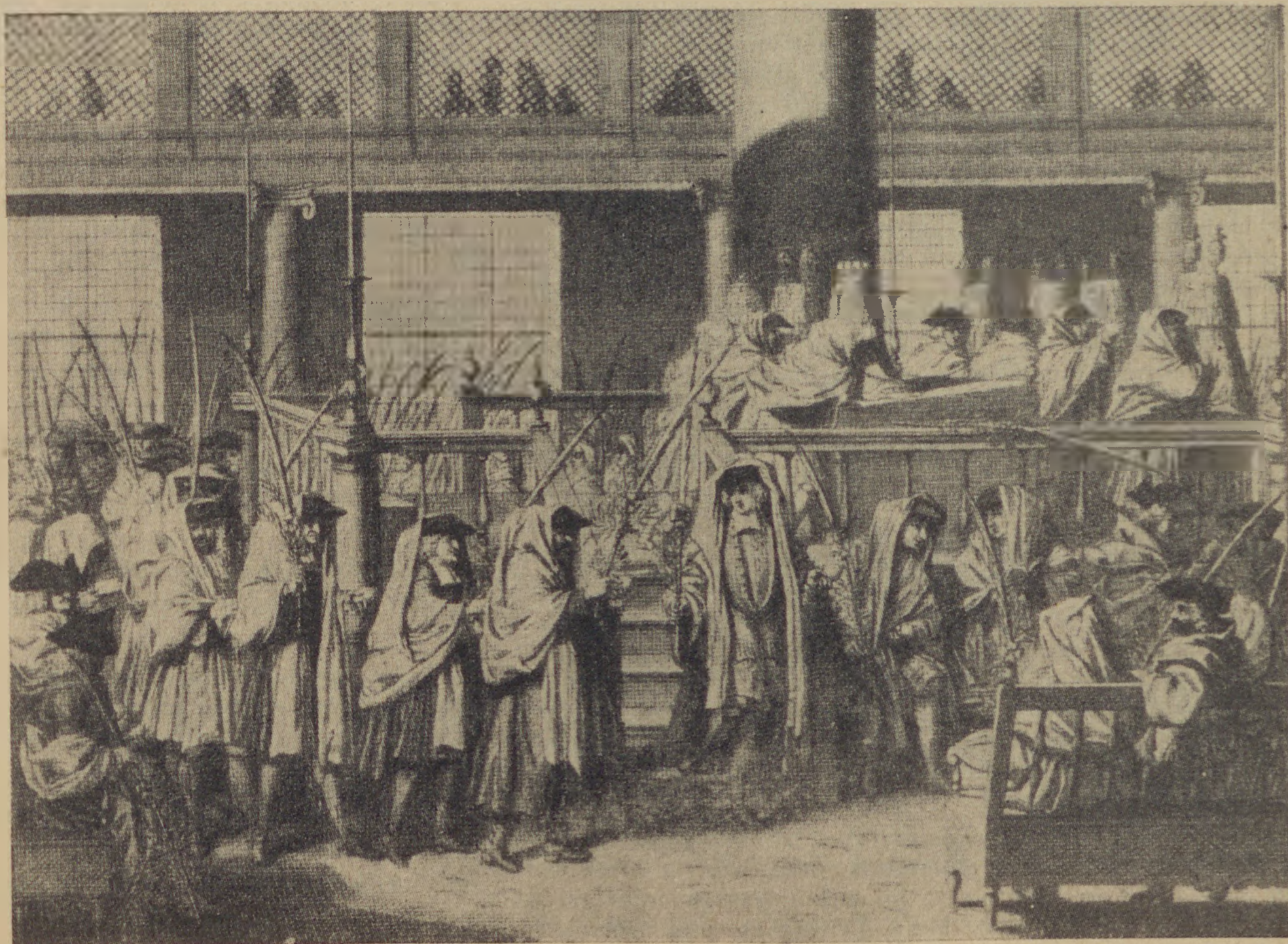
B. Picart: Sátorosünnepi körmenet

Am Rausnitz úr ezzel még nem érte be. Hogy Robicsek