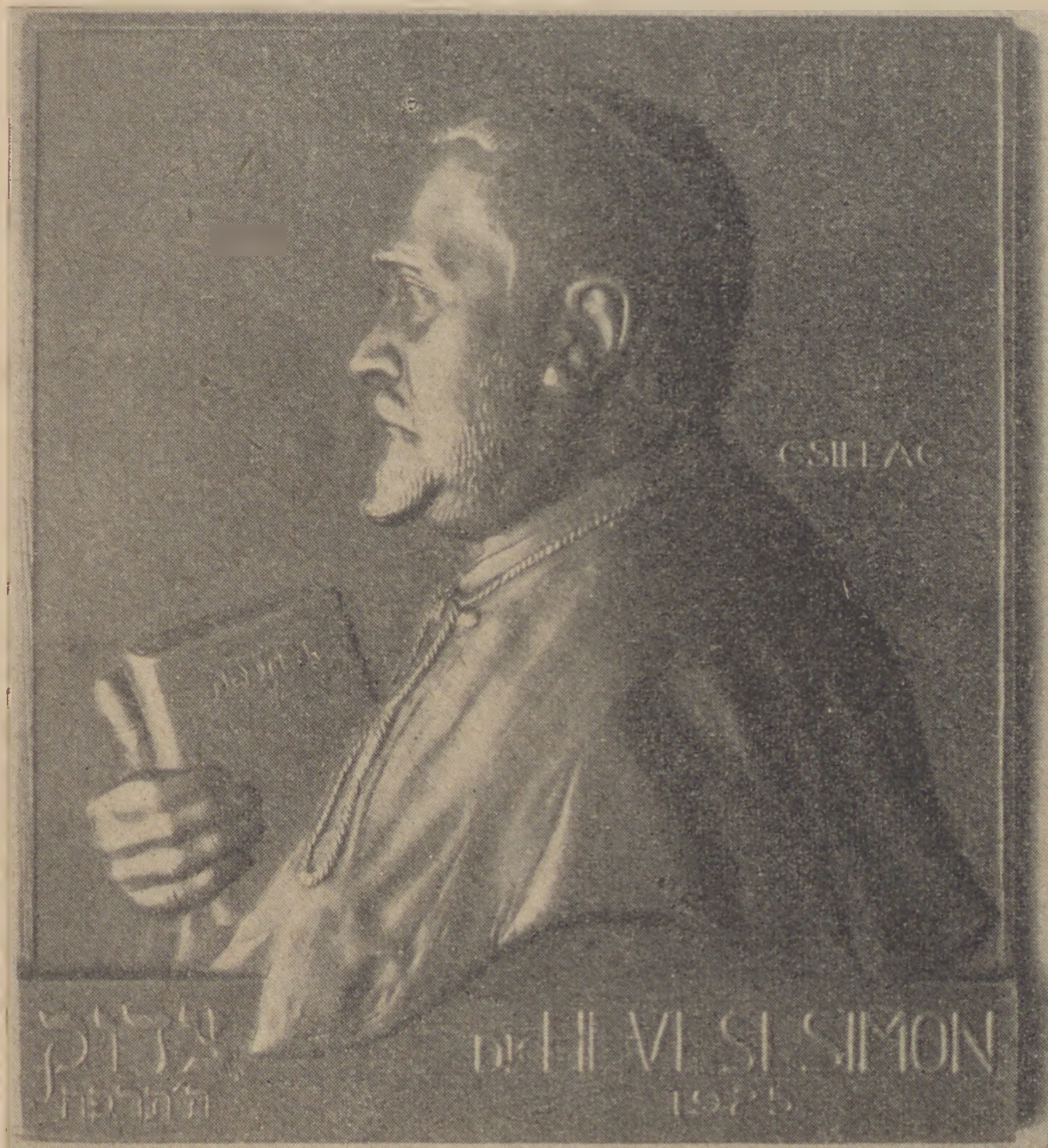
Hevesi Simon (Csillag István plakettje. Országos Magyar Zsidó Múzeum)

ságok közös gyűjtőneve. De azok a papok, akik paposaknak akarnak látszani, rendszerint ott vétik el a dolgukat, mikor ezt a sokrétű és nagyon differenciált magatartást egyszerűen kenetteljességgel akarják helyettesíteni. Vagy pláne pátosszal! Micsoda durva tévedés! Hiszen, ami papos , az mindig valami halk, szelíd, gyöngéd és pasztelles; nem tűri a szellemi tarka-barkaságot és a formai rikoltást. Nincs szüksége lendületes, nagy gesztusokra, sem tenor, vagy baritonszínű érchangokra. Mindebből csak egy kevésre van szüksége, de az a kevés úgy elegyedik benne, hogy valami más, valami új, lágy, meleg és szívhezszóló egészet ad. Stentori hangon Istenről beszélni, levegőt pofozó, hatalmas gesztusokkal a szeretetről prédikálni: óriási stílustalanság. Hevesi Simon lágy, kissé fátyolozott, sohasem erőltetett hangja, puha, kerek gesztusai, tökéletes papos stílusú volt. Hogy miképpen viszonylik hozzá és általában az igazi, papos paphoz hasonlítva a kenetteljes , vagy patetikus pap, azt talán leginkább zenei példákkal tudnám ábrázolni. Például a IX. szimfónia