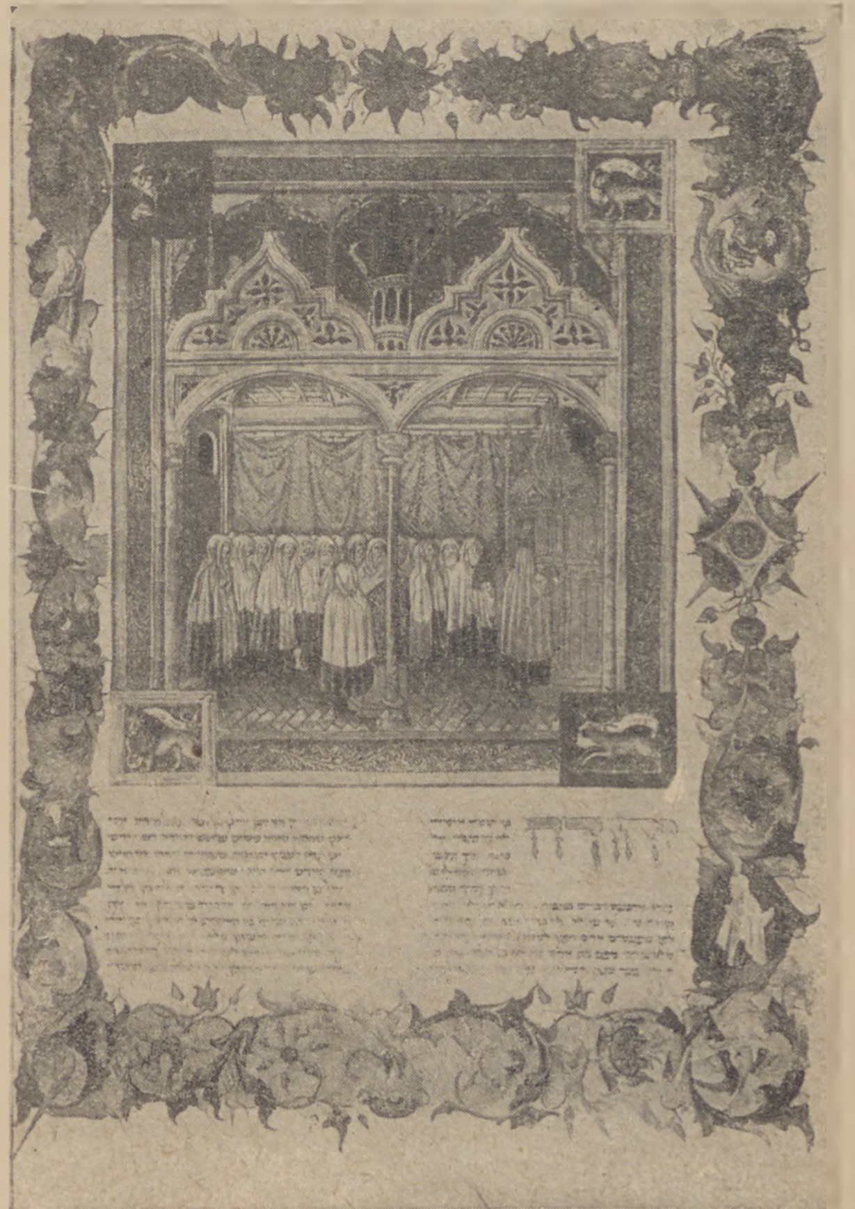
Középkori zsinagógában (Cod. Ross. 555. Vatican)

E két ókori ábrázolás után a miniatűr festészet által megőrzött középkori zsinagógák leírását látjuk. Ezek stílusukban alkalmazkodtak a kor román-gót és mór irányához. A legrégebbit a művészeti szempontból is híres szarajevói haggadában találjuk. A középkori haggadákat képsorozat vezeti be a teremtéstől az egyiptomi kivonulásig. Ezt követi a haggada szövege, majd a jeruzsálemi templomról való kép zárja be, amely a jövő szabadulásra — peszach leatid — utal. A szarajevói haggadában ezután van még