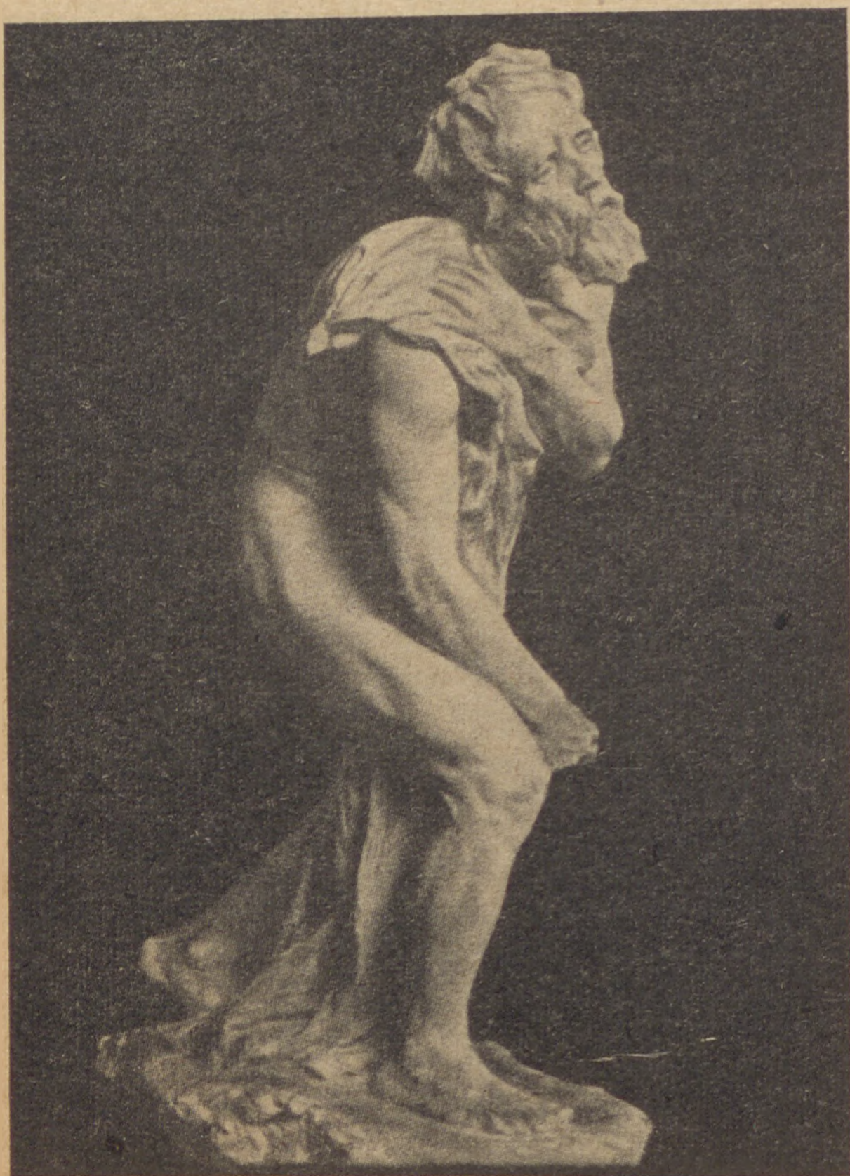
S. Fr. Beer: Semá Jiszráél

Kibékülve ellenséggel, Kibékülve földdel, éggel, Tiszta szívvel ide térünk, Mindenkit kiengesztelve, Minden jóval frigyre kelve, Tőled, Isten, áldást kérünk.