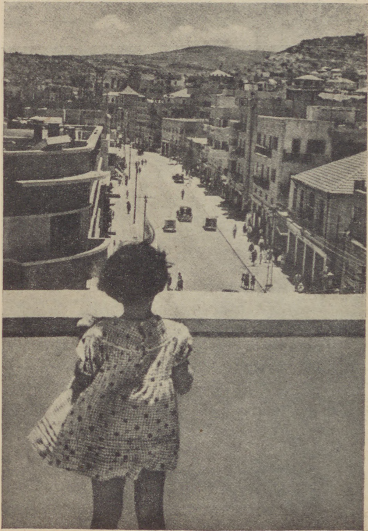
Pillantás a hajfai Herzl-útra

Hajeszodnak a gyarmatosok támogatása. A földeket a Keren Kajemet szerzi meg, minden mást a Keren Hajeszod végez. Kölcsönzi a beruházások, az első vetőmagszükséglet, a mezőgazdasági gépek, az állatállomány stb. költségeit. Élő és kamatozó befektetések ezek a kölcsönök, melyeket a gyarmatosok boldogulásuk arányában meghatározott időn belül visszafizetnek, hogy aztán végtelen sorban ismét újabb és még újabb telepések kezébe kerüljön, újabb és újabb virágzó egzisztenciákat indítson el a szebb és biztonságosabb jövő felé. A pénznek és munkaerőnek ez az egymást kiegészítő, eszményi körforgása megfogja minden zsidó szívét, aki zsidóul érezni tud, aki szereti Palesztinát és aki a Keren Hajeszod munkáját megismeri. Ezért van az, hogy táborunk a jelenlegi viszonyok dacára egyre nő, itthon Magyarországon is. Mi nem politizálunk, bennünket semmi egyéb szempont a Palesztina-szereteten túl nem vezet s mi semmi egyebet nem akarunk elérni munkánkkal, csak hogy Palesztinában produktív mezőgazdasági és ipari munkára, ezzel együtt tisztességes megélhetésre módot adjunk. Hogy ezt a munkát zsidó testvéreink megértik és méltányolják, annak számos, meghatározható példáját sorolhatnám fel a hivatali helyiségeinkben lejátszódó jelenetekből. Örömmel látjuk ezekből az epizódokból, hogy a magyar-