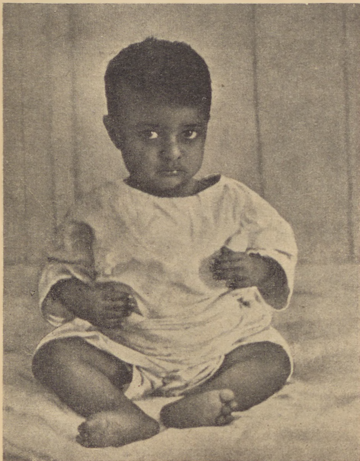
Jemenita kisfiú egy telavivi gyermekotthonban

Örömmel szögezem le ismételtén: ha későn is ébredt a magyar zsidóság saját érdekeinek, valamint Palesztina jelentőségének tudatára, viszont most, hogy egyre szélesebb körben ismerik meg munkánkat, szinte azt mondhatnám, úgy tűnik, mintha évek mulasztását hónapok alatt akarná behozni és évtizedek lanyhaságát, rövid évek alatt ellensúlyozni. Szeretettel és bizalommal, hittel és zsidó szívvel sereglük körénk a magyar zsidóságnak különösen a művelt