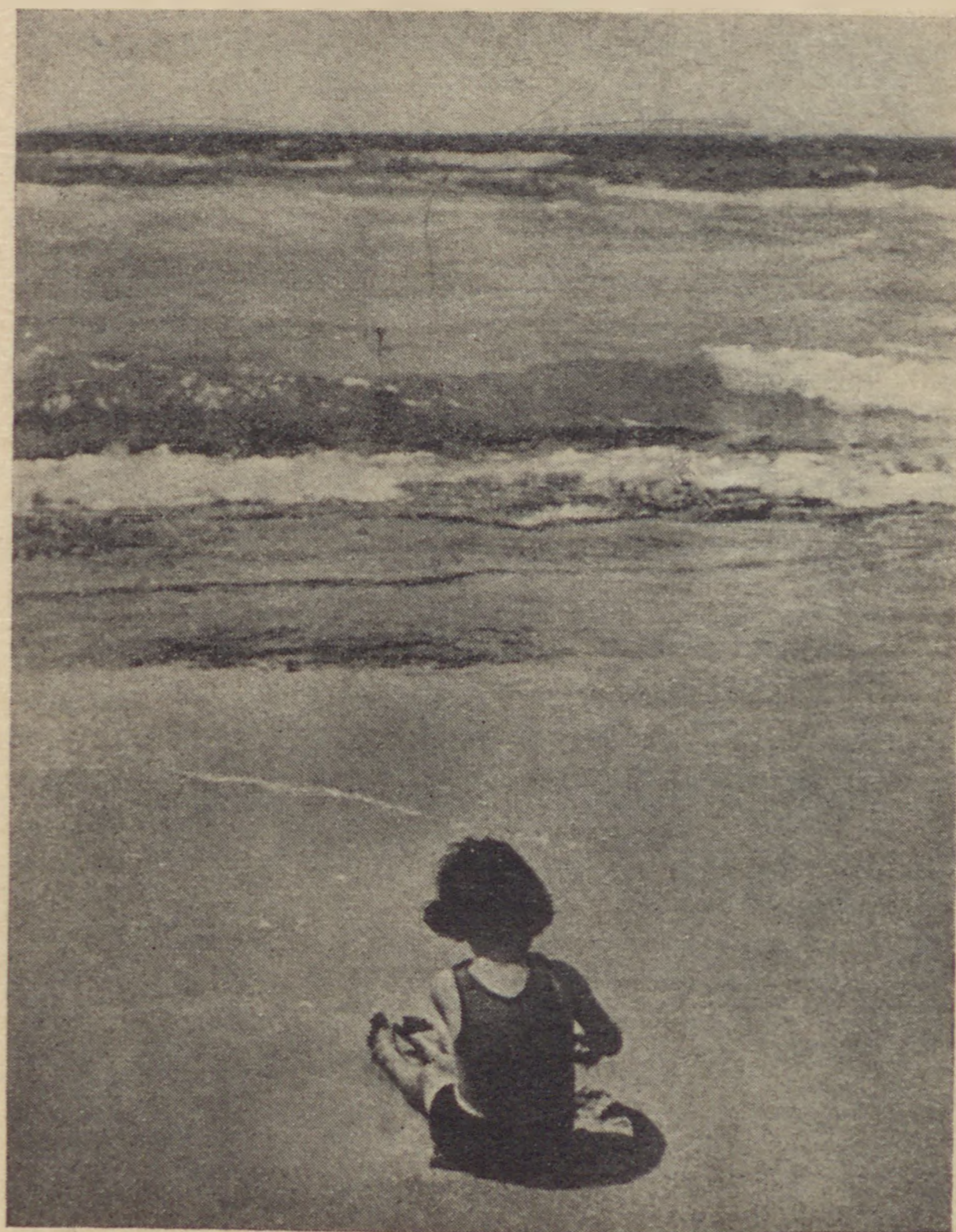
A telavivi strandon

A nagyváradai Chevra Kadisa 1868-ban tartott közgyűlésén báró Eötvös József vallás- és közoktatásügyi minisztert választotta meg első dísztagjának. Báró Eötvös József, aki finom kiállítású levelet kapott, ez alkalomból a következő levelet intézte a Szentegylet elnökéhez: