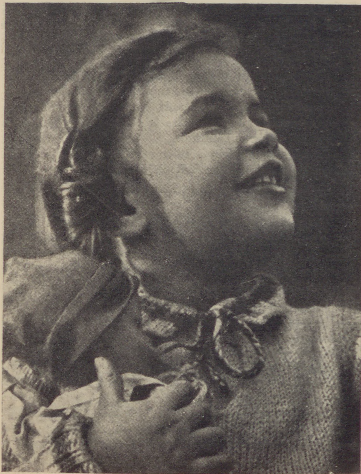
Palesztinai kisleány

És ekkor, mint valami túlvilági hang, messzi, idegen és mégis ismerős hangszúllyal, megszólalt Channa néni lelkében: