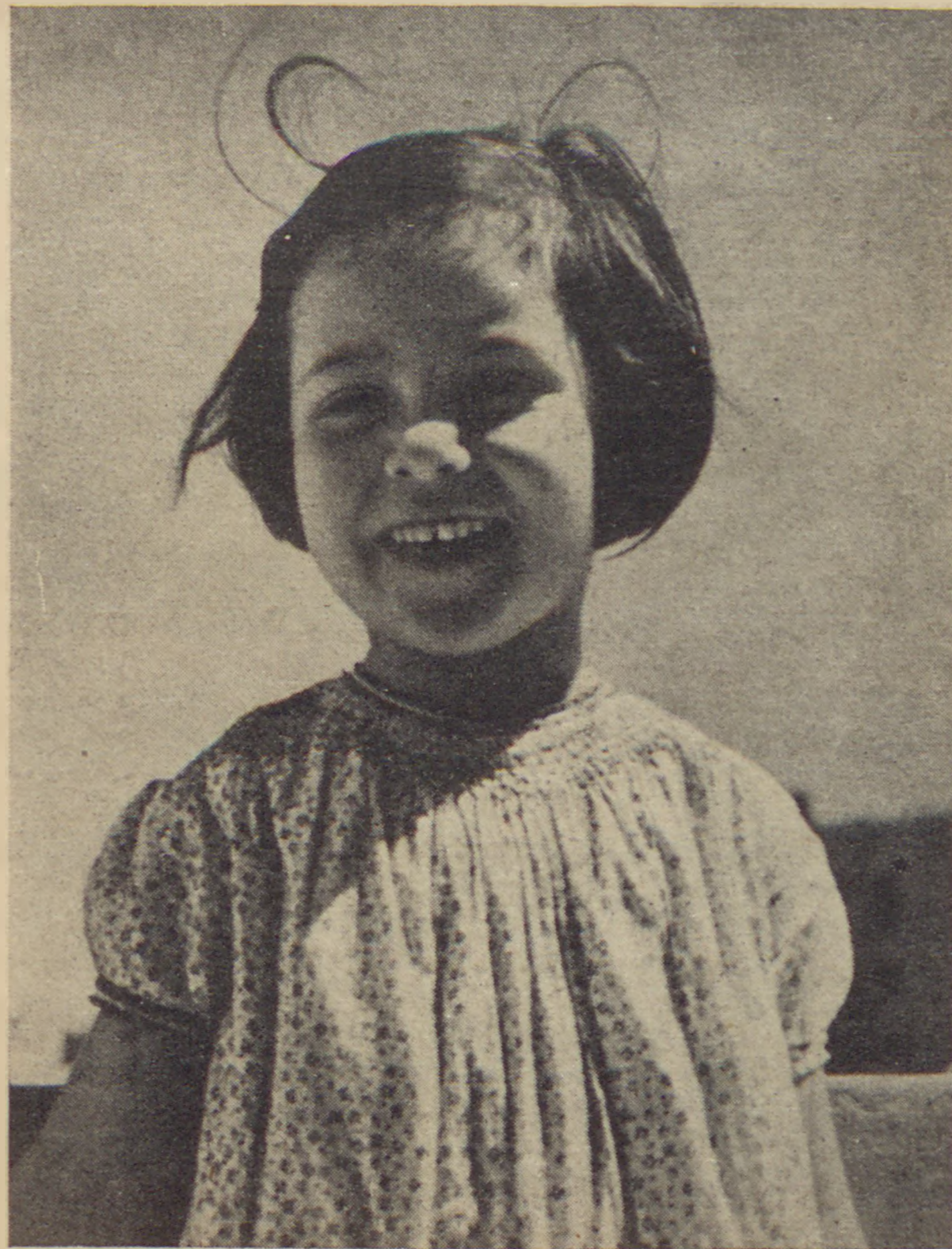
Jeruzsálemi kisleány

A fűrészmalmos tudta, hogy a cádik meg fogja látogatni. Nem lepődött meg, mikor a ryszkovi szent belépett hozzá. A cádik előadta a nagy kérést. A nábob lesütötte szemét, nem akart a cádik arcába nézni. Hallgatott. Ez a hallgatás szégyenteljes és áruló volt. Vért kergetett a cádik arcába és Reb Májer úgy érezte, hogy szíve, a fájdalomban és a sorsüldözöttség szolidaritásában beteg szíve rögtön kiugrik helyéből, ha ez a kélev nem-et fog mondani. Lángoló szavakkal ecsetelte előtte a sorsot, a meg-megújuló zsidó sorsot... Ámde jégpáncélba ütköztek a forró szavak és nem tudták a fagy és hidegség páncélját áttörni. Tanácstalanul