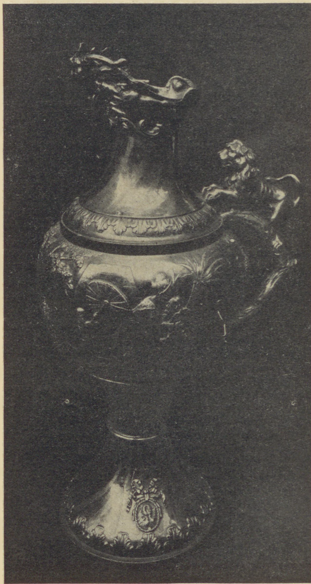
Régi, nagyünnepi ezüstkorsó a kohaniták kézmosására az áldás előtt. (Amszterdam)

nevében történt a kijelentés, a mult és jövő időre nézve, a feloldás és érvénytelenítés egyaránt. A híres talmudmagyarázó Rabbi Kairuváni Niszim, Tószafoszra hivatkozva, világosan és határozottan azt állítja, hogy Rabbi Eliezer b. Jákob tanítása és az azon alapuló K. N. formula csak azokra az esetekre vonatkozik, mikor az illető fogadalomtevő csak a maga személyére gondolt az esküvés vagy fogadalom alkalmából. Ha azonban esküt vagy fogadalmat tett és kötelezettséget vállalt másokkal szemben, akkor a K. N. formulája nem használ neki semmit. Nem oldja fel a vállalt kötelezettség alól! Magyarozatát megerősíti bölcseinknek az a tanítása: Ha-moder hánoo mechávéro. én mátirin lo elo befonov. Ha tehát a jámbor hívő eltiltotta magára nézve valaminek az élvezetét, mint pl. bor vagy hús élvezetét, vagy nemes cselekedet gyakorlását határozta el a szívében, akkor ez kizárólagosan a magánügye, melyért csak Istennek és saját lelkiismeretének tartozik felelősséggel. Ha ellenben más eskette meg, vagy mással