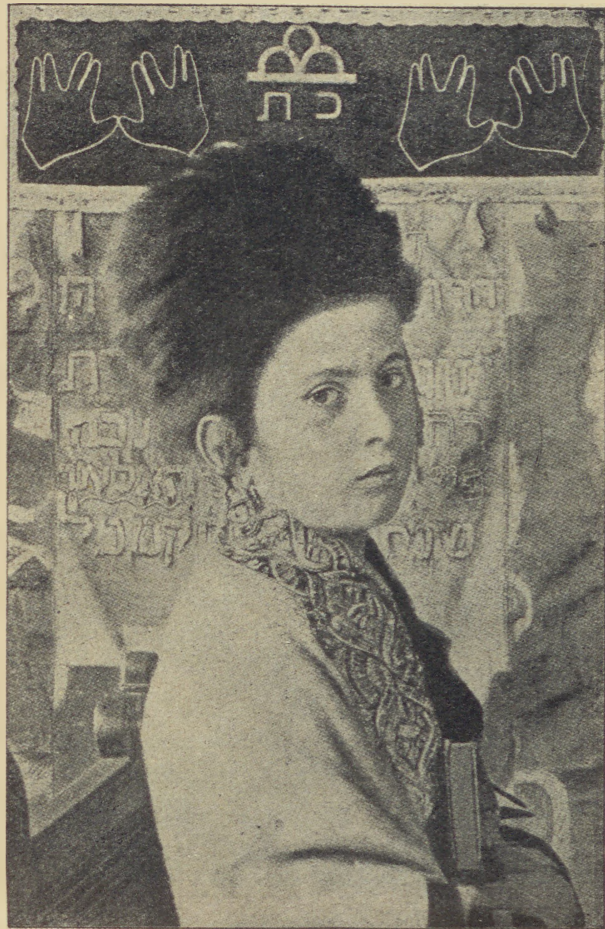
Isidor Kaufmann: Papok ivadéka

A kehila gyermekeit a saját gyermekeiképpen szerette.