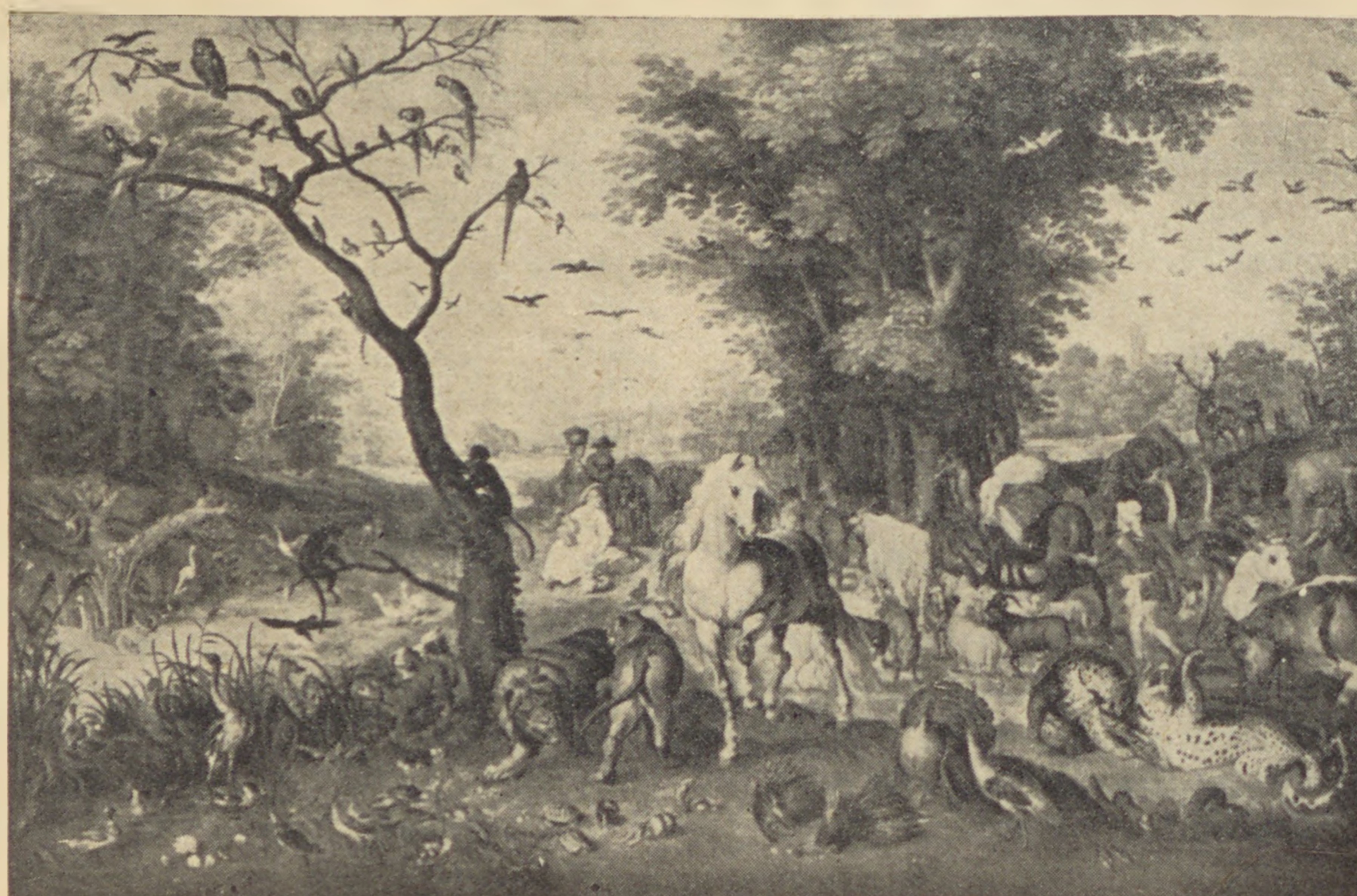
Brueghel: Noé bárkája (Szépművészeti Múzeum, Budapest)

A lelki átállítódás — jó értelemben — 1940 magyar-zsidó éjszakáján összegezve tehát egyet jelent a kollektív felelősségtudat megszületésével. Ennek a gondolatnak a propagálása érdekében kell a lehető legsürgősebben mindent megtennünk. Népszerűen, pregnans egyértelműséggel ezt a gondolatot a természetből vett hasonlattal fejezhetjük ki: vihar dúl körülöttünk, az égboltozaton sötét felhőtörzslaszok. és mi, üzött, hajszolt, viharvert bárányai a magyar-zsidó sorsnak félve, fázva, fogvacogva, dideregve búvunk egymáshoz. Így egy kicsit elviselhetőbb nehéz, súlyos életünk.