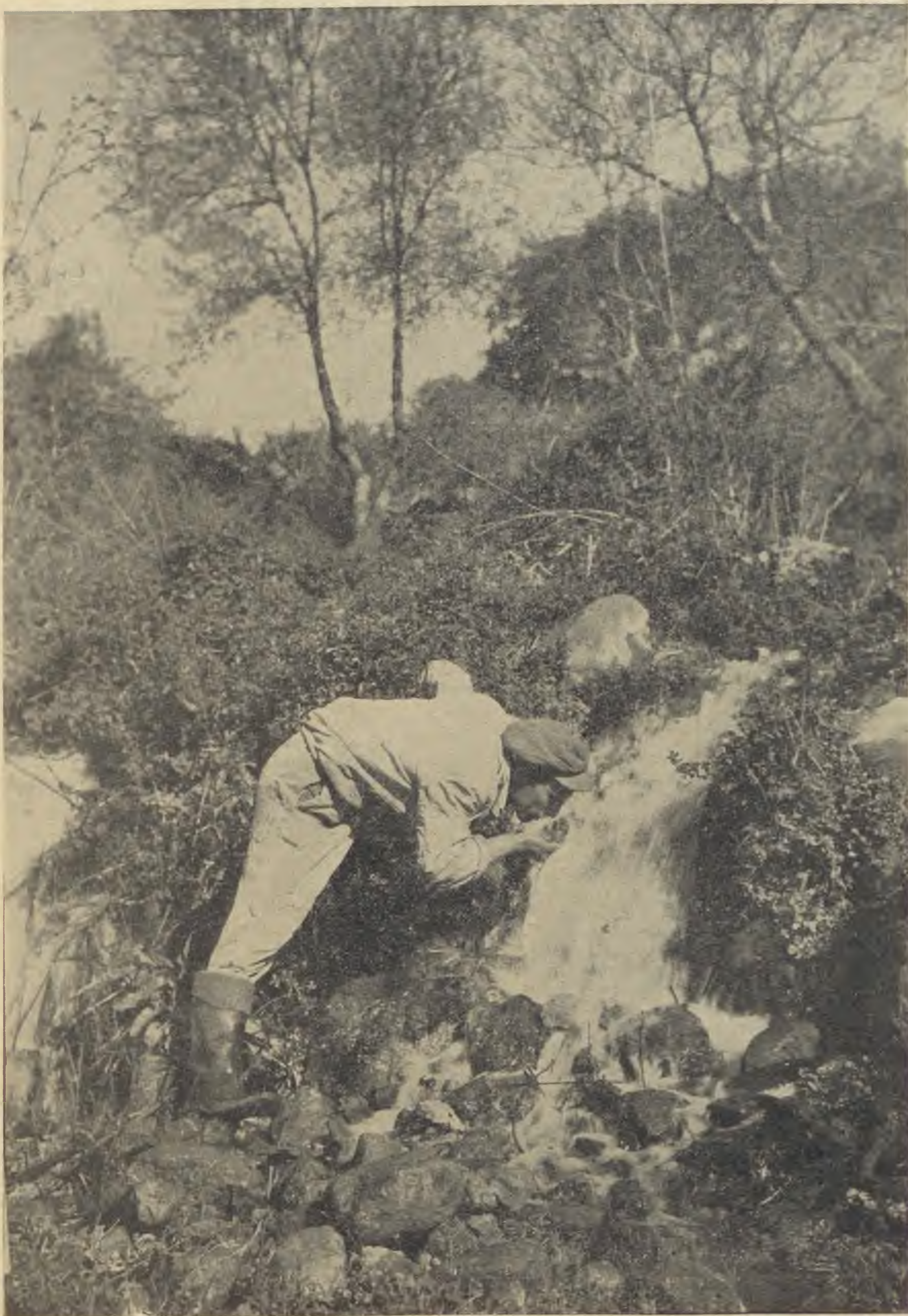
Vizesés Galileában (A Keren Hayesod legújabb naptárából)