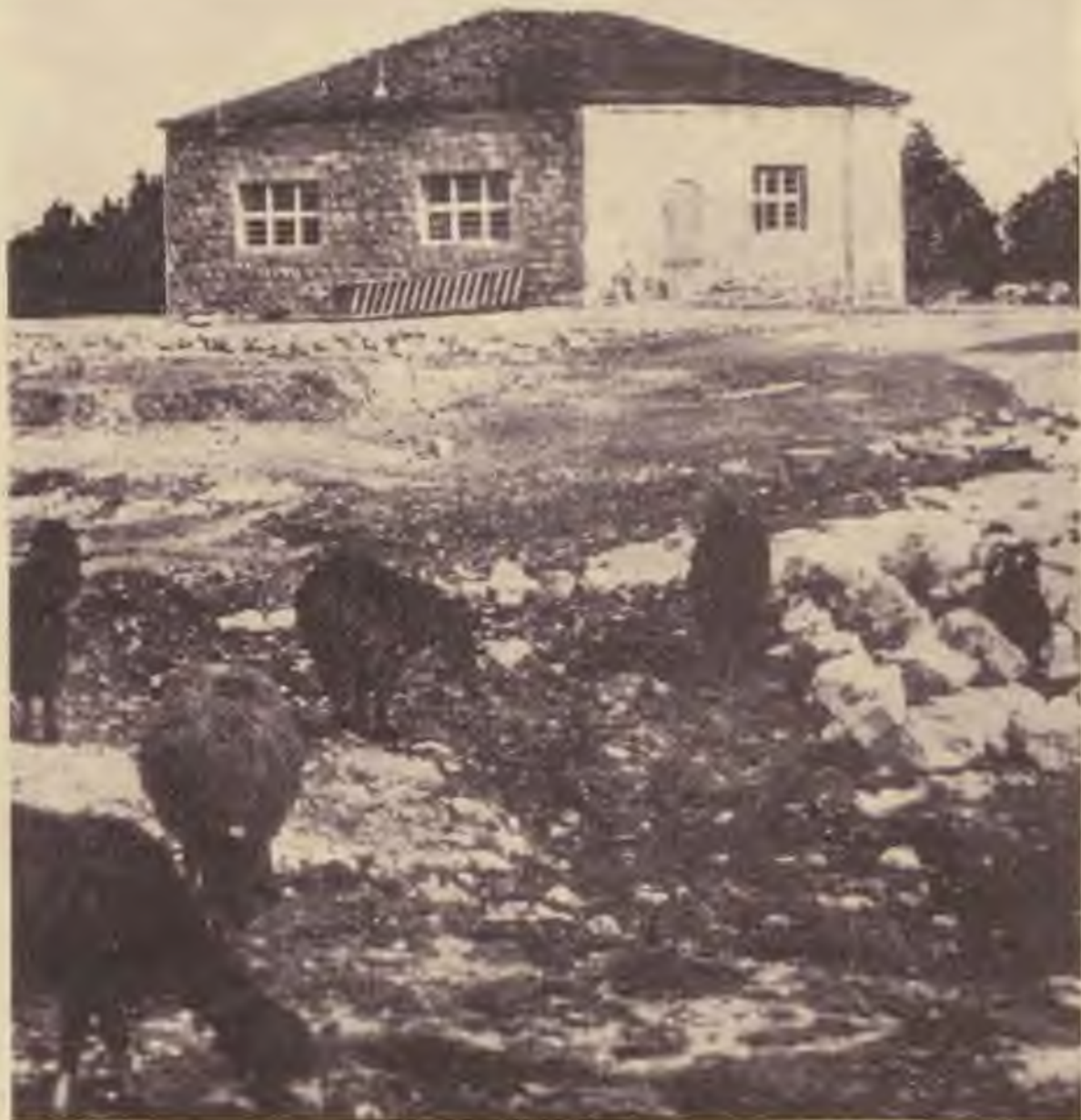
Az első „egyetemi épület“

A raktár baloldalán állt egy régi épület, melynek egyes részeit elkezdték lebontani, kihővíteni és új szárnnyal megtoldani. Napról napra nőtt a forgalom a kis raktár körül. Köveket hordtak, meszet oltottak, a munkások száma növekedett, az egész omladozó ud-