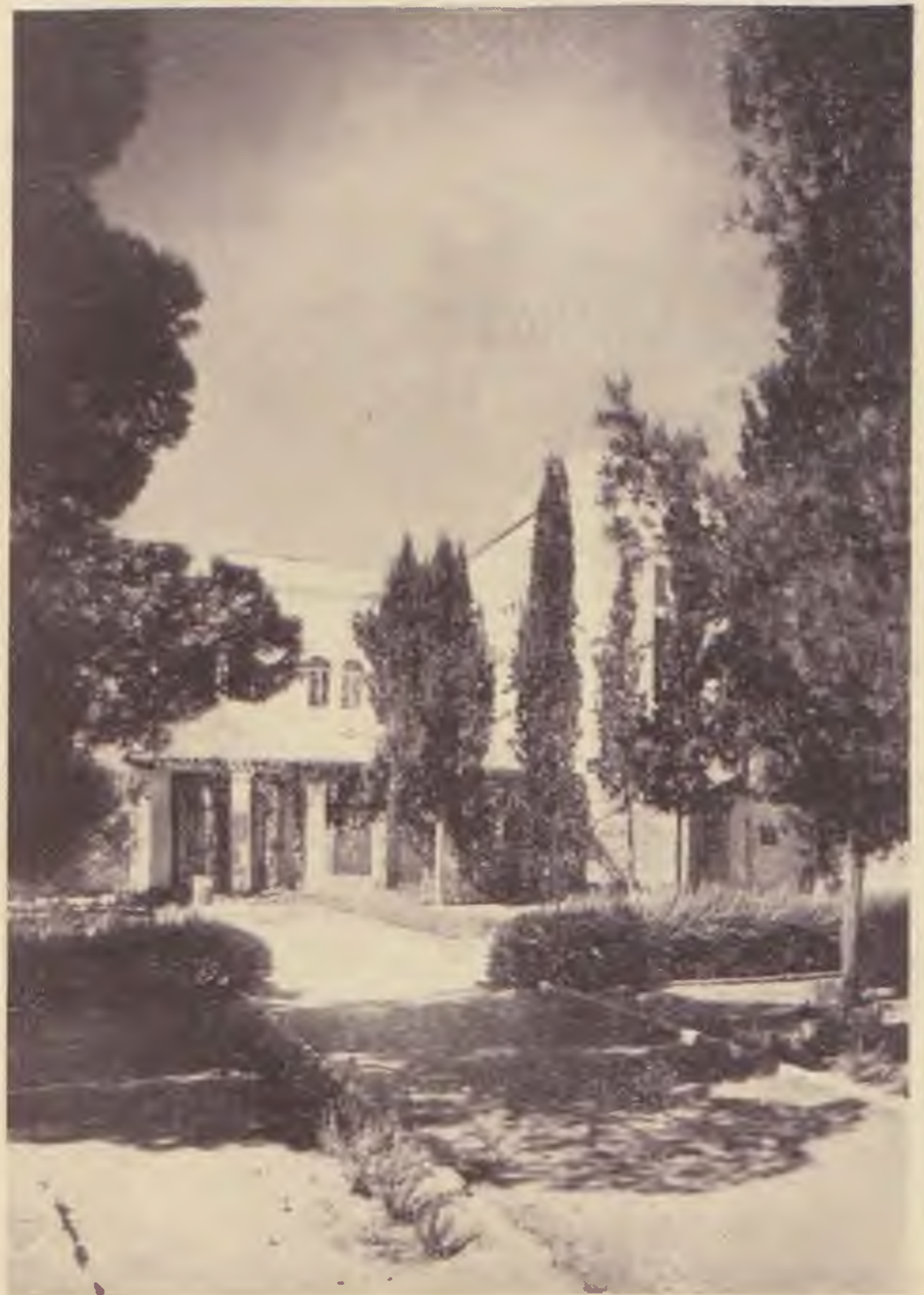
A jeruzsálemi egyetem kertjében

Ennek a nagyfontosságú törekvésnek a megvalósítása elsőrendű kötelessége a Héber Egyetemnek csakúgy, mint az egész világ zsidóságának.