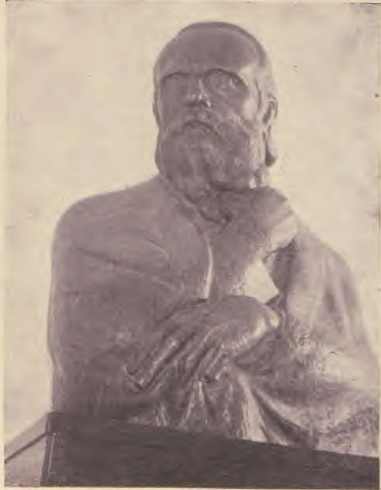
Prof. Hermann Schapira szobra a jeruzsálemi egyetemen