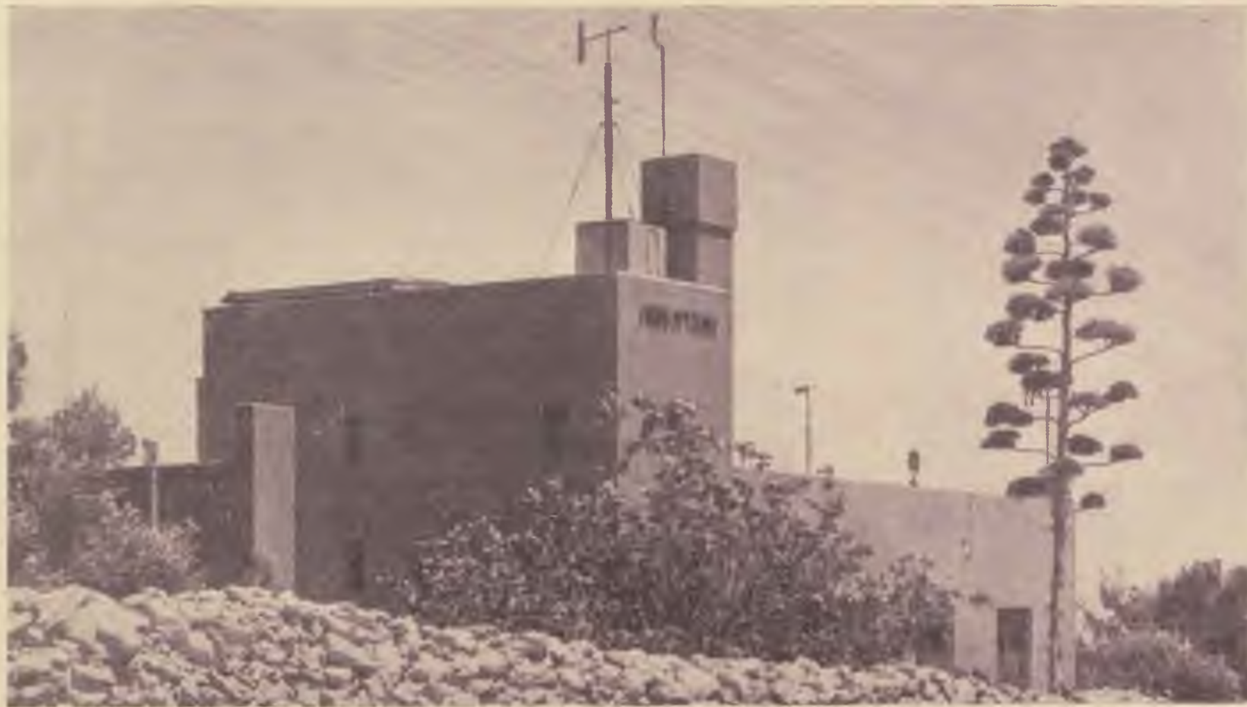
A jeruzsálemi Egyetem bioklimatológiai intézete. Mellette egy agave