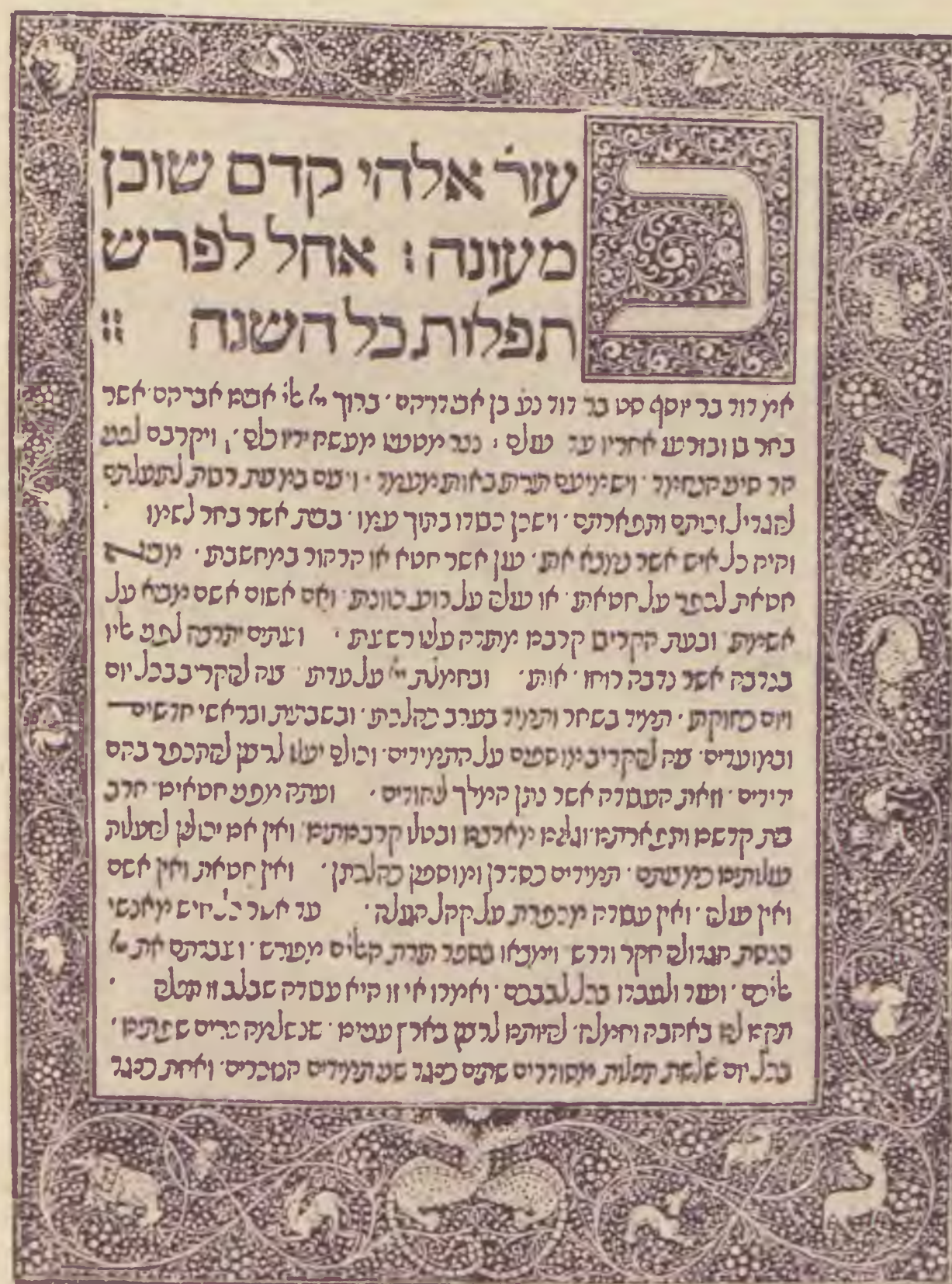
A Schocken-féle inkunábulum gyűjteményből az Egyetemi Könyvtárban: Abudurham könyvének első oldala. Nyomatott 1490-ben Lisszabonban

lesztinai zsidó ifjúságnak és értékes és erős szemet alkossanak a zsidó nép ujjáépítőinek láncában.