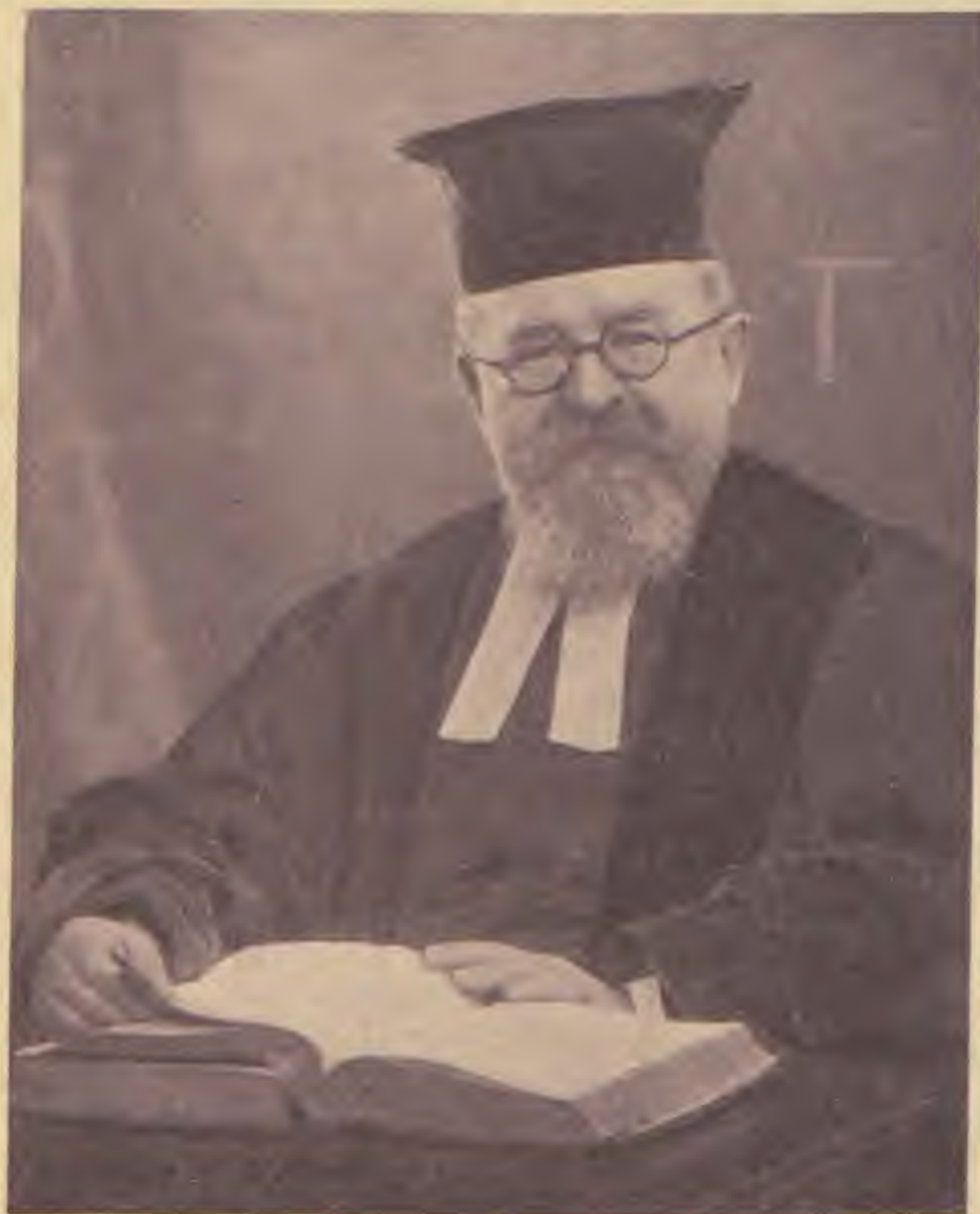
Dr. J. H. Hertz, a brit birodalom Chief Rabbija