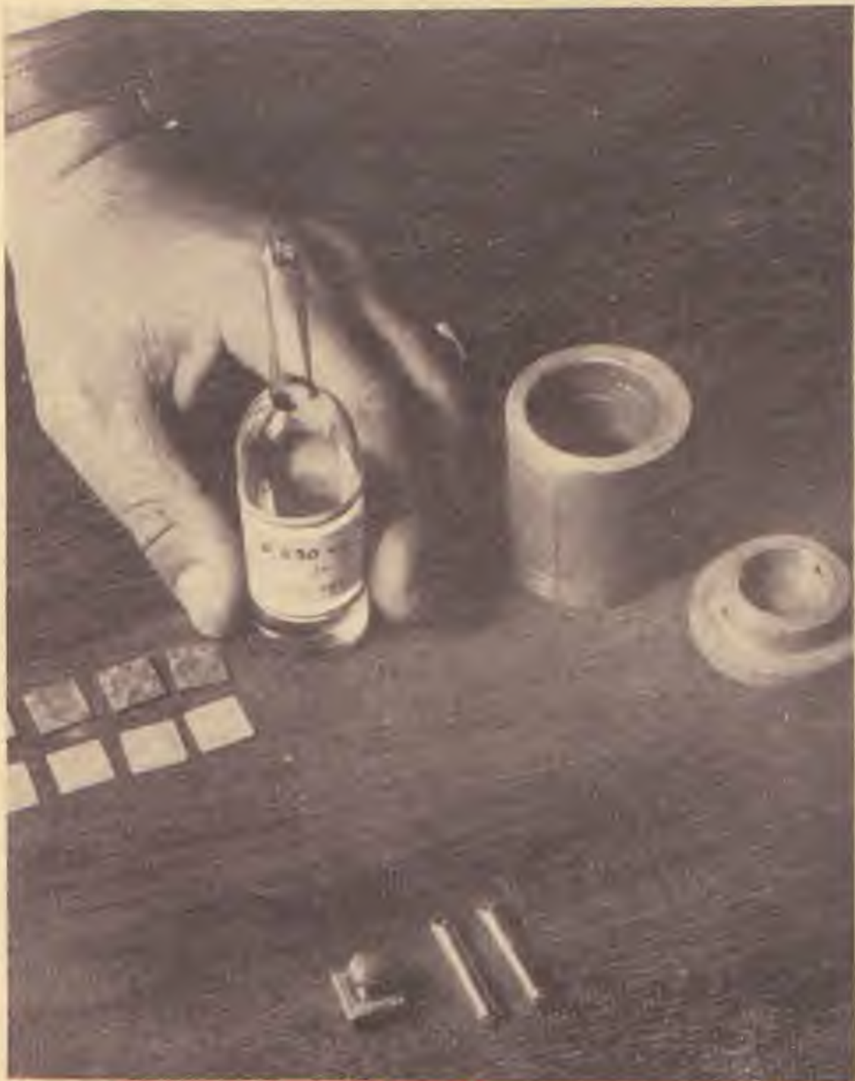
Rádiumpreparátumok (A Héber Egyetem rákkutató intézetéből)

A jeruzsálemi Egyetem az ősi zsidó kultúra felújításával, a Szentírás erkölcsi tanításainak terjesztésével, a Biblia tudományának művelésével, a magasabbrendű erkölcs szolgálatában áll. De világi tárgyainak tanításánál is a legmagasabb színvonal elérésére törekszik.