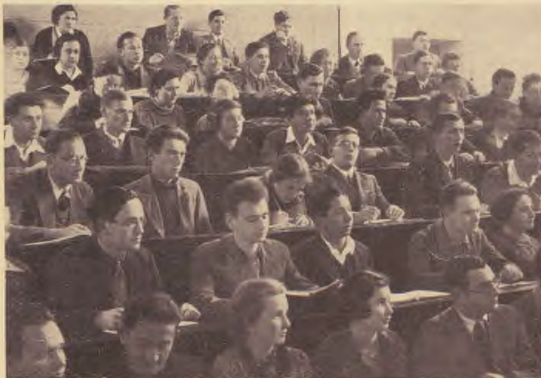
Hallgatók a jeruzsálemi héber Egyetemen

Az Egyetem baráti körei Palesztinában energikusan folytatják munkájukat. Ennek köszönhető nem egy katedra és intézmény létesítése. Többek között a bioklimatológiai állomás és a diák-otthon . Még igen sok a teendő. Tegyenek eleget külföldi barátai is annak a várakozásnak, melyet a jeruzsálemi Egyetem munkájukhoz és üldozatkészségükhöz fűz!