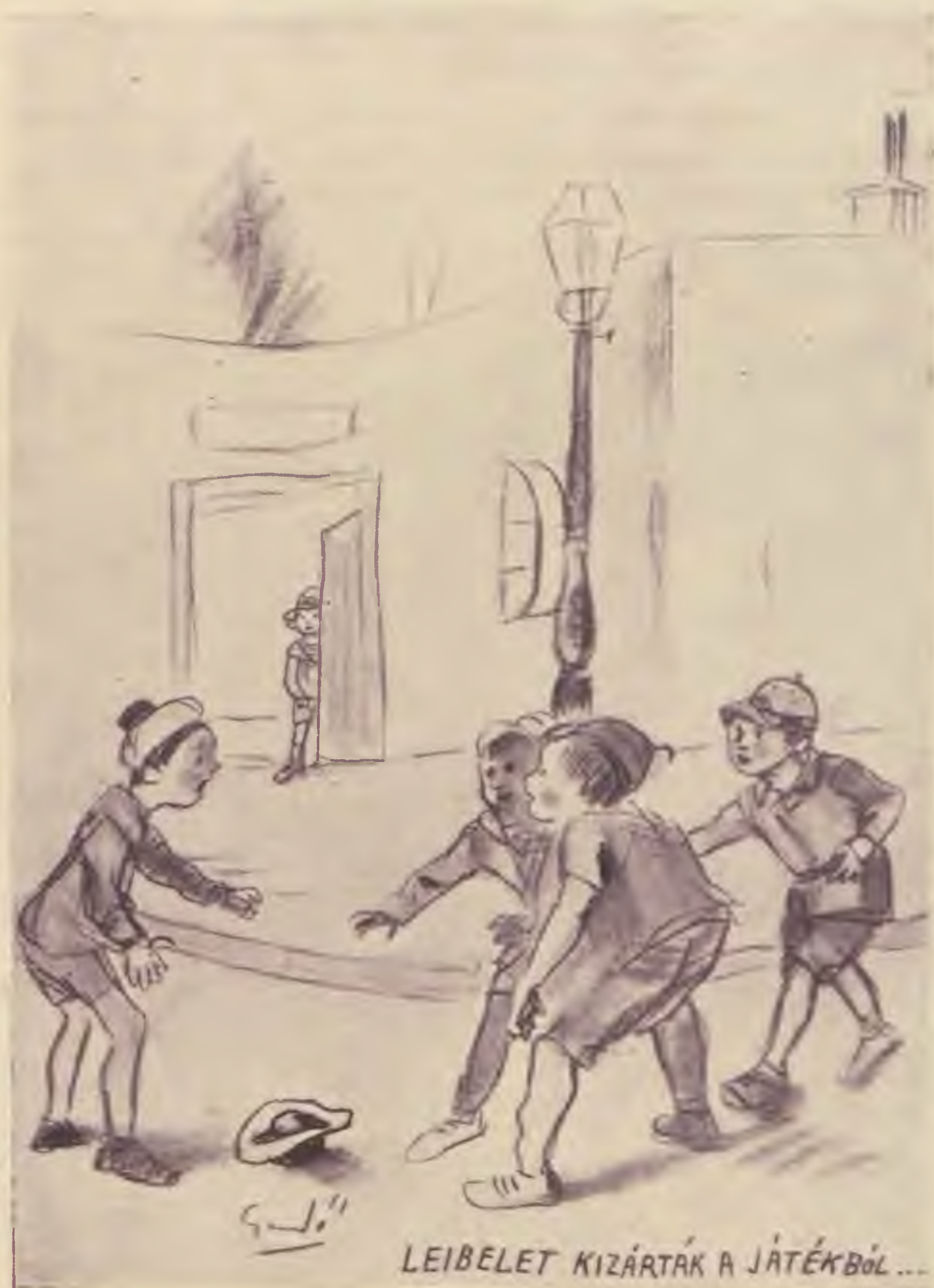
Gedő Lipót rajza