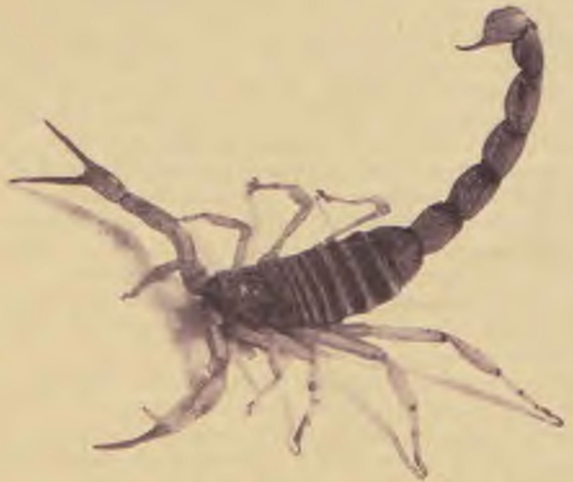
A jeruzsálemi Egyetem parazitológiai intézetéből. Skorpió