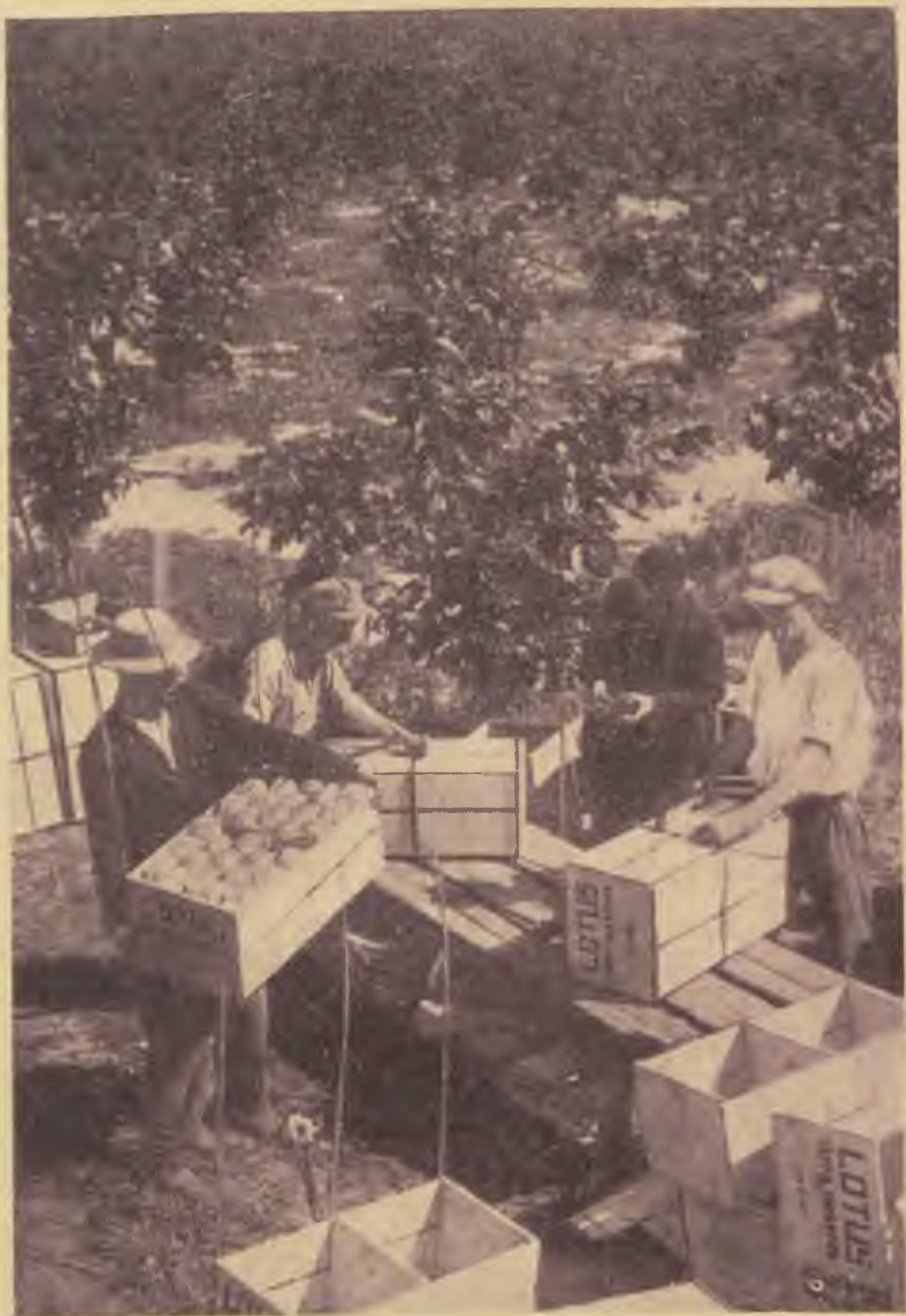
Az Egyetem diákjai a szünidőben narancsosban dolgoznak

gyermekkora évein át. S később is, valahányszor megtörve, rongyosan, új élet után vágyódva, megtért néhány napra vagy hétre a szülői házhoz, mert már sehol sem akadt számára kuckó és falat. S ő megint remélte, ez most a legutolsó hazatérés. Ez most a legutolsó új életre-készülődés. Ez most a legutolsó kéregetés, szülei házánál, ez most a legutolsó néhány ing, a legutolsó olcsó öltözet, a legutolsó ócska pár cipő, amit elfogad apja zsarnoki kezétől, hosszús tekintetétől. Vajjon valóban utoljára történt-e ez a „legutolsó”? Ó, hová lettek ezek az új Azarelek? Mily veszedelmesen hasonlítottak mind egymáshoz! S vajjon a következő nem fog-e megint csak hasonlítani azokhoz, amelyek már elmúltak?