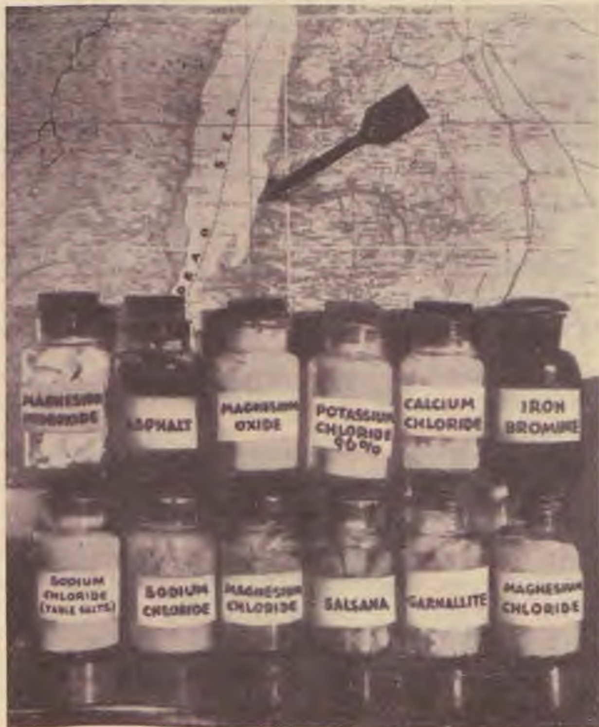
Geológiai osztály. A Holttengerben található kémikáliák

Kit Azarel? Édesapát? Az édesapát? Aki jó, aki nevel és szeret? Nem. Azarel úgy látja apját: ő az ember, aki ezt az inget hordta. S úgy látja, ahogy ezt hordta. Szegletes, heves, zsarnoki léptekkel ki tudja hány reggelen látta így apját, talán éppen ebben a hálóingben,