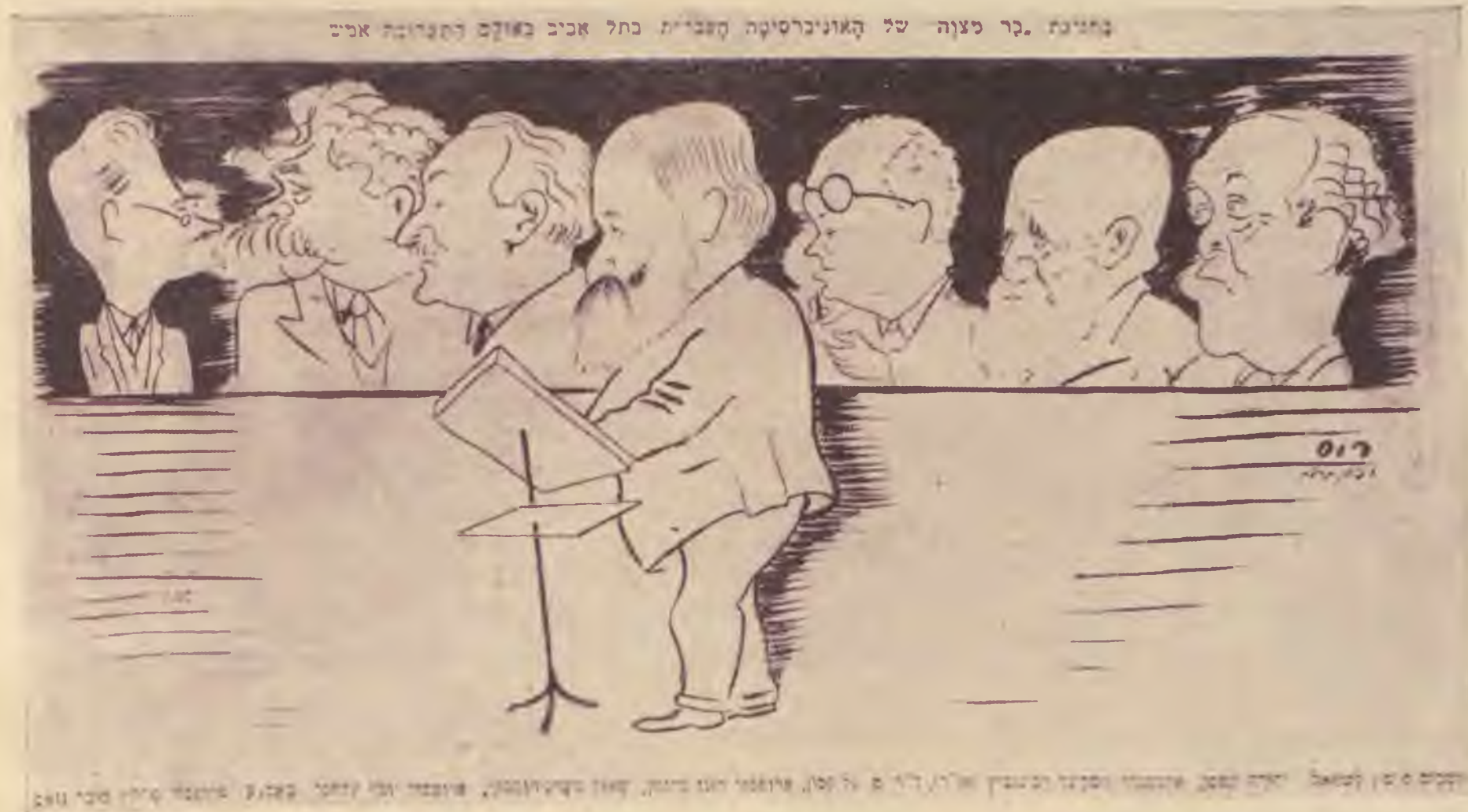
Martin Buber előadása a Héber Egyetem barátai előtt. Karikatúra a „Haarec”-ben

Tehát hivatalosan is megállapítást nyert, hogy a kisvárdai zsidóknak nem volt hazaáruló rádiója és a mátészalkai rabbinak nem volt 60.000 pengője. Mégis tovább szólt a rádió és tovább pengett a pengő. Sőt voltak, akik esküdtek reá, hogy mutattak nekik egy rádiót, melyen a kisvárdai zsidók rádióztak és egy pengőt, amely a mátészalkai rabbi hazafiatlan gyűjtéséből származott. Több és meggyőzőbb argumentum aztán nem is kell manapság.