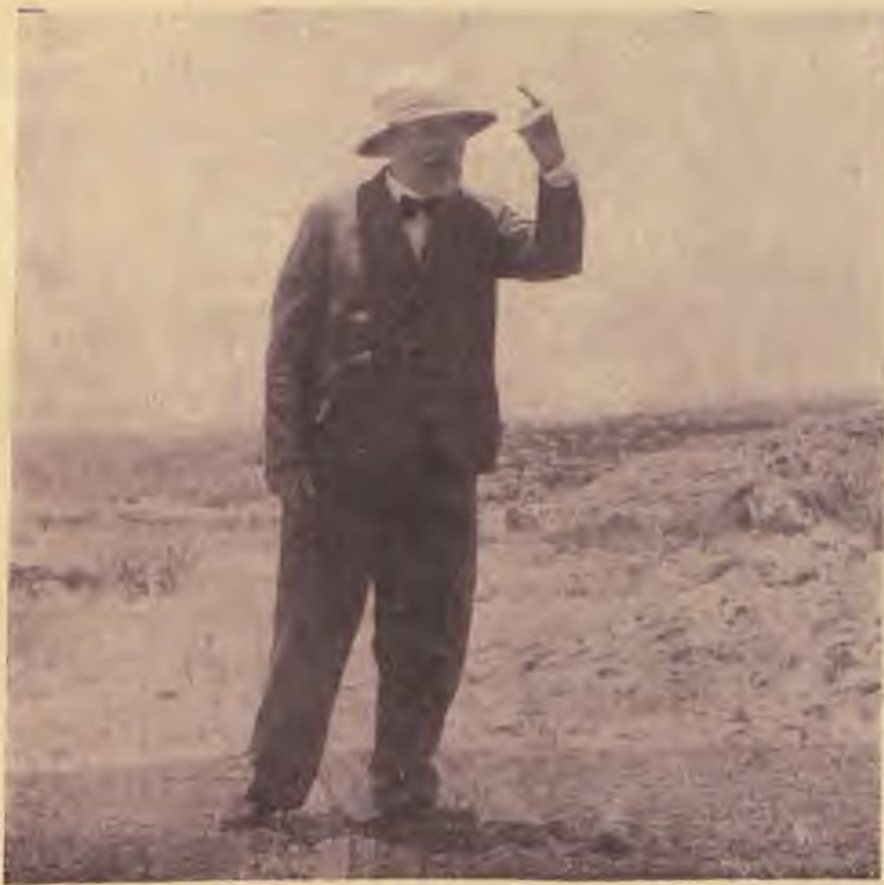
Ussiskin beszél a jeruzsálemi Egyetem szellemtudományi intézetének alapkövetési ünnepélyén