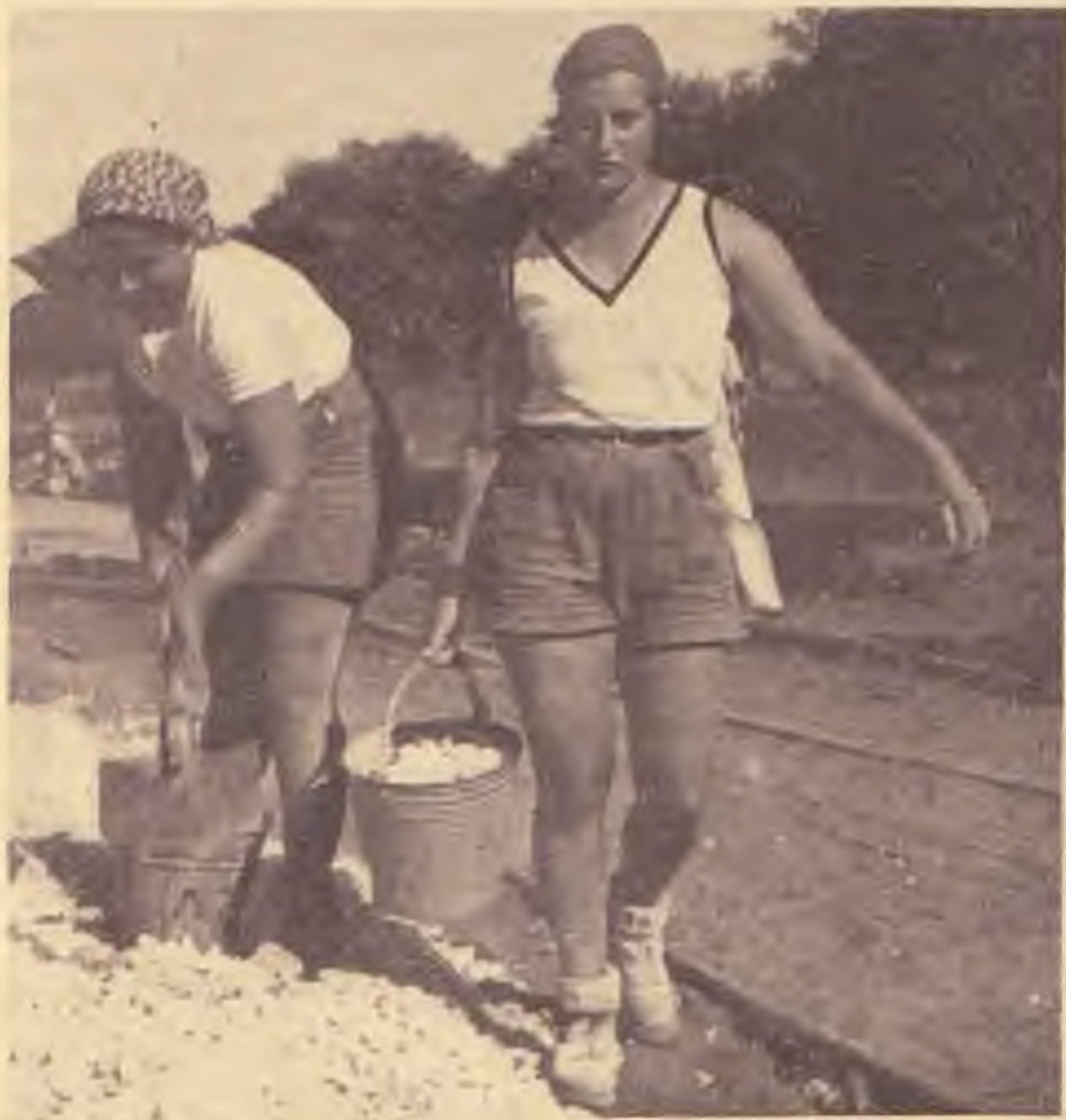
Chalucák építik az új utat.

Üdvözlettel igaz híve David Werner Senator