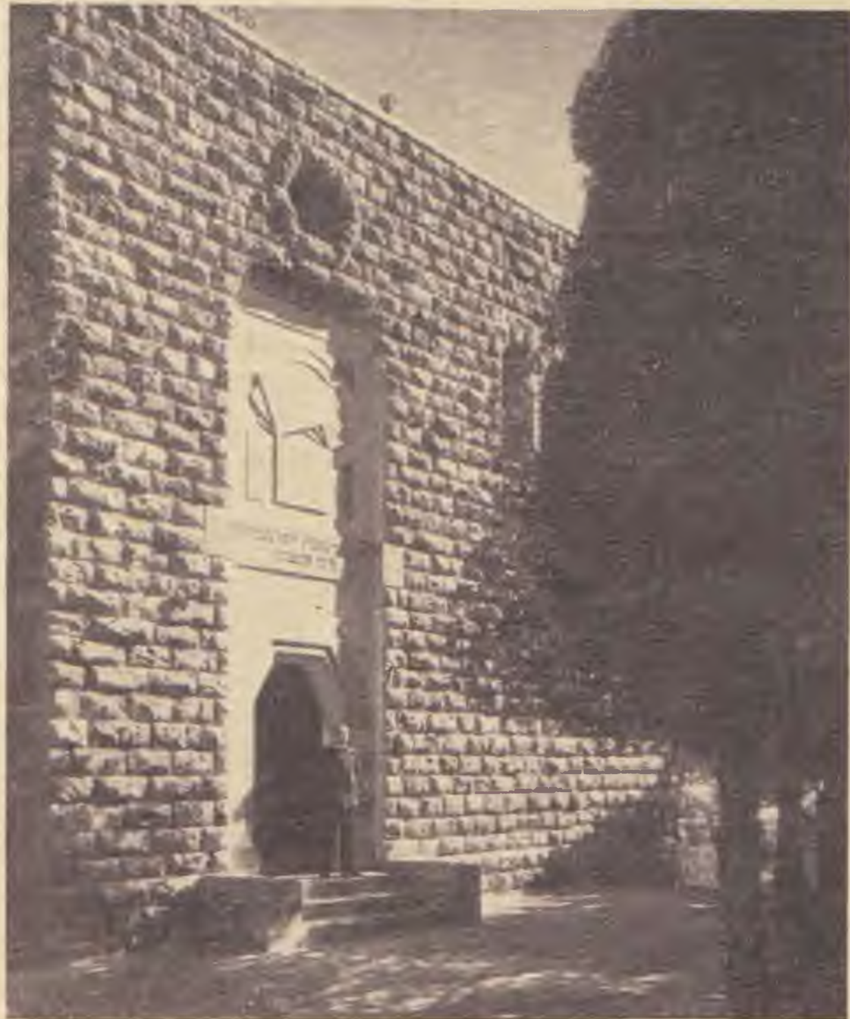
Az Einstein-matematikai intézet bejárata