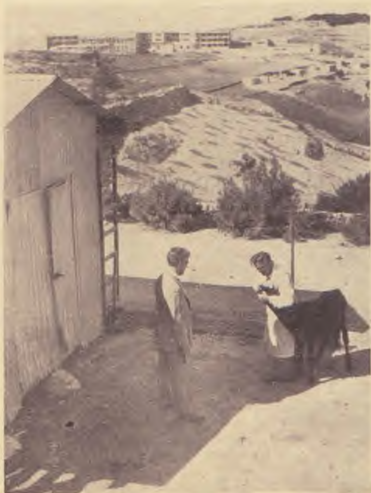
Allatkisérleti állomás a jeruzsálemi Egyetemen

A pesti hitközség épp ezért szívesen támogatja mindenkor a jeruzsálemi Egyetem ügyét és hozzájárulásával lehetővé tette egyes szegénysorsú hallgatók számára a tandíjköltségek viselését. Az idők súlyosbodása egyre nagyobb áldozatokat követel e téren is és a magyar zsidóság, amely mindig kivette részét a nagy kulturális intézmények támogatásából, szeretettel igyekszik résztvenni a jeruzsálemi héber Egyetem kultúrmunkájában, valamint a jeruzsálemi Egyetem könyvtárának támogatásában, amit a magyar kormány és a Magyar Tudományos Akadémia is készséggel tett meg eddig.