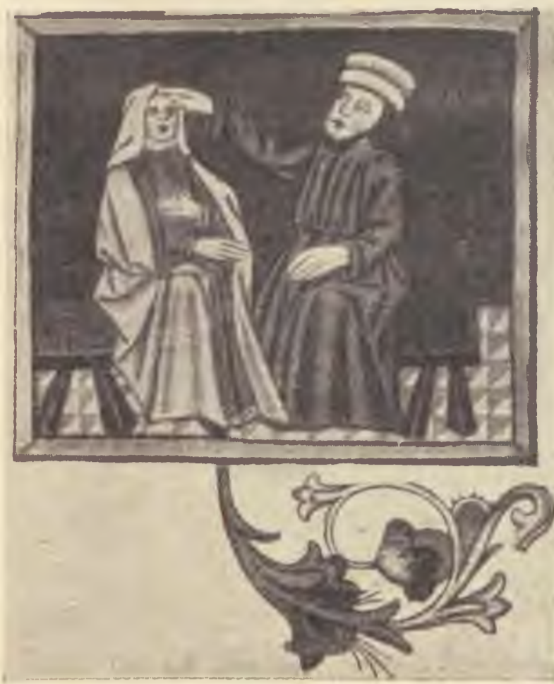
1. „Moraur ze“ (Ez a keserű gyökér)