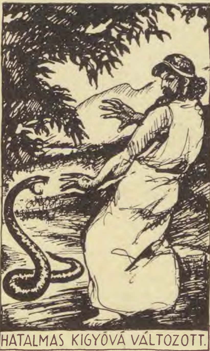
HATALMAS KIGYÓVÁ VÁLTOZOTT.