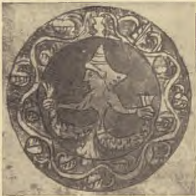
Középkori „medaillon“ figura vatikáni machzorból