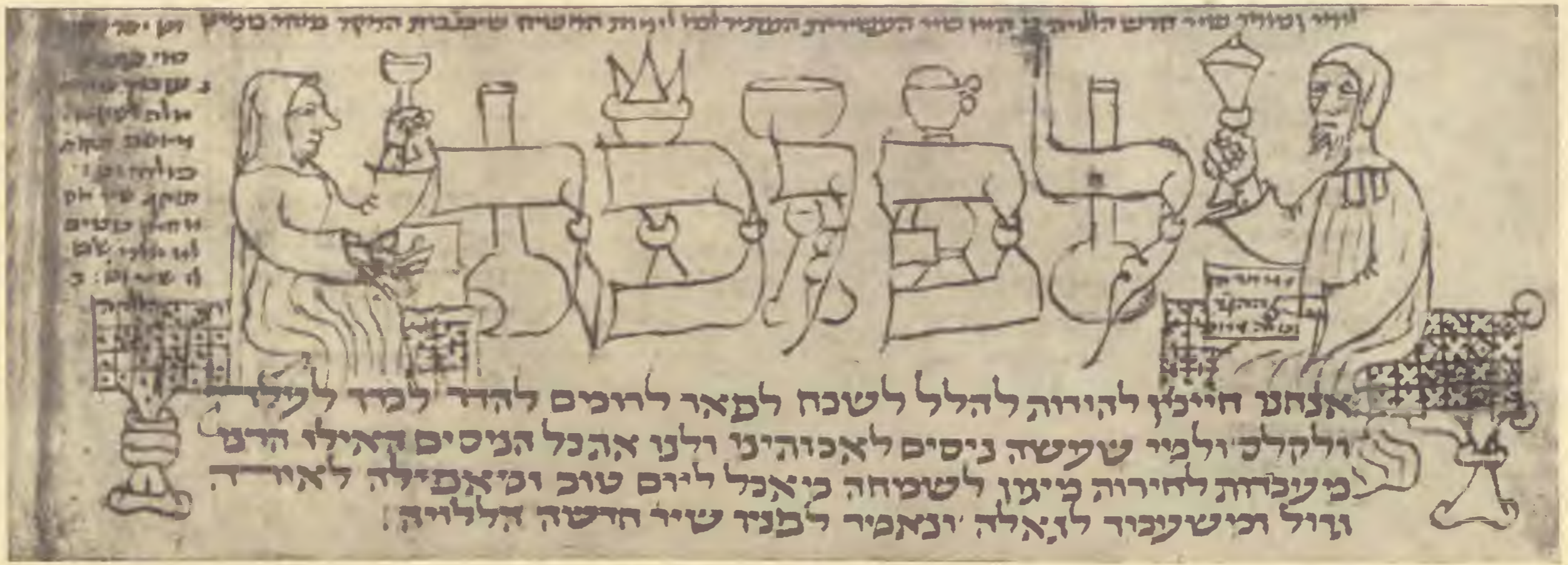
Széderesti jelenet a XIII. századból való vatikáni machzorból