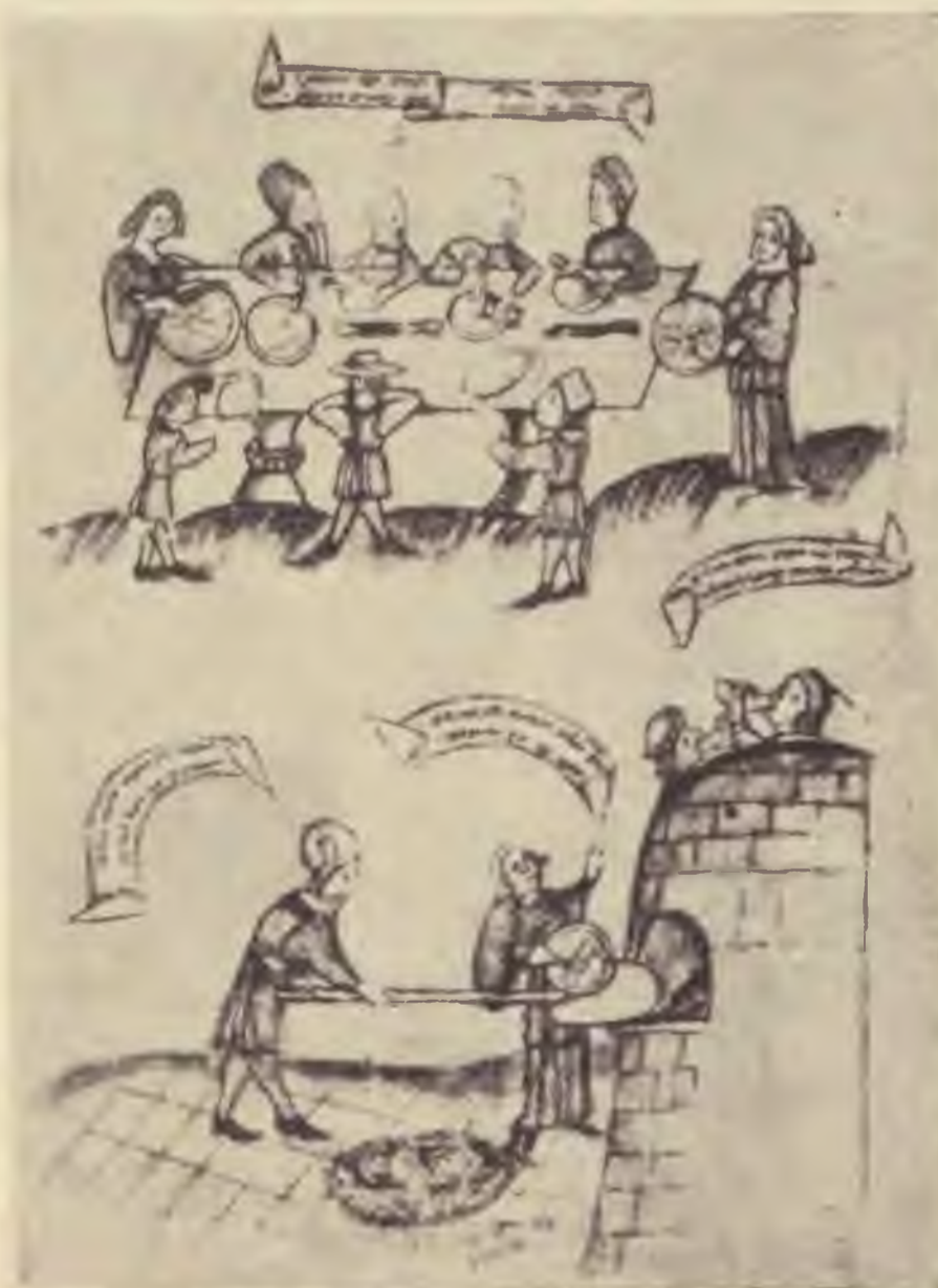
3. Titkos macoth-evők