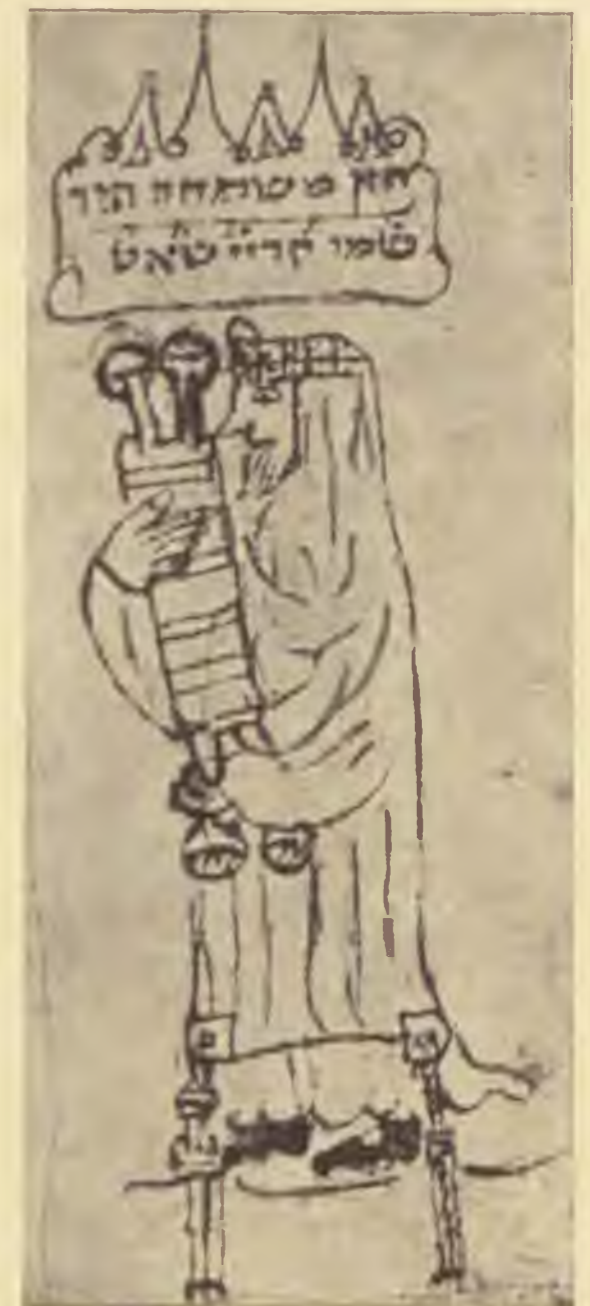
Tóra-kivétel 13. századbeli vatikáni machzorból

Munkácsi Ernő most megjelenő „Miniatürművészet Itália könyvtáiraiban“ című könyvéből