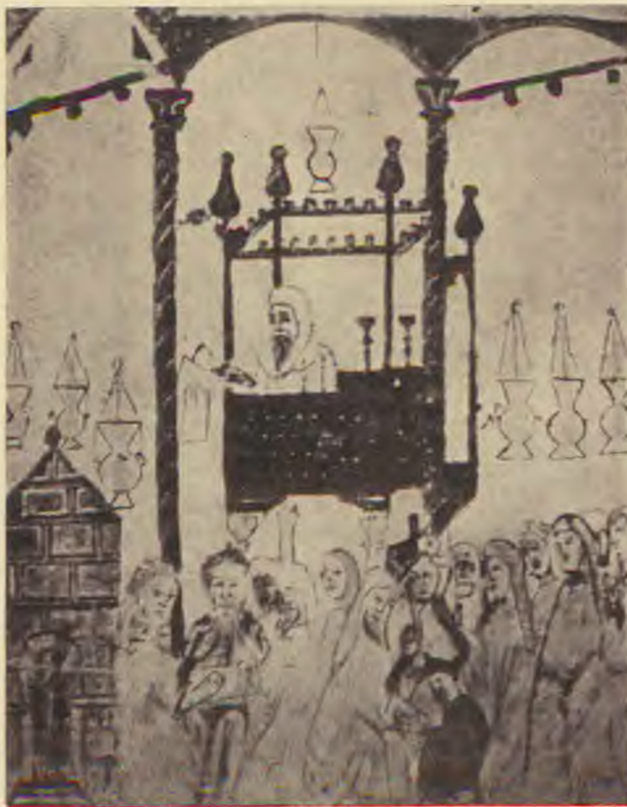
Jelenet pészachi spanyol machzorból, XIII. század

Elmult a nyár, beköszöntött a tavasz, közeledett Pészach ünnepe és a ház üres volt. Az utolsó napokban sem kaptak semmi segítséget. Eljött Pészach előnapja — nem volt a házban semmi kovászos, de nem volt pászka sem, hiányzott a bor is, és az ünnepi ételek mind. És az asszony megkérdezte férjét: „Mit tegyünk? Nemsokára itt