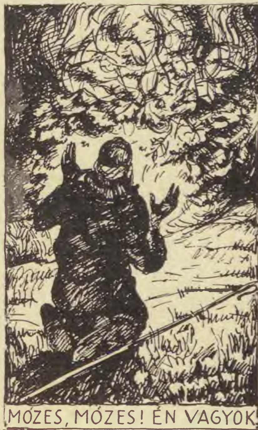
MÓZES, MÓZES! ÉN VAGYOK