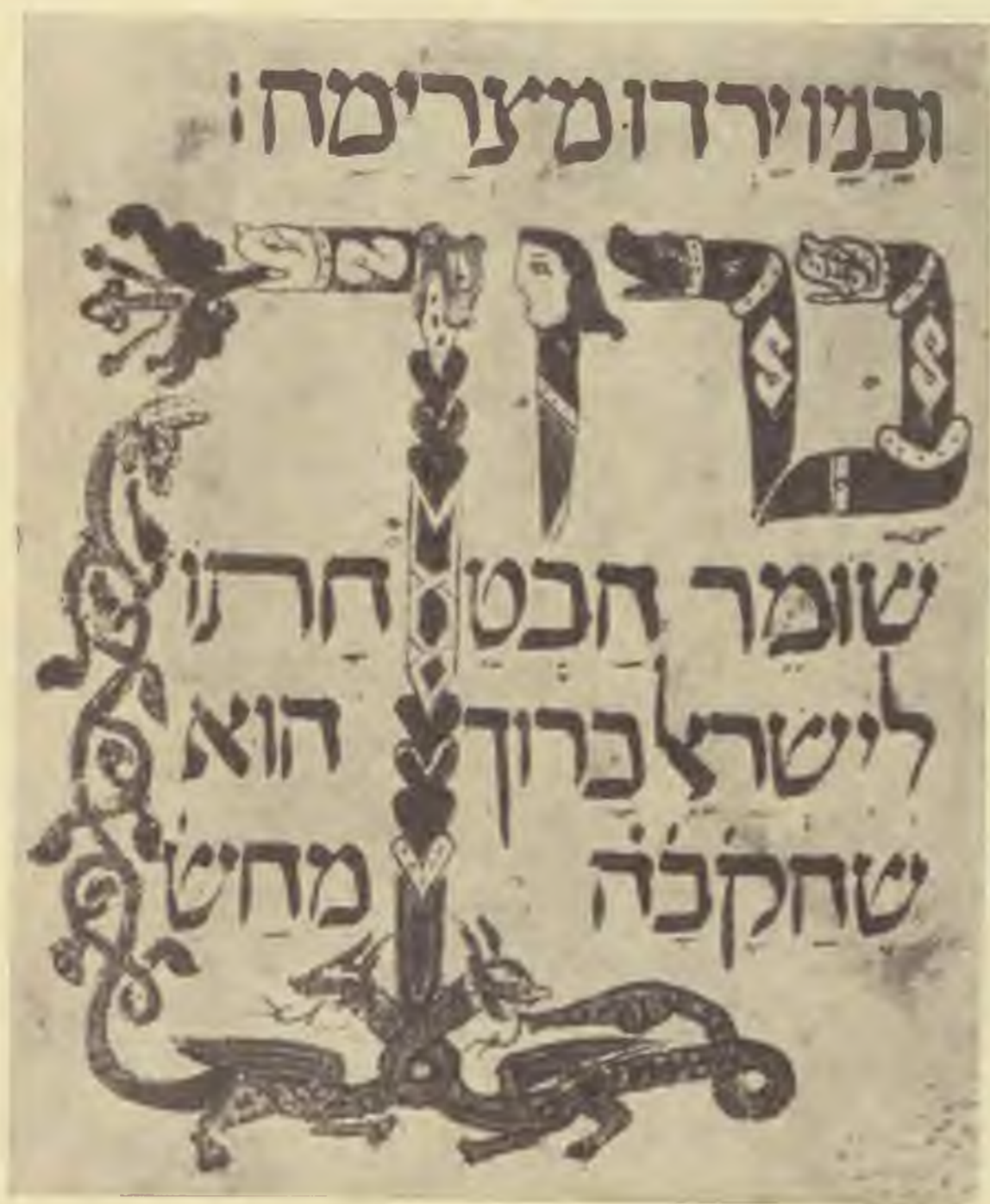
Iniciálé a casanateusei hagadából, XIV. század

Félünnepkor láttam meg csak valójában, hogy mennyire nehéz egy európainak alkalmazkodni ezekhez a szaharai babonás zsidókhöz.