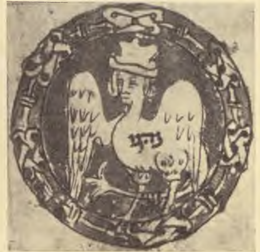
Középkori zsidó fej vatikáni machzorból