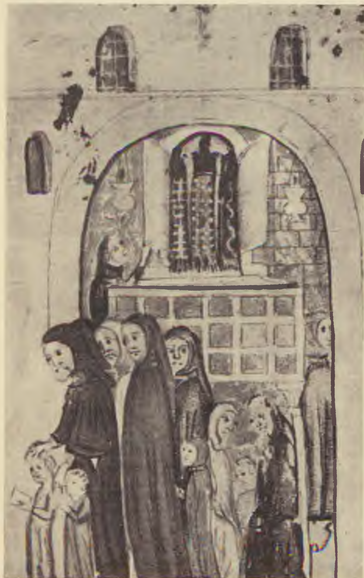
Templomi jelenet a szerajevói hagadából