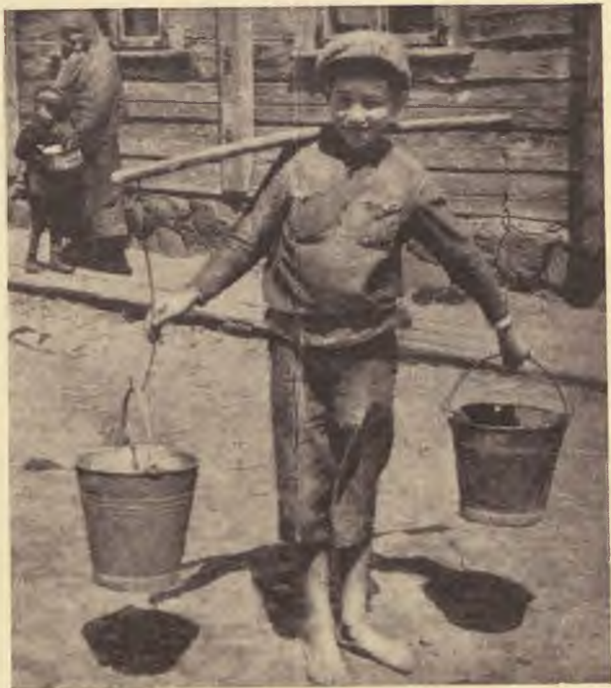
Vizhordó fiú Lengyelországban