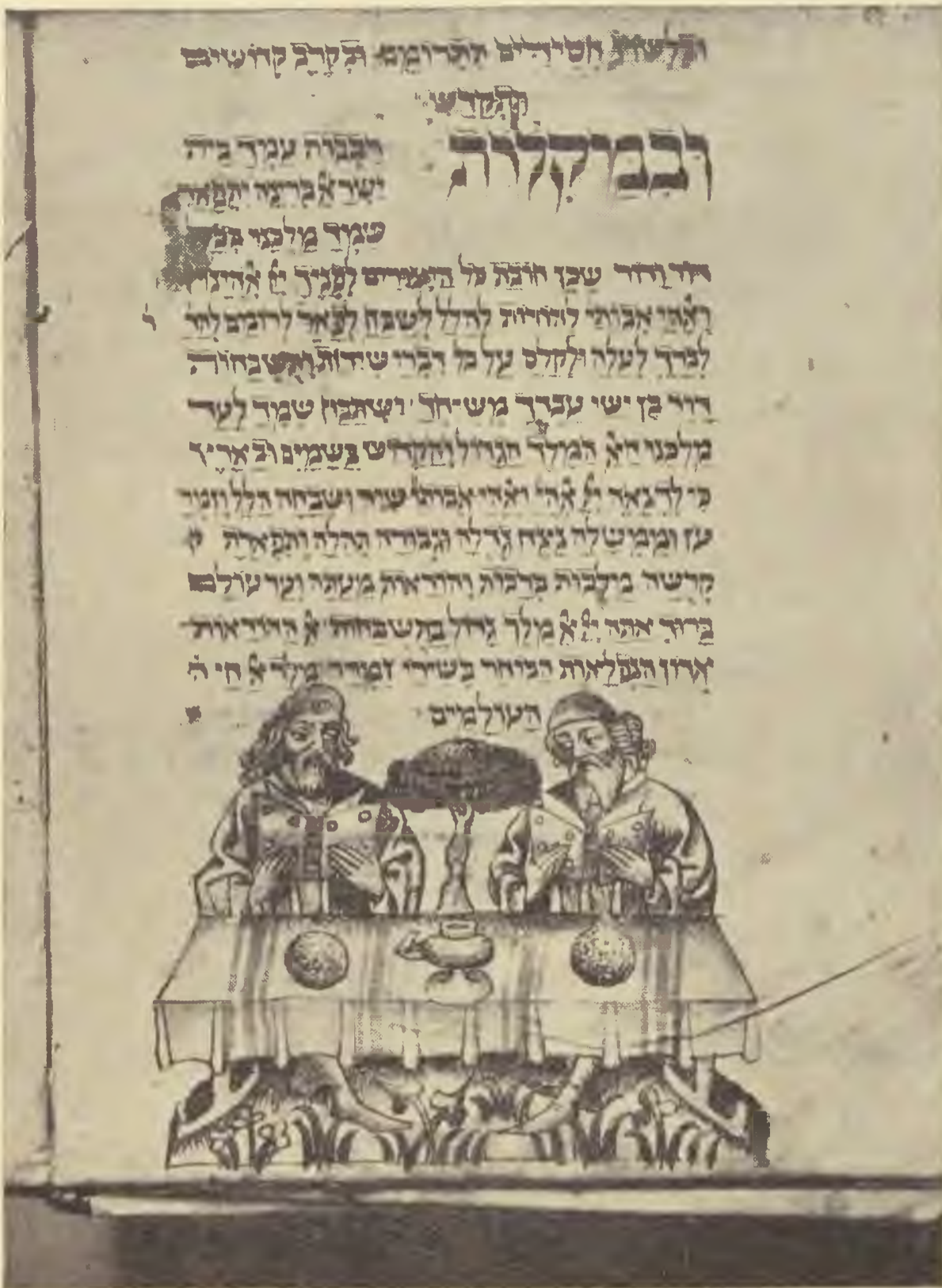
(2) Peszach hagada részlet. Alacsony, kétlábú asztalnál ülnek. Asztal alatt fű. Az asztal letakarva csikos terítővel (talliszar). Asztalon 2 pászka és edény (váza) talán cheroszesz. A fa modellje olyan, mint a többiek. A két alak egy könyvet olvas. Sapka és ruházat hasonló. Szakáll, bajusz és hajfonat kidolgozott. Látni lehet, hogy harisnyát viselnek.

Egy dicsőbb múltnak élt s lett öröklét őre. Köntöse csillagköd. Nem hazudja lelkét Festett délibábnak. Figyel a jövőre S helyette álmodnak a csillagos esték.