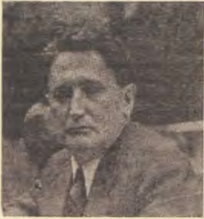
Dr. Nahum Goldmann

Tegnap Bécsben volt, ma Budapesten van, holnap Prágában lesz. A Jewish Agency, a Zsidó Ügynökség legelső ügynöke... Más-kép külügyminisztere. „Miben“ utazik? Rossz cikk. Úgy hívják: Igazság .