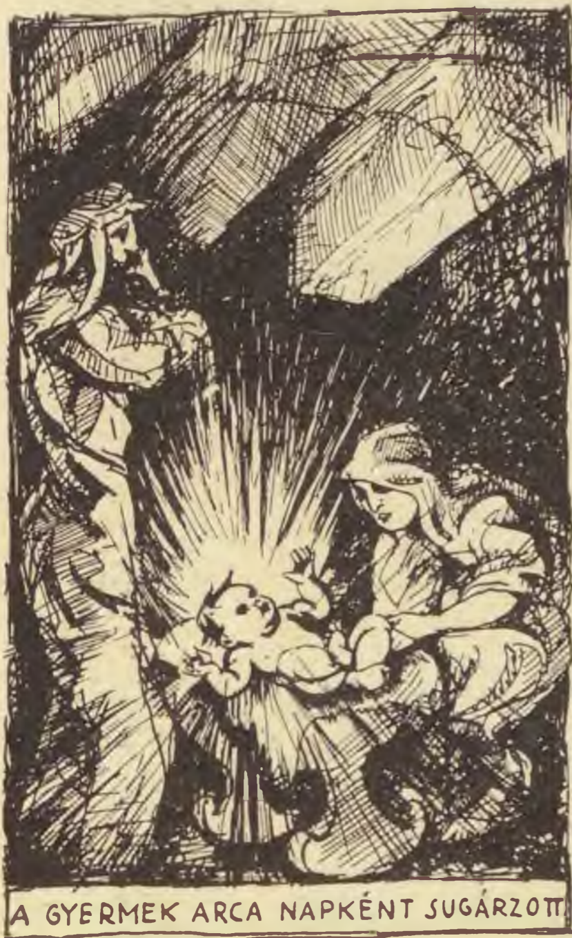
A GYERMEK ARCA NAPKÉNT SUGÁRZOTT

Így végződött Jámbofalfván a mácoh miatt kerkedett mácoh, vagyis a pászka miatt felviharzott patvarkodás.