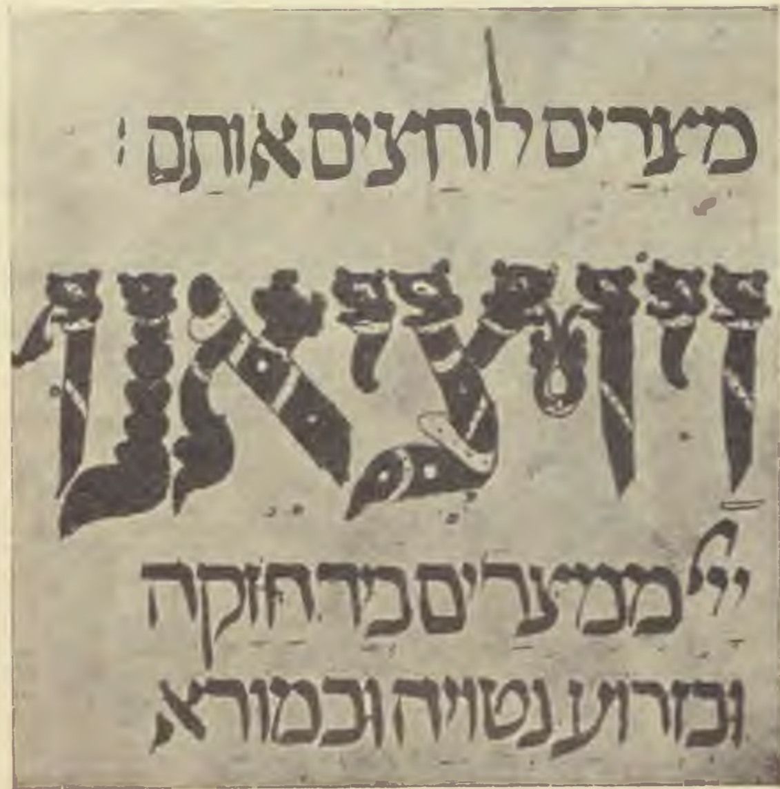
Iniciálé a casanateusei hagadából, XIV. század

tottam ünnepi ruhámra, mely egészen átnedvesedett. Ők ezt rossz előjelnek tekintették, mindannyian megijedtek és kiáltozni kezdtek. Láttam, hogy megzavartam az ünnepet és mindenfelől vad pillantások szegeződtek felém. Én azonban úgy tettem, mintha nem vettem volna semmit