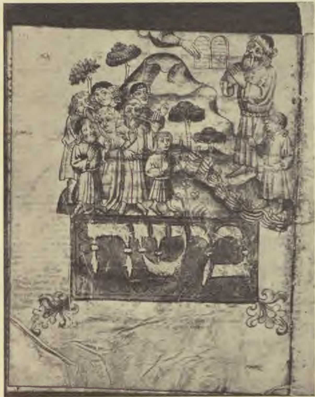
(3) Kinyilatkoztatás. Isten karja kinyúlik. Mózeset a néptől kerítés választja el. A kerítés egyszerű. Mózes mellett levő fiatalember Józua, Nun fia. A nép között hét alak, egy nő. Hajviseletet lásd előbbi képeken. A nő ruházata földig ér. Szinai hegyéről láva ömlik.

Bár a perspektíva ennél a rajznál is sok kívánni valót hagy maga után, kétségtelen, hogy egy rendkívül érdekes művészi kompozíciót látunk magunk előtt. Az áhítat, az elragadtatás és az ihlet lelki érzelmeit a művész biztos kézzel festette meg. Az alakoknak egymás mellé való állítása természetes és nem mesterkélt. Arc kifejezésük sokatmondó és bizonyos, hogy ezek az alakok vonásaikban is a sokat szenvedett, de ősi vallásukhoz életük árán is ragaszkodó középkori német zsidóság típusát őrizték meg.