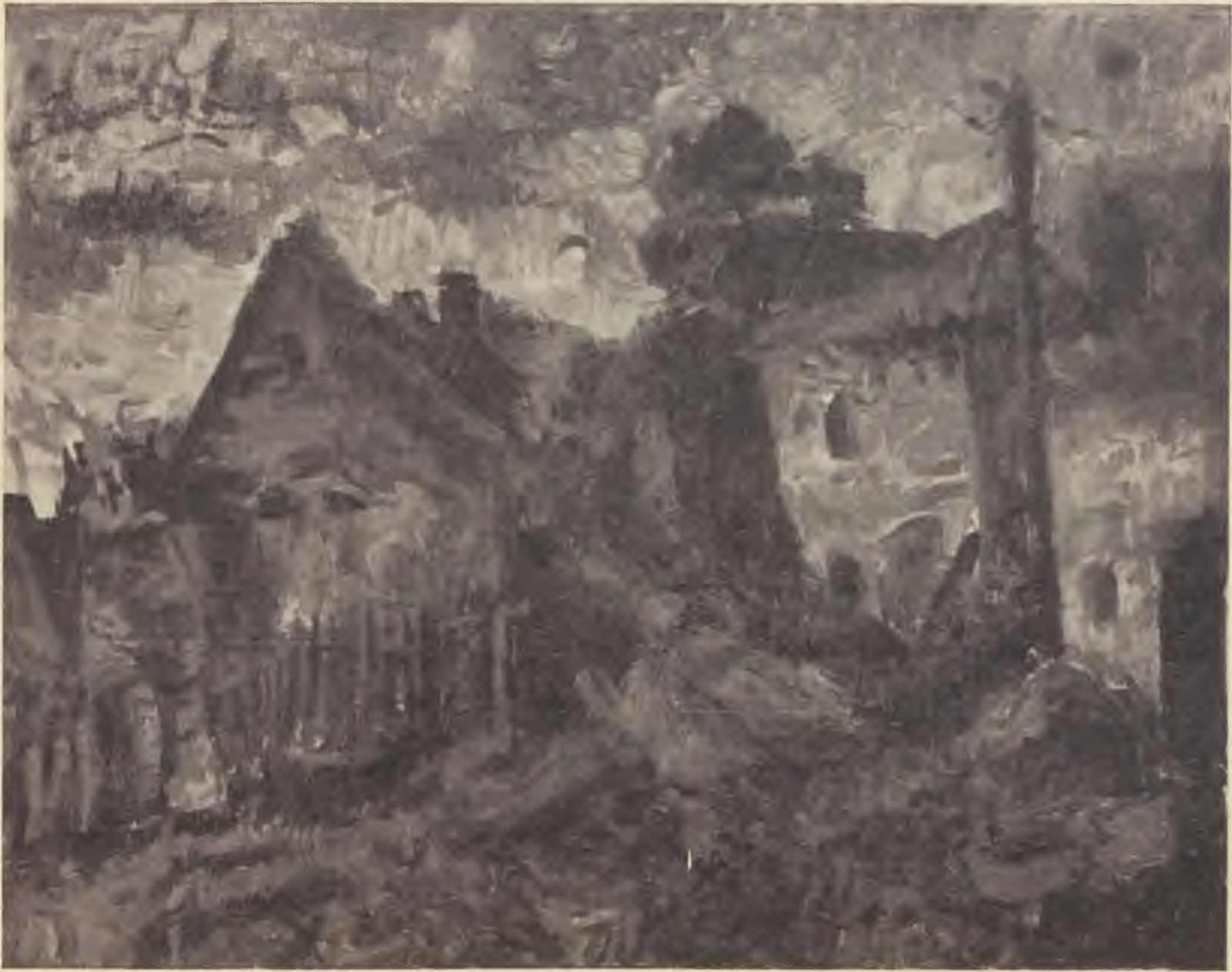
Diener-Dénes Rudolf: Falu