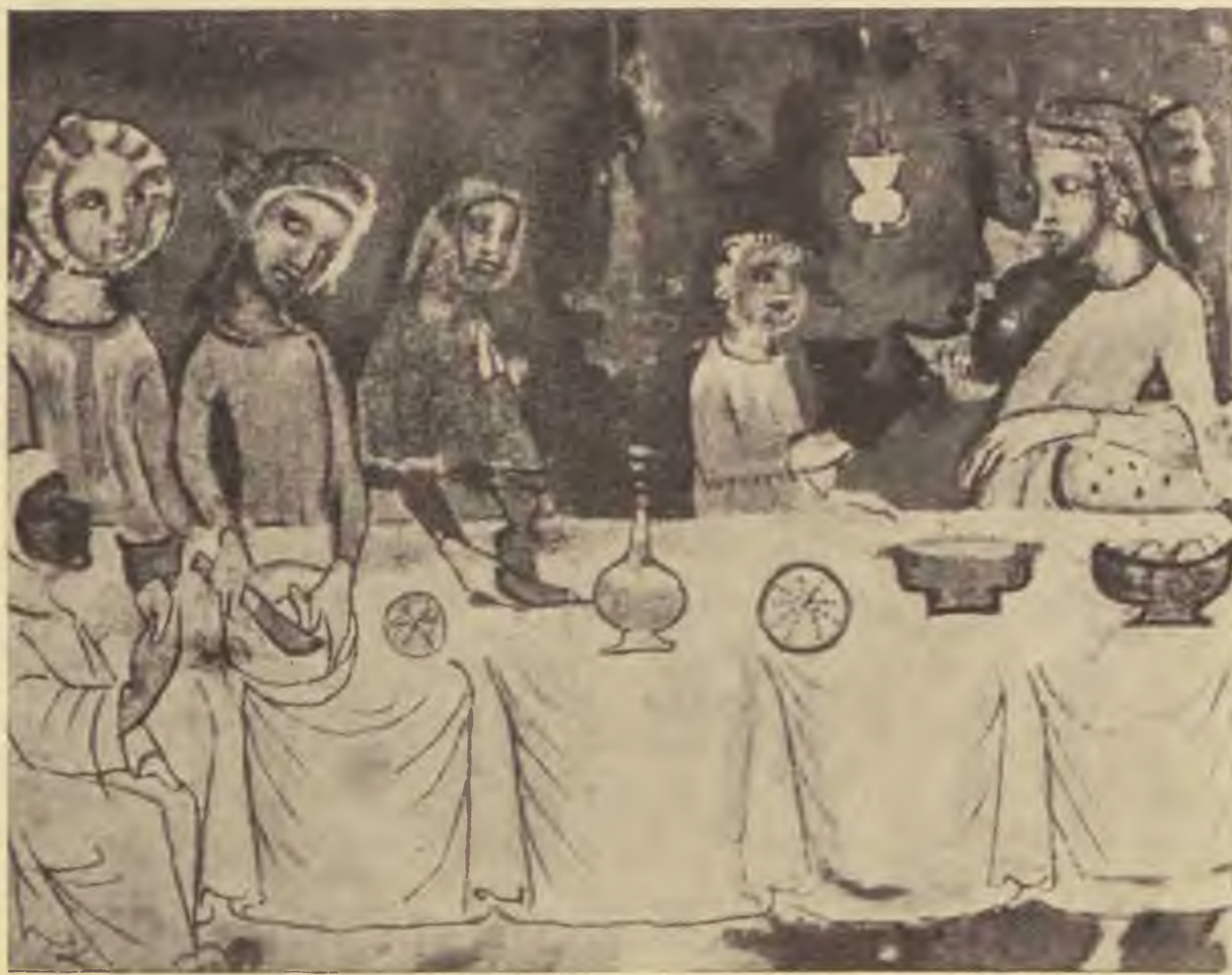
Széderesti jelenet a szerajevói hagadából