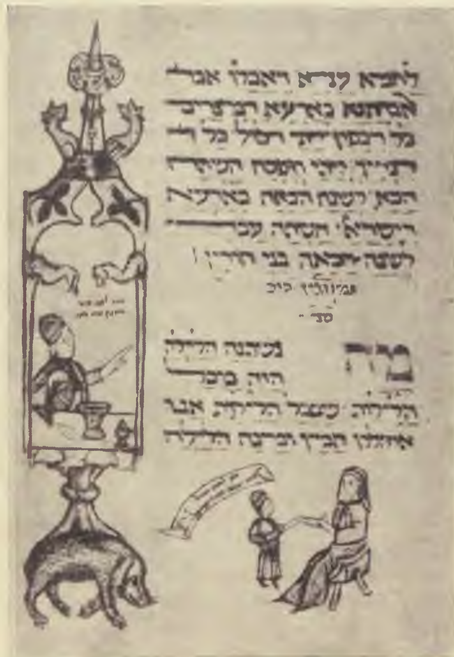
2. Vigyázat a borivásnál!