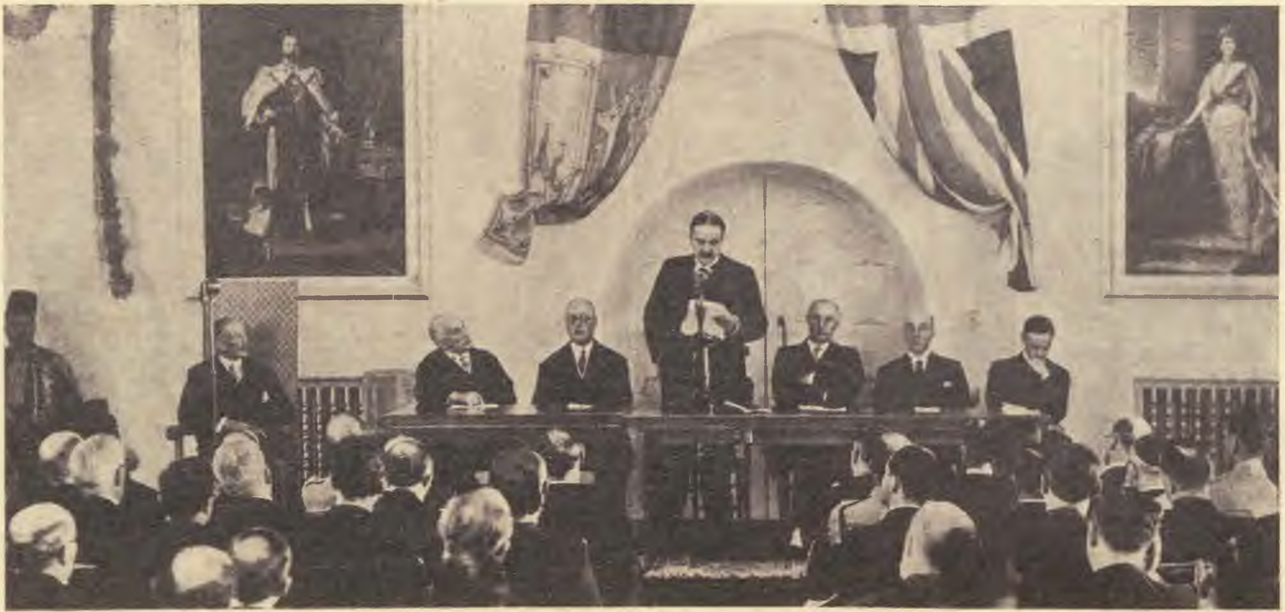
Az angol Királyi Bizottság ülése Jeruzsálemben. Közepén Lord Peel áll, balra ül az angol király képe alatt a kormányzó