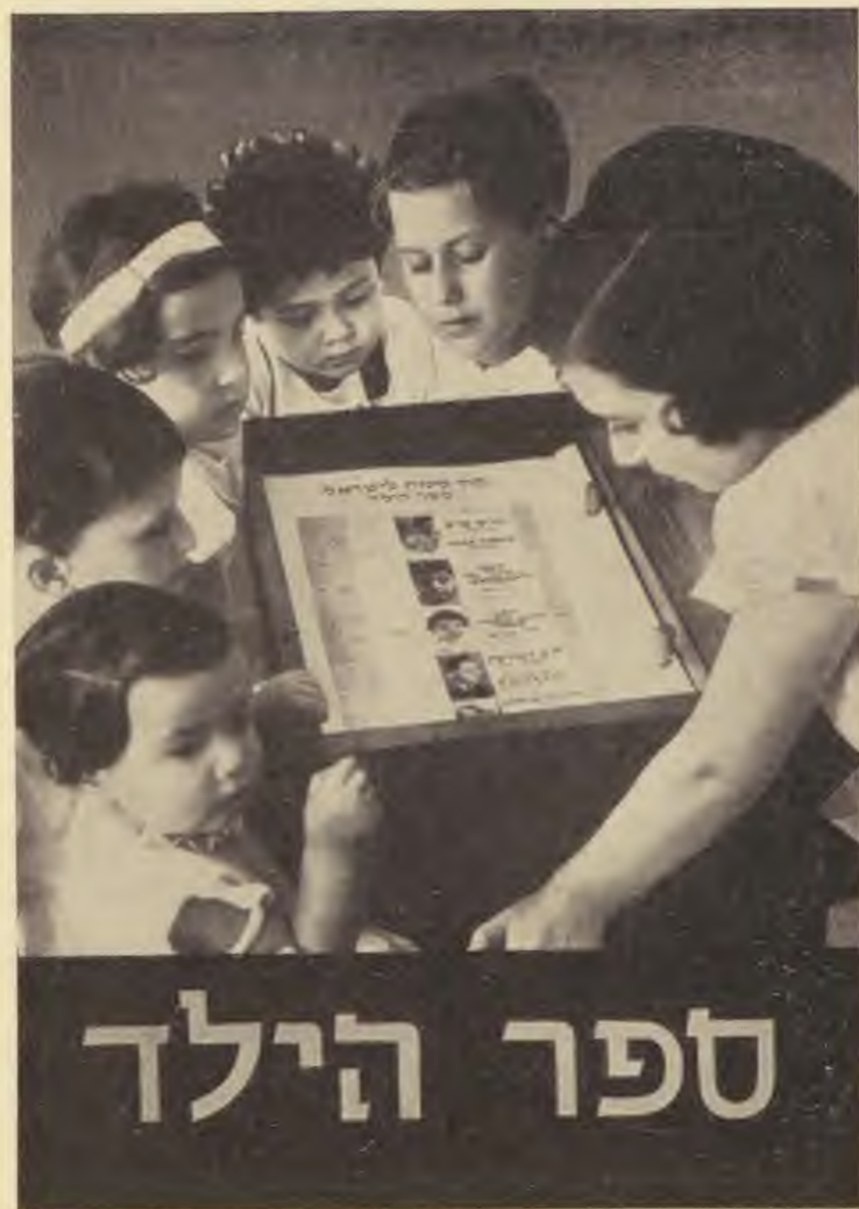
A KKL gyermekkönyve Jeruzsálemben

A Keren Kayemeth magyarországi irodája: Budapest, Andrássy út 67.