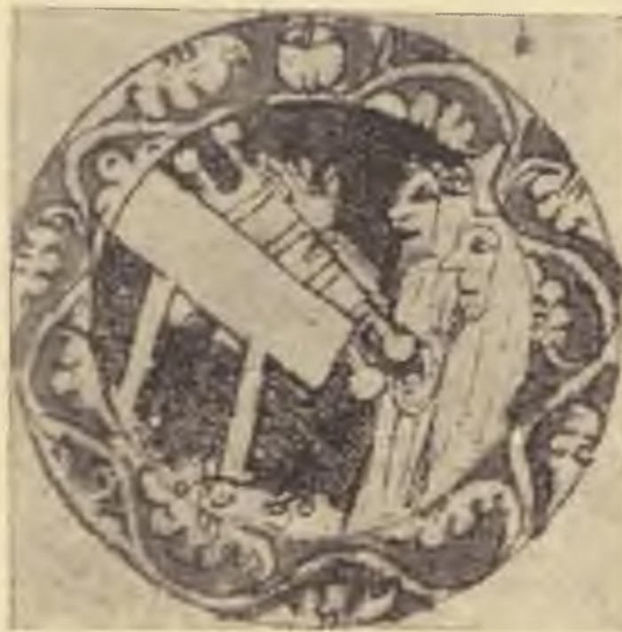
Tóra-olvasás vatikáni machzorból