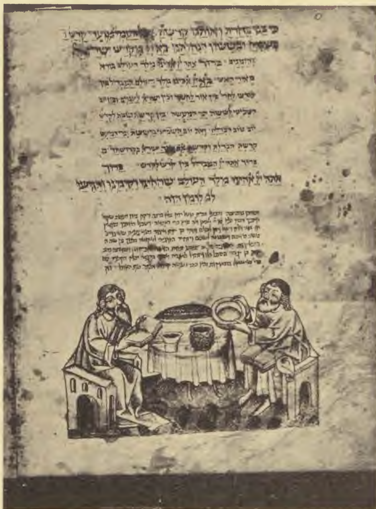
(1) Széder este. A ruházat redőnye kidolgozott. Az asztal gömbölyű. A baloldalon ülő széke gótikus vártoronszerű. Az asztalon váza és kehely. A jobboldali egy tálat emel fel, amelyben macot van.

A háttérben Sinaj magas hegye, amelyről láva ömlik le. Isten keze kinyúl a hegytető felett és átadja a két köztáblát az ottálló Mózesnek, aki imádságra kulcsolt kezekkel