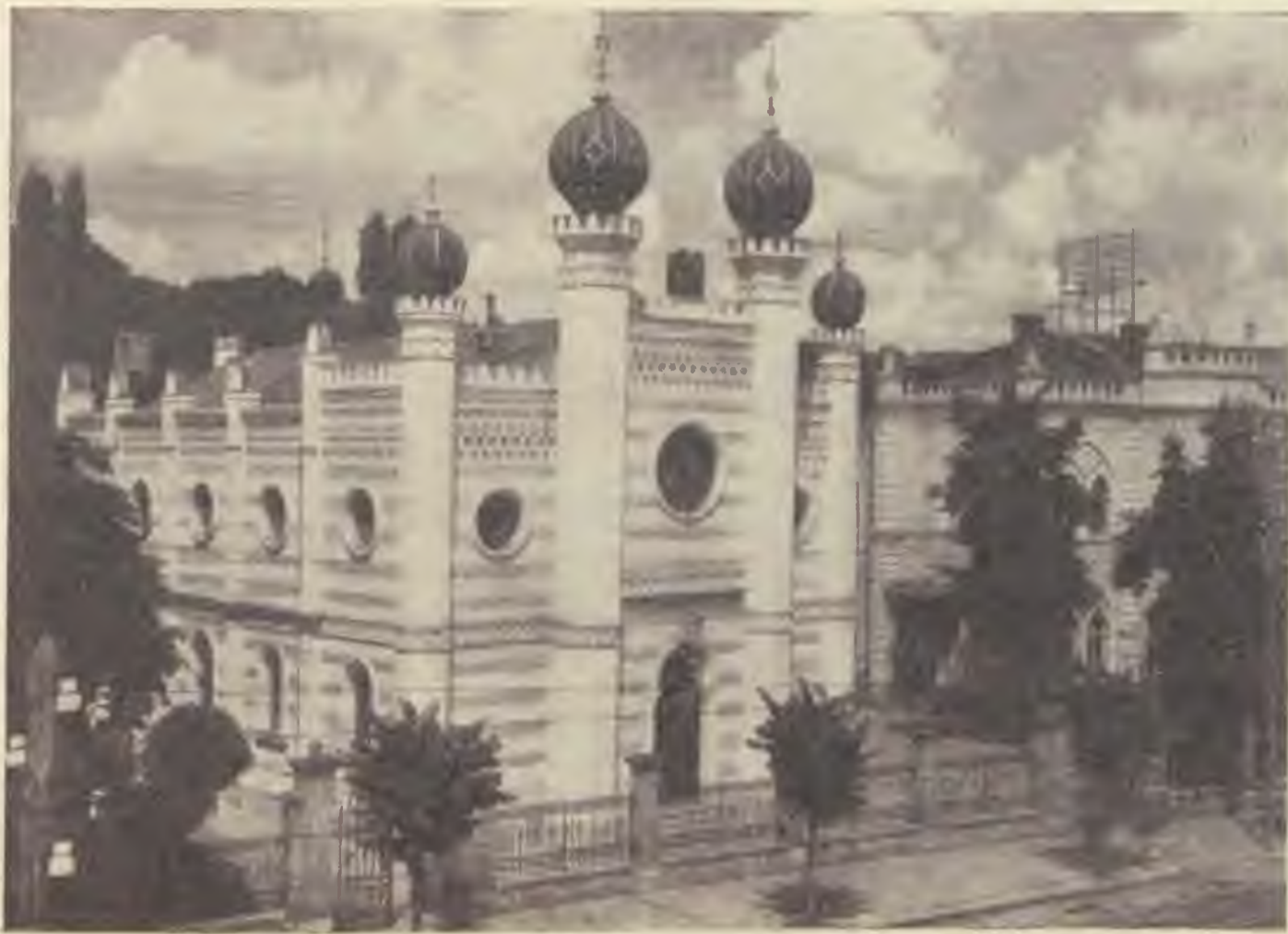
A jubiláló kolozsvári templom